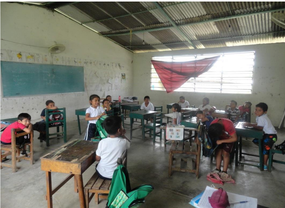
Los niños en sus actividades en clase. Con intereses diferentes de aprendizaje.