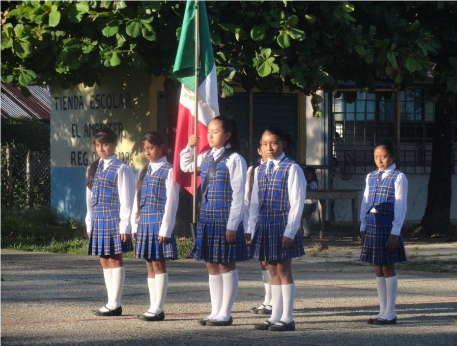
Escolta de la escuela primaria “Santos Degollados” por los honores a la bandera como todos los lunes.