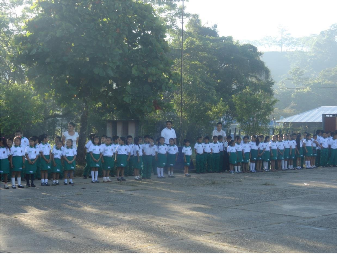
Los alumnos y profesores en el patio escolar preparándose para realizar los honores a la bandera.