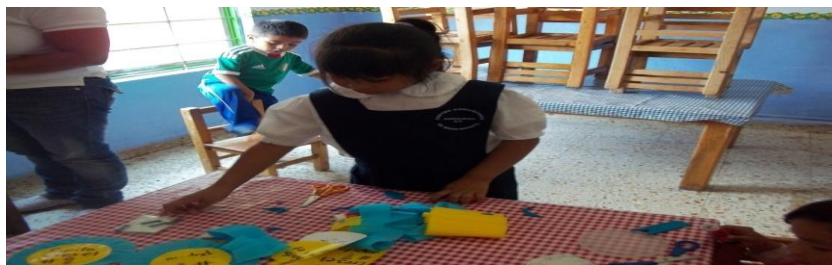
Imagen propia de las actividades propuestas.

Los indicadores que se trabajaron a lo largo del proyecto fueron Control y precisión.