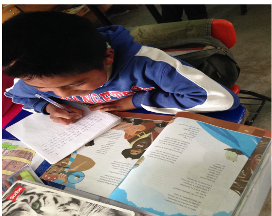
En clase de Español copiando un texto del libro

Estas categorizaciones me han servido para analizar los énfasis en las prácticas de docentes en la escuela de la cual he venido hablando, ya que son ellos los que me ocupan en este momento. he observado que en ésta escuela bilingüe, existen prácticas arraigadas que hacen que no siempre se creen las condiciones más adecuadas para que los niños aprendan de la mejor manera.