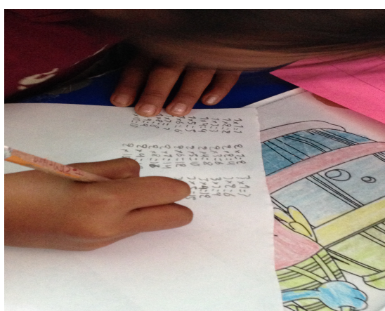
Para aprender las tablas, las planas son las que predominan.