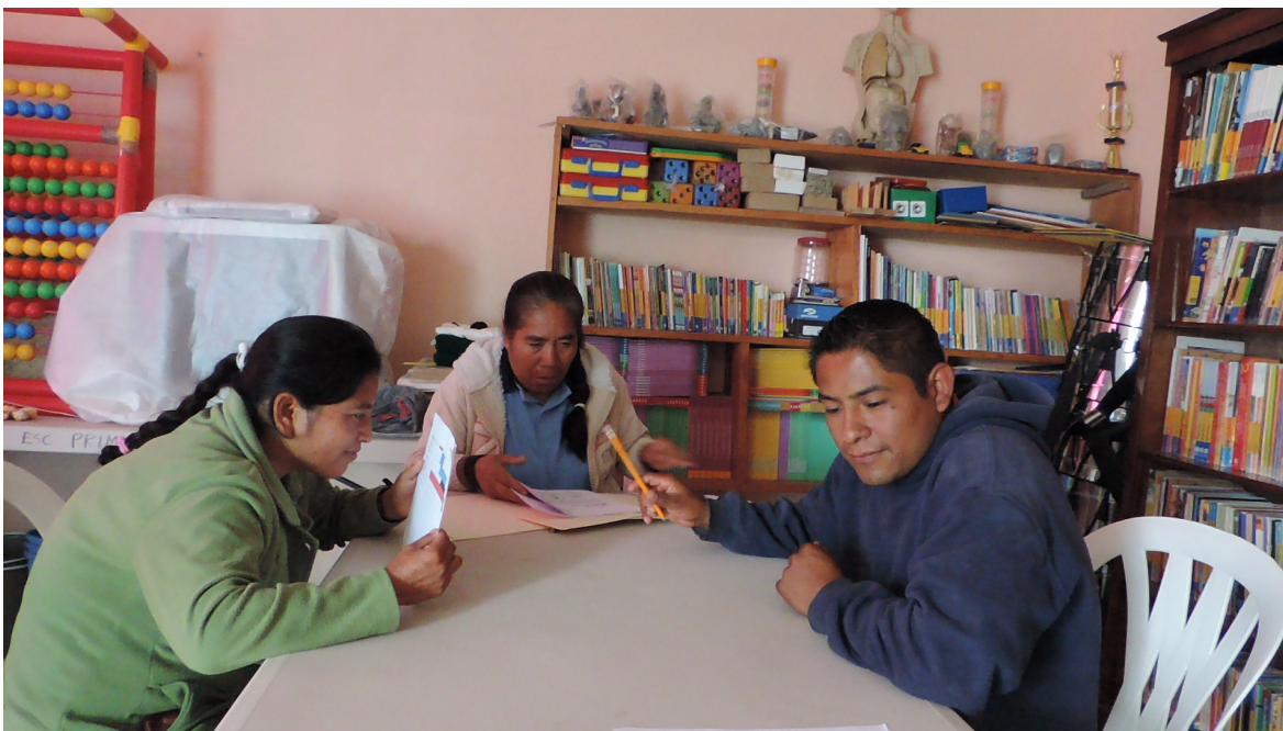
Foto de los docentes de la Escuela Primaria “Ovidio Decroly”, durante la entrevista.

“Aquí la hacemos de papá, la hacemos de doctor, la hacemos de todo, porque, este, no nos concretamos solamente a enseñar, a instruir a los alumnos, sino que, pues aquí, este, se trata de apoyar a los pequeños en todo”. 6