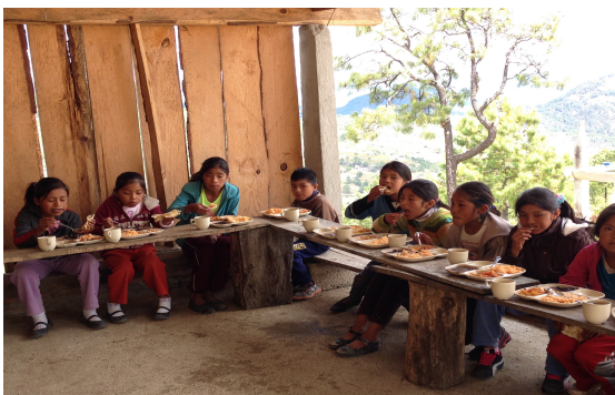
Imagen de los niños en el comedor comunitario