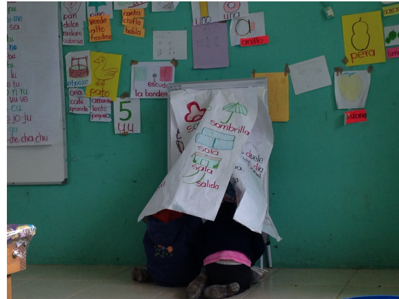
Intentando copiar un trabajo, aplicados

En estas fotos son parte de los datos que recogí en mi trabajo de campo. Se pueden observar a los niños trabajando en horas de clases.