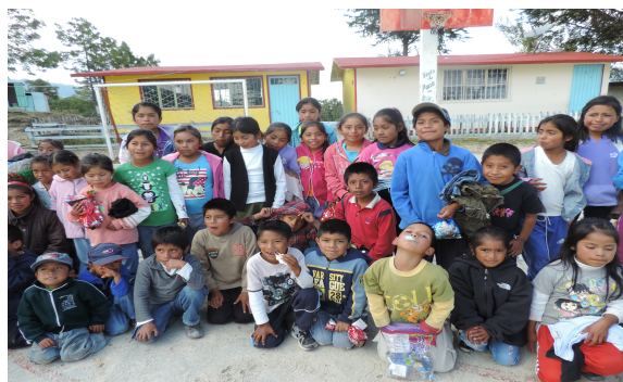
Alumnos de la Primaria "Ovidio Decroly"