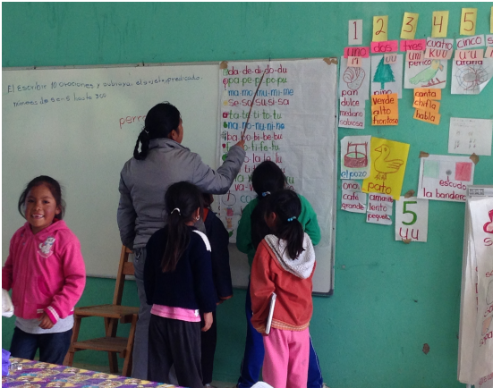
Maestra de 1er grado en clase de lengua