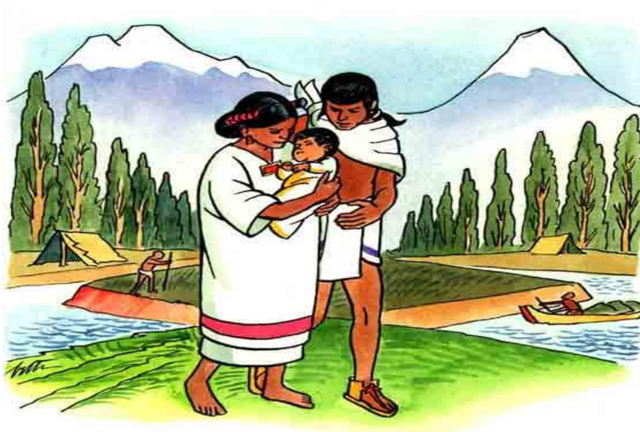
Ilustración: Alberto Beltrán.