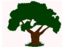
JUN KÚUL CHE