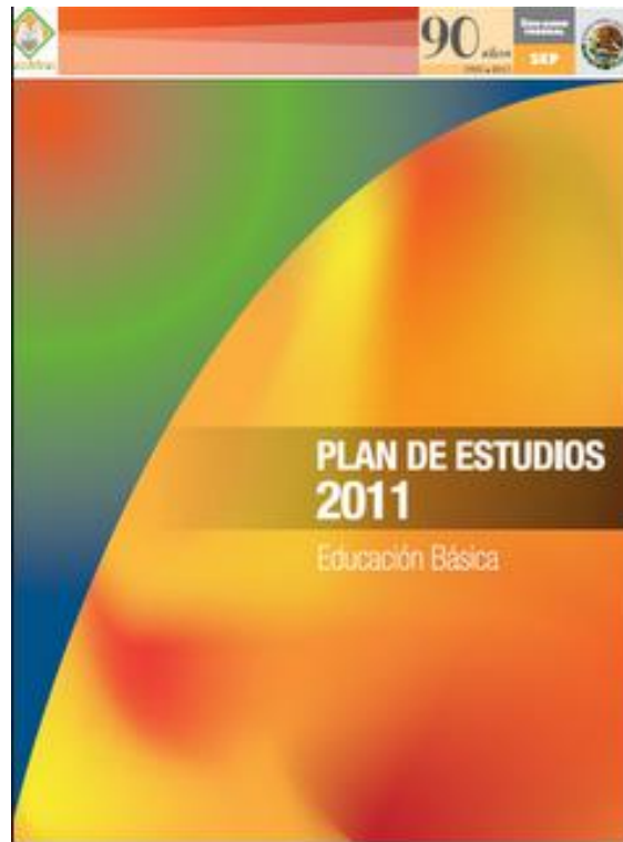
Plan de estudios 2011. Educación Básica

El primero de los Planes, es el Plan de Estudios 2009, Educación Básica, Primaria, se divide en siete apartados, en el apartado inicial se analiza a la educación básica en el contexto nacional e internacional, en el segundo se exponen los principales retos identificados que el país tiene para ofrecer educación de calidad, en el tercero se describen los elementos centrales que se consideraron para definir el nuevo currículo de educación primaria, en el cuarto se define qué se entiende por articulación de la educación básica, en el quinto se presenta el perfil de egreso y en el sexto se refieren cuatro características que son sustantivas en este nuevo plan de estudios: la atención a la diversidad, la importancia de la interculturalidad, el énfasis en el desarrollo de competencias y la definición de los aprendizajes esperados en cada grado y asignatura, así como la incorporación de temas que se abordan en más de un grado y asignatura. En el apartado siete se presenta la estructura del mapa curricular de la educación básica (ver Anexo 1); de manera específica, el de educación