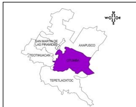
Mapa 1. Ubicación Otumba, Edo. México

La Estancia Infantil “Lic. Mónica Pretelini de Peña” se encuentra ubicada en el municipio de Otumba, Edo. De México y se localiza en el extremo oriente del Estado de México, limita al norte con el municipio de Axapusco; al sur con el municipio de Tepetlaoxtoc; al sureste con el estado de Tlaxcala; al este con estado de Hidalgo y al oeste con el municipio de San Martín de las Pirámides.(Ver mapa 1) 1