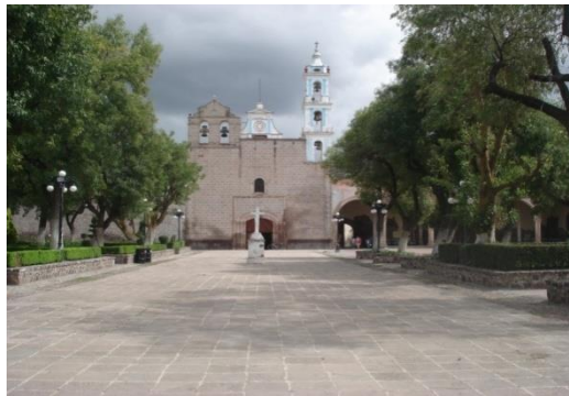
Foto 1. Ex convento de la Purísima Concepción Otumba

Dentro de la comunidad está la iglesia ex-convento de la Purísima Concepción Otumba, construcción franciscana (Ver foto 1), y el ex-convento de San Nicolás Oztotipac, ambos del siglo XVI.