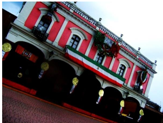
Foto 3. Casa de Cultura y Museo Gonzalo Carrasco