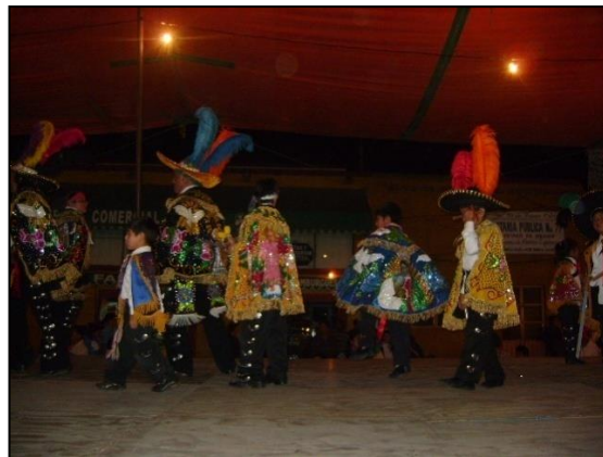
Foto 2 Danza de Moros y Cristianos.

En la Danza de moros y cristianos (Ver foto 2) se puede observar que a través de la familia se va convirtiendo en tradición esta participación, ya que si los papás tienen la costumbre de participar en la danza, entonces también algunos de sus hijos pequeños participan: es así como esta tradición va de generación en generación. Esta danza es una tradición, por lo que nunca falta en dicha fiesta patronal. Todos los participantes ensayan en la misma iglesia con meses de anticipación para llevarla a cabo llegado el día de la presentación.