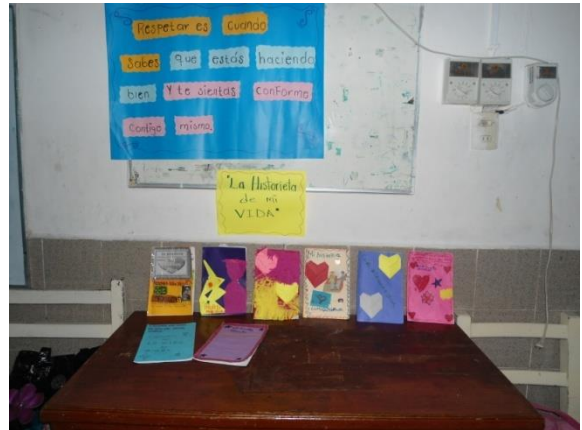
Actividad: cierre- exposiciones de los diferentes trabajos realizados a lo largo del taller.