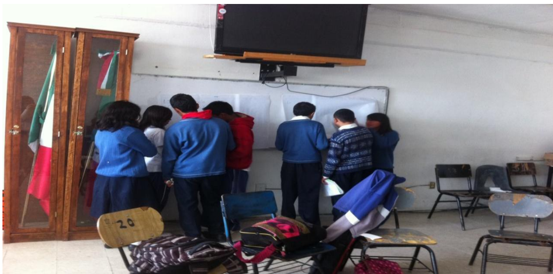
Fig. 2. Participantes del Taller de Prevención de Ideación Suicida.

Nota: La foto muestra a los participantes durante la cuarta sesión del taller, mientras organizan su exposición en equipos.