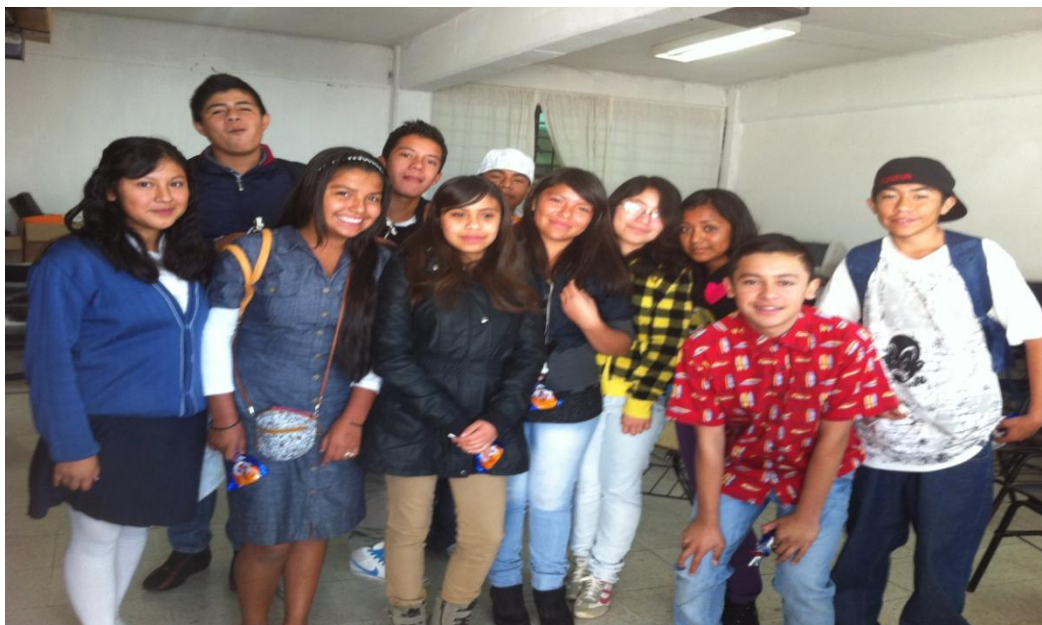
Fig. 5. Participantes del taller al finalizar la última sesión.

Nota: Al final del taller, los participantes mostraron su interés por formar parte de más talleres que ayuden en su desarrollo y formación personal.