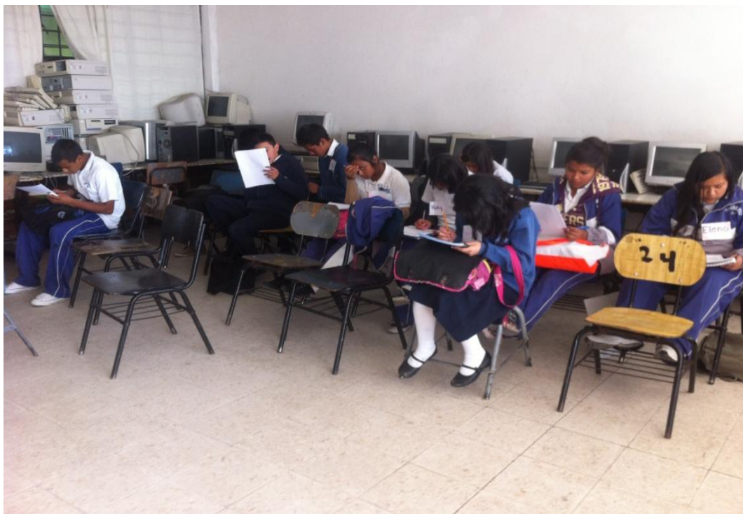
Fig. 1. Alumnos de 3º año de la Escuela Secundaria Teozentli.

Nota: En la imagen se observa a los participantes del taller, durante la primera sesión.