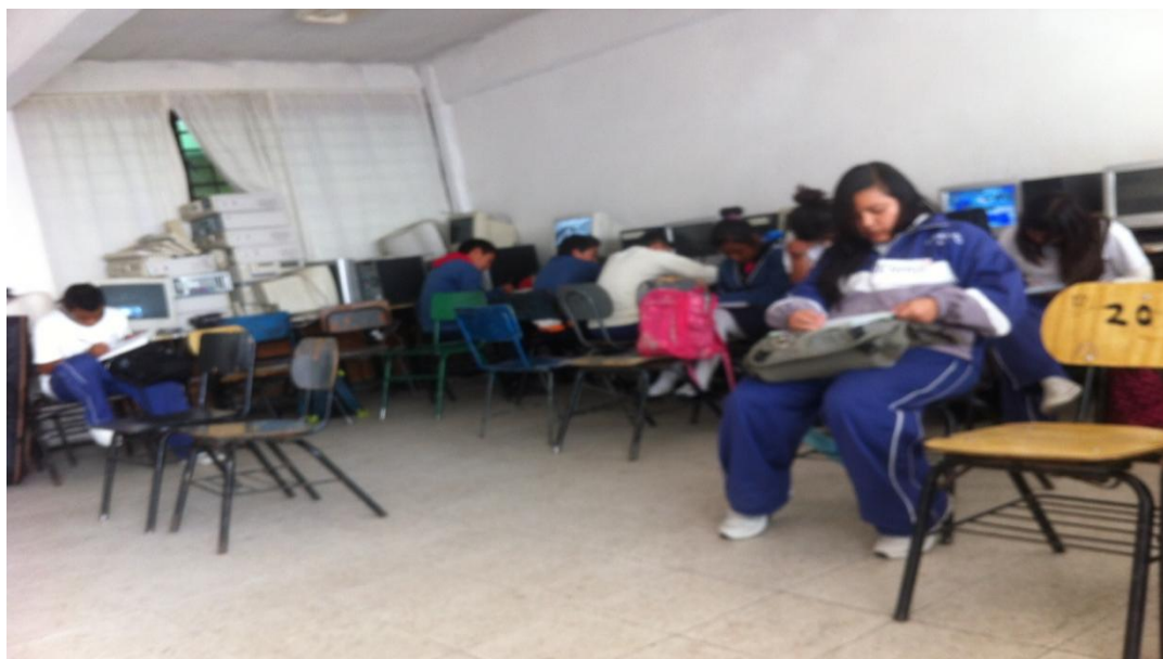
Fig. 3. Participantes durante la quinta sesión del taller de Prevención de Ideación Suicida.

Nota: La foto muestra a los participantes al inicio de la quinta sesión, mientras se les da indicaciones de la sesión.