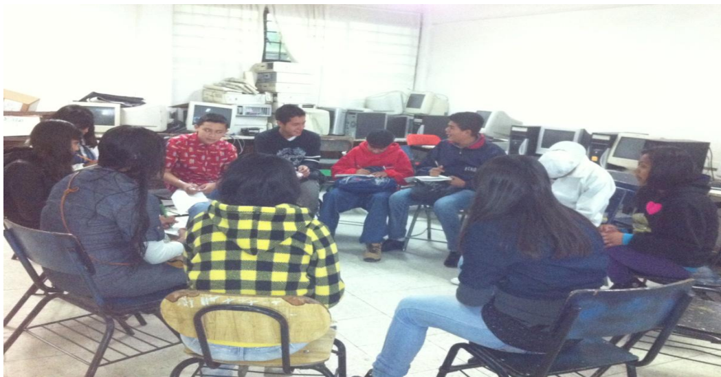
Fig. 4. Participantes en la última sesión del taller.

Nota: Los participantes sentados formando un círculo, durante la última sesión del taller, mientras expresan sus opiniones del taller.