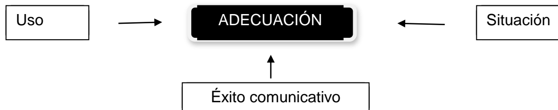
Esquema 1. Adecuación

Unamuno (2003, p.25) crea un esquema de un concepto muy importante, la adecuación, entre determinadas formas lingüísticas y la situación en la que se usan.