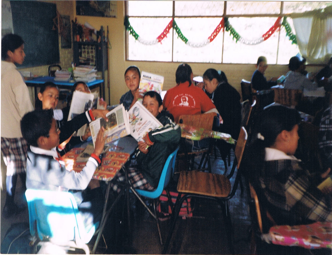
Exploración de libros.