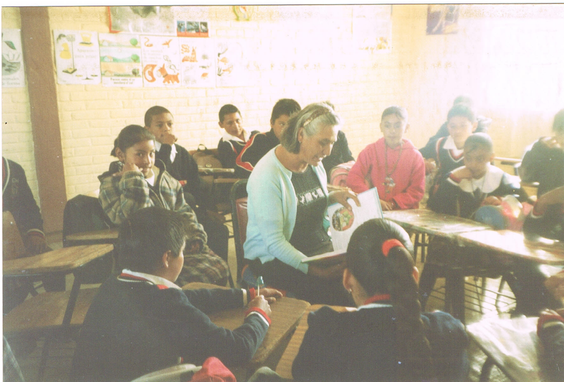
Lectura del cuento contado por una abuelita.