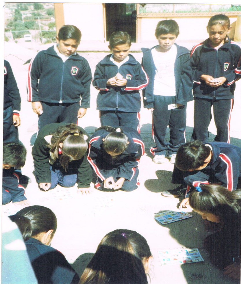
Inventando un cuento con la lotería.