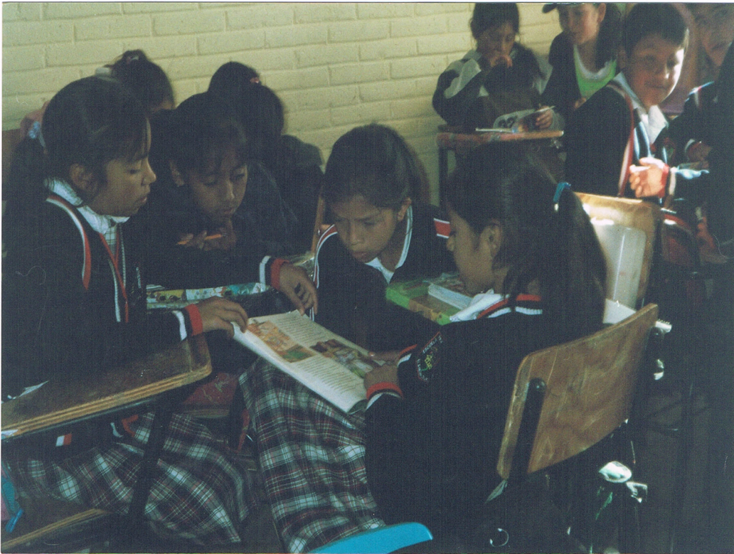
Leyendo en equipo.