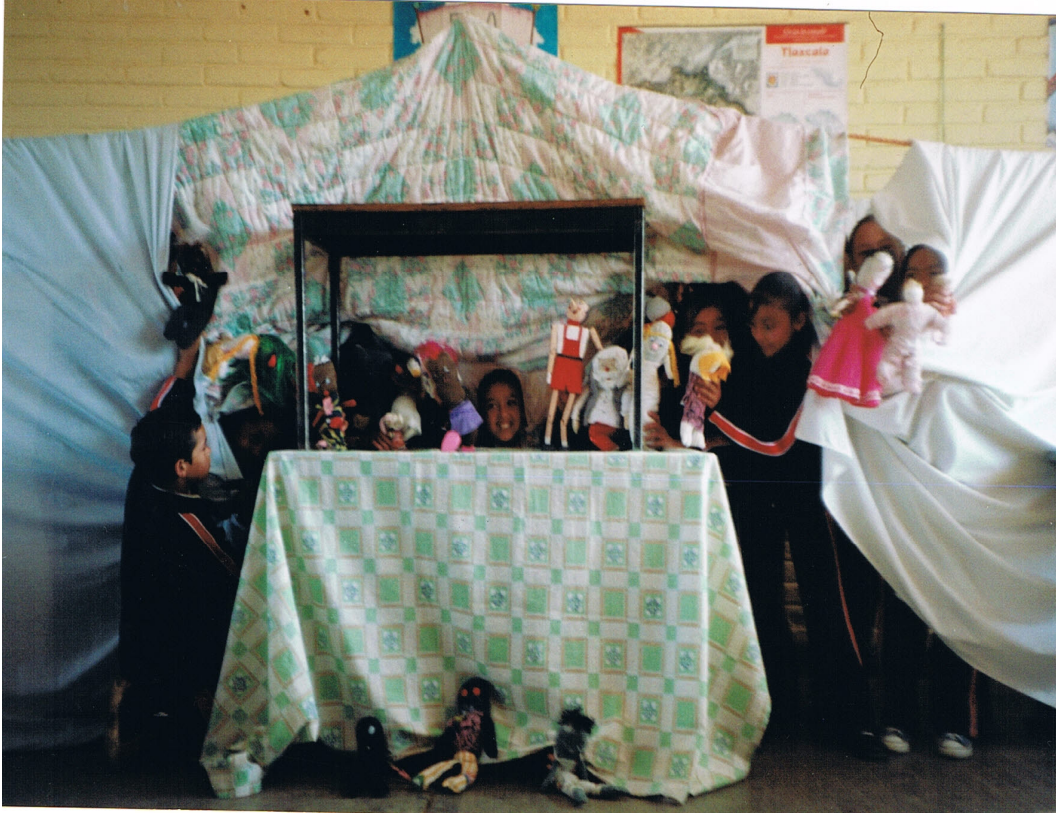
Escenificación de cuentos por medio de títeres.