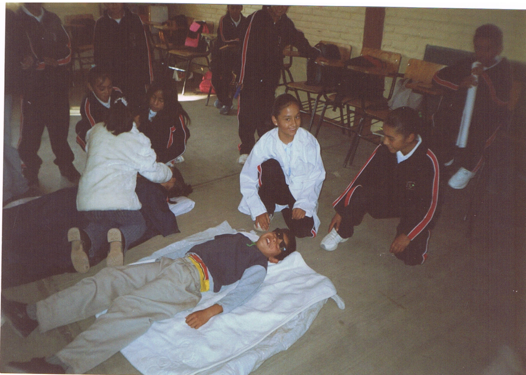
Representación de obra de teatro.