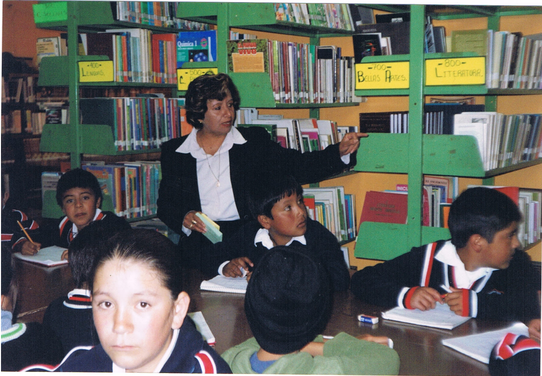
Bibliotecaria explicando el funcionamiento de la biblioteca pública.