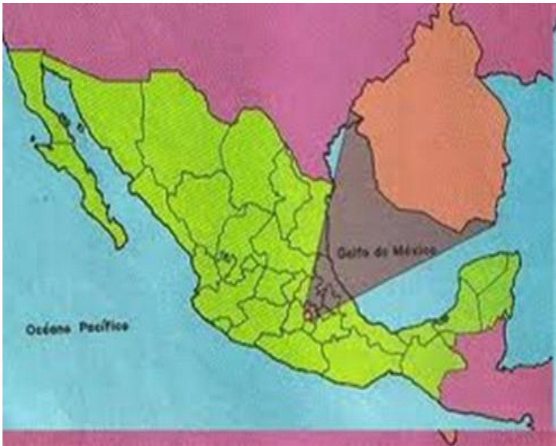
Figura 1. Mapa de la República Mexicana. 1