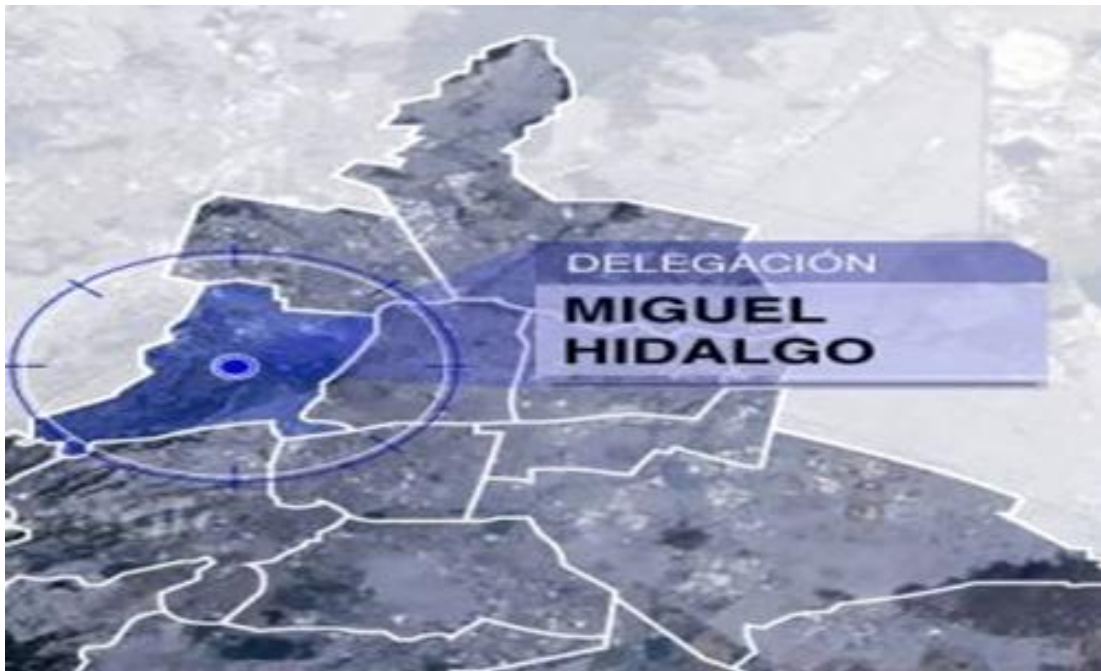
Mapa de la Delegación Miguel Hidalgo. 2