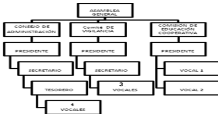
Esquema 2. Órganos de Gobierno y Control

Elaborado por las autoras con datos del Reglamento de Cooperativas Escolares