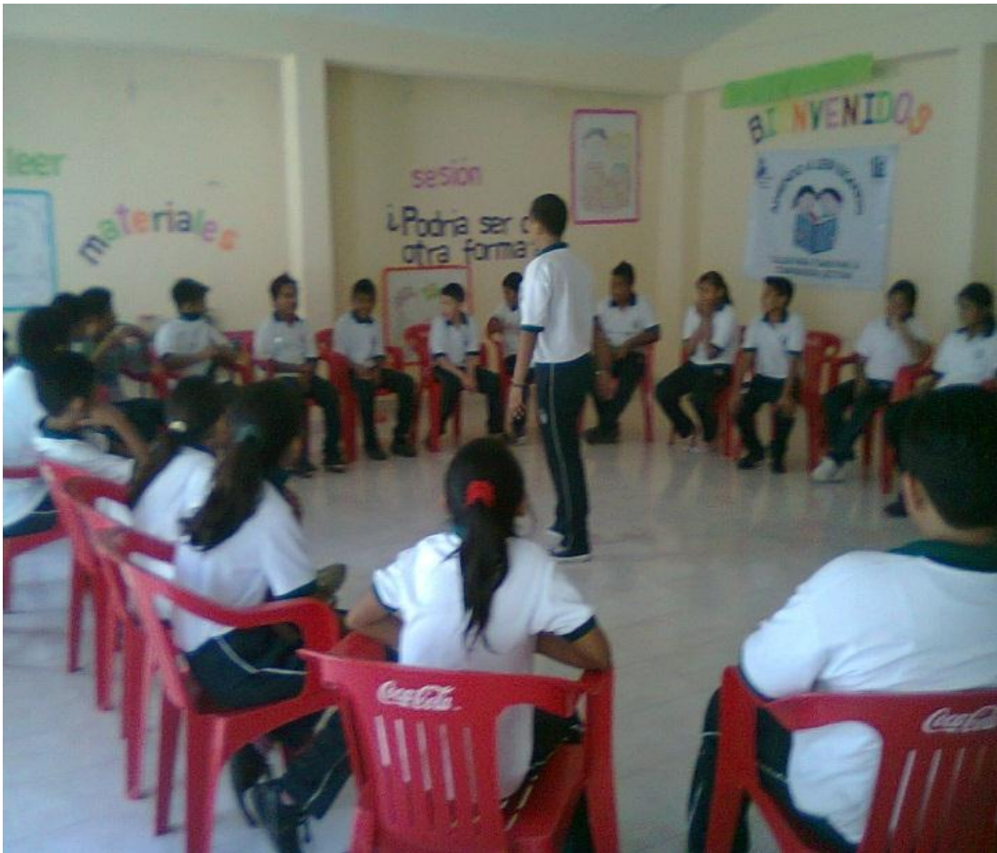
Dinámica de inicio de sesión.