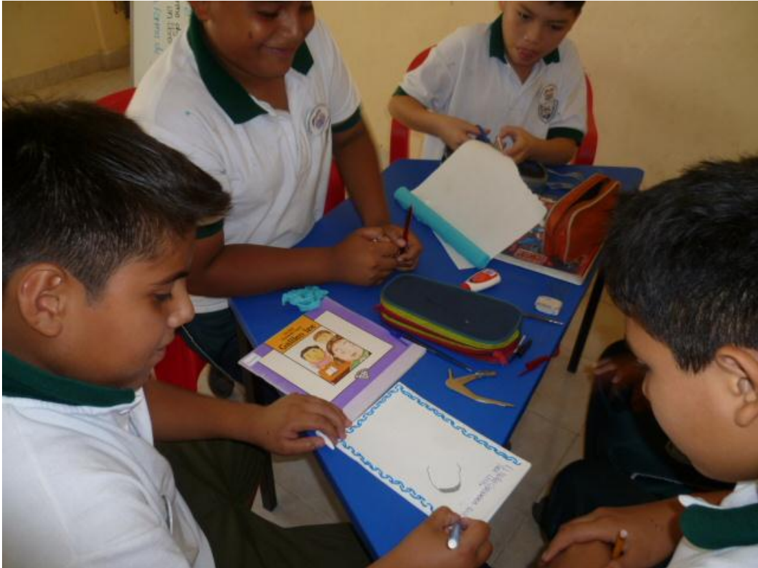
Elaborando sus productos.