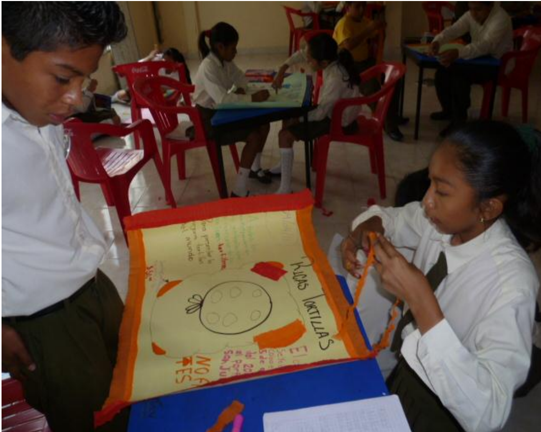
Niños elaborando sus carteles.