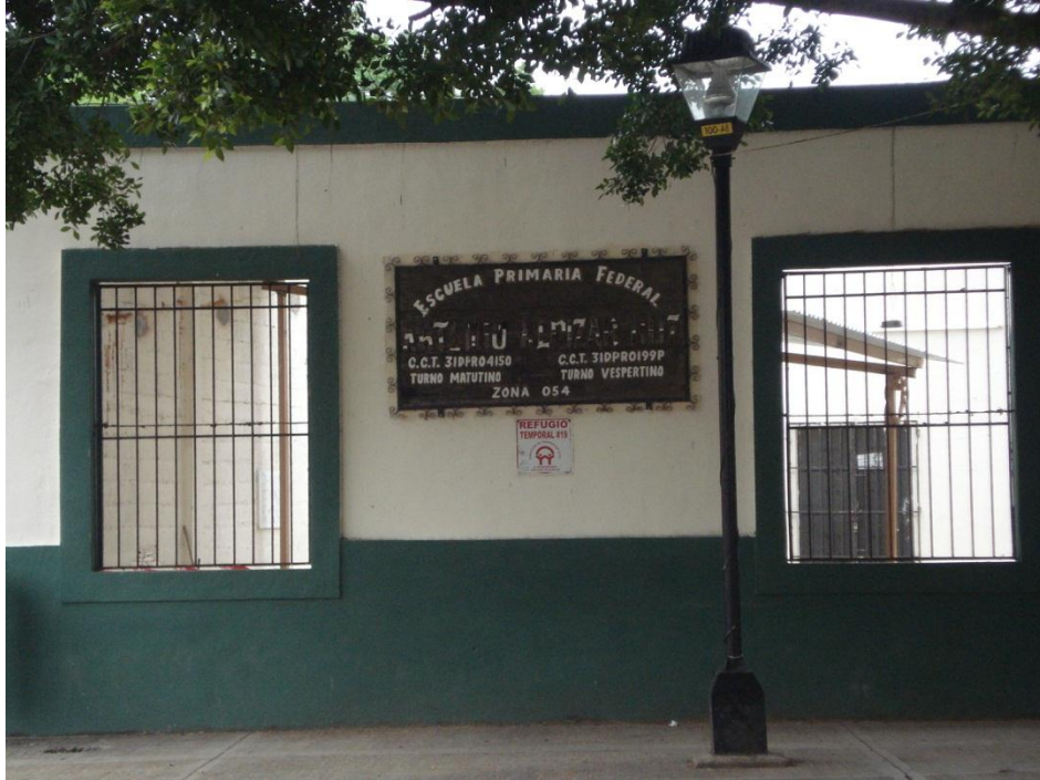
Fachada de la escuela.