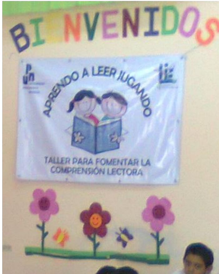
Lona del taller.