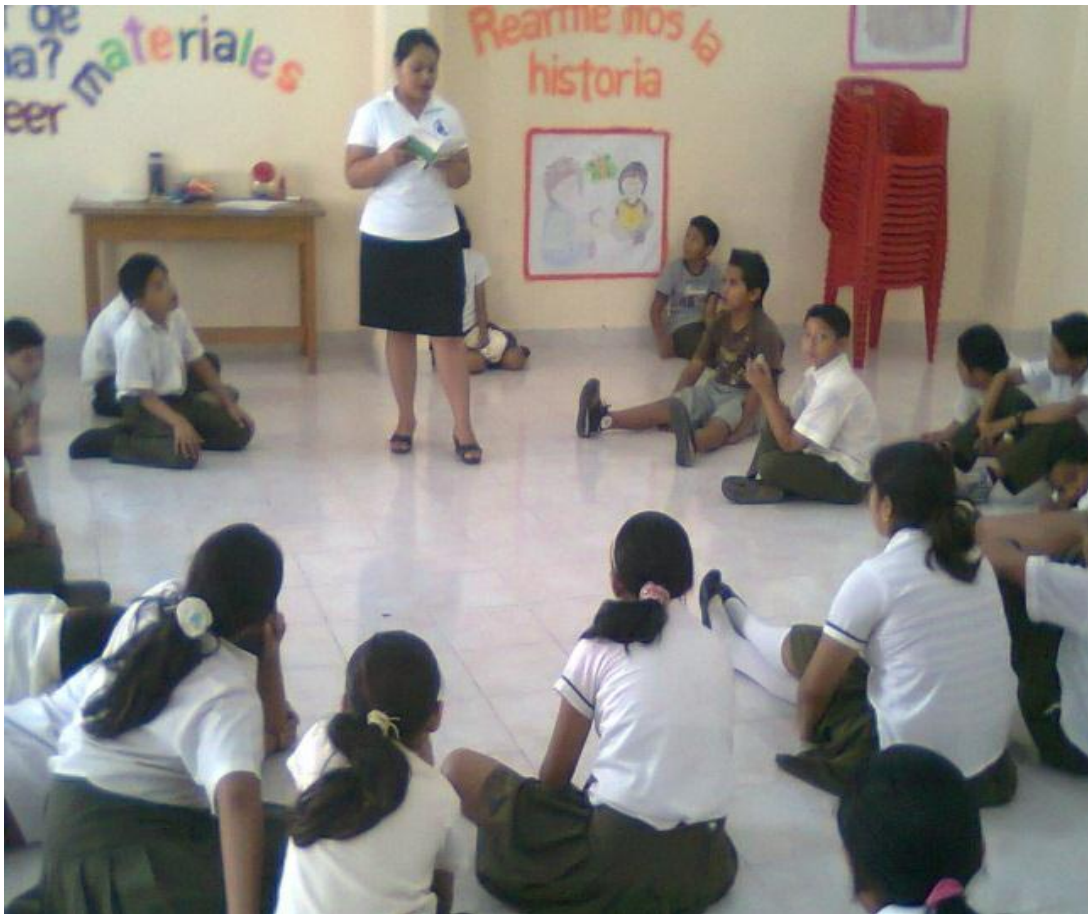
Lectura en voz alta.