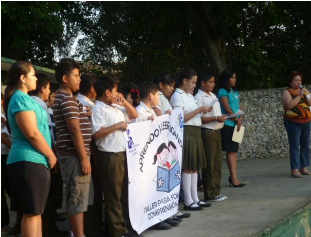
Ceremonia de la clausura, donde participan alumnos, interventoras y autoridades de la escuela.