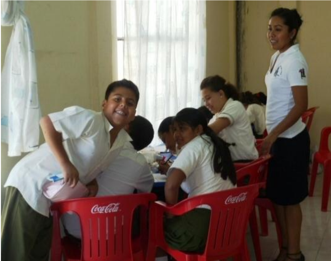
Lectura del reporte del taller.