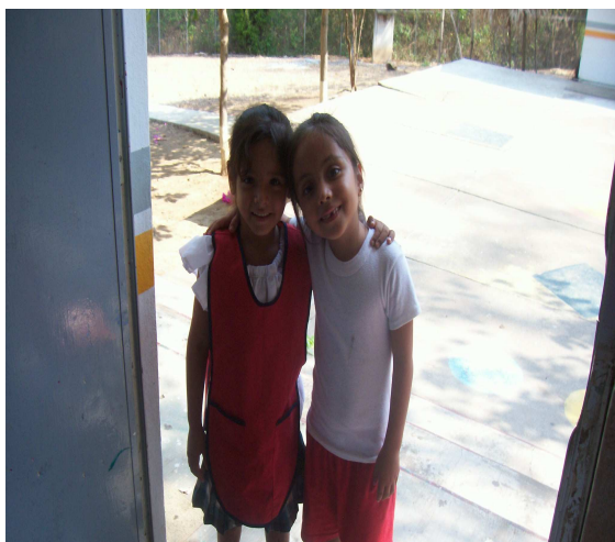
Anexo 12 entregando la tarjeta acerca de la amistad.