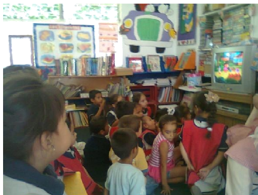
FOTO 4. Tiempo después de la comida para descansar viendo una película