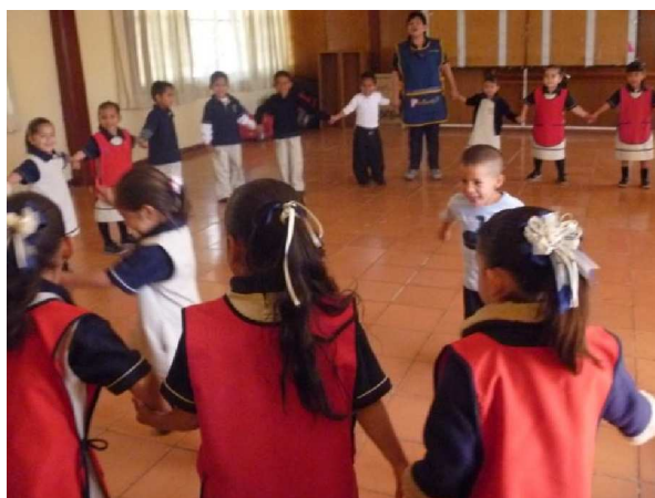
FOTO 5. Niños jugando a pasear por el campo