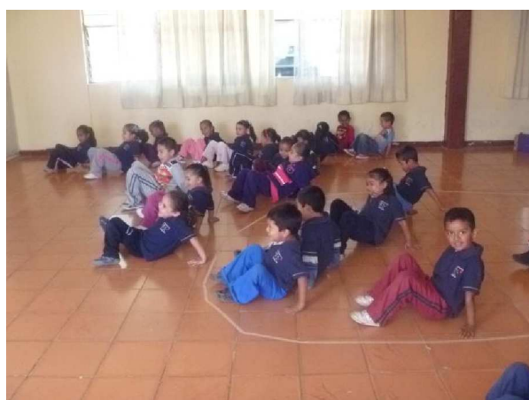
FOTO 6. Niños caminando como cangrejos