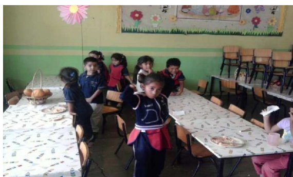
FOTO 3. Alumnos castigados por mala conducta en el comedor