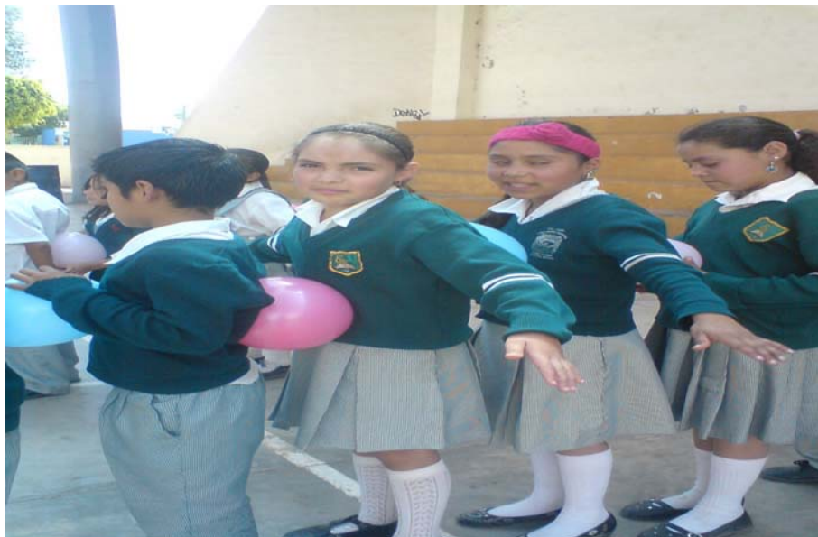
A aplicación de técnicas

Las técnicas no parecen en un orden de aplicación pues en su mayoría fueron repetidas cada una con su objetivo específico, materiales que se utilizaron y el desarrollo el tiempo pues lo adecue alas necesidades del grupo.