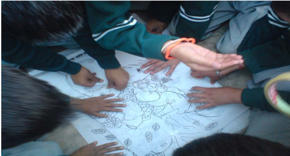
Trabajo en equipo

Fue una de las actividades de la evaluación final del cual se rescato la aceptación de reglas, participación, compañerismo, disponibilidad, igualdad, y sobretodo el respeto mutuo.