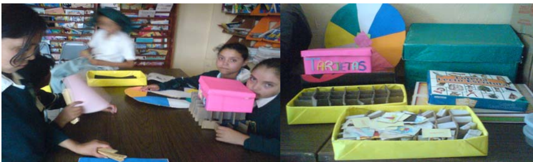
MATERIALES: Ruleta, caja de tarjetas, alfabeto móvil caja amarilla, lotería.