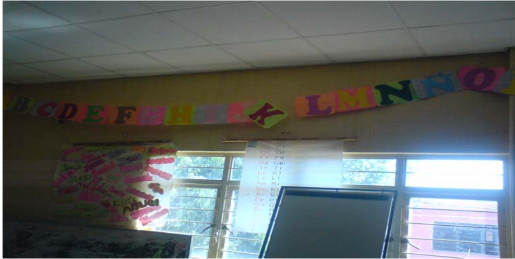
Parte del abecedario y tablero de nombres

libreta de notas, asimismo se llevo un expediente individual el cual llamamos libro de trabajo en el incluimos evidencias de los logros en la escritura, el registro de lectura.