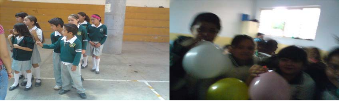
Trabajo con técnicas de motivación