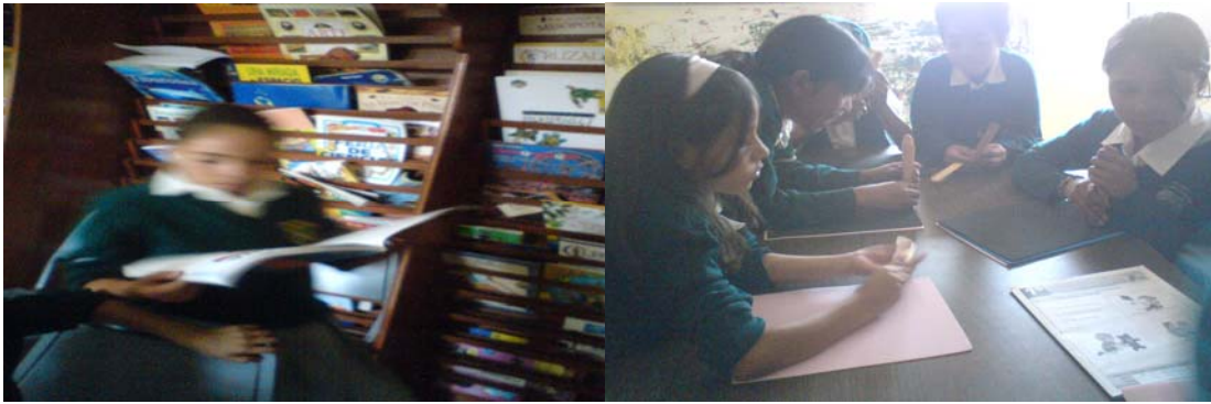
Sesión de lectura