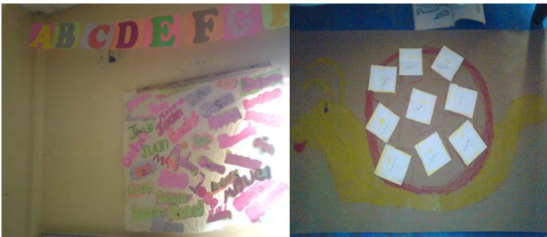
Tablero de nombres