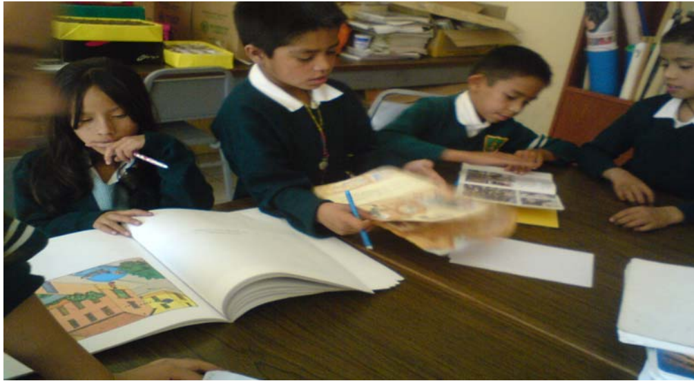
Actividad de lectura con los niños

La evaluación escrita se fue llevando en las diferentes sesiones en todas se rescataba algún escrito, narraciones, exposiciones, escritura en el pizarrón, identificación de letras en pizarrón, libreta, en el ambiente alfabetizador del aula, en los libros, copiando palabras, dictados en el pizarrón y libreta.