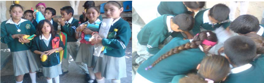
Pase de lista