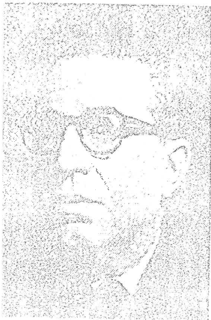
JAIME TORRES BODET (1902-1974)