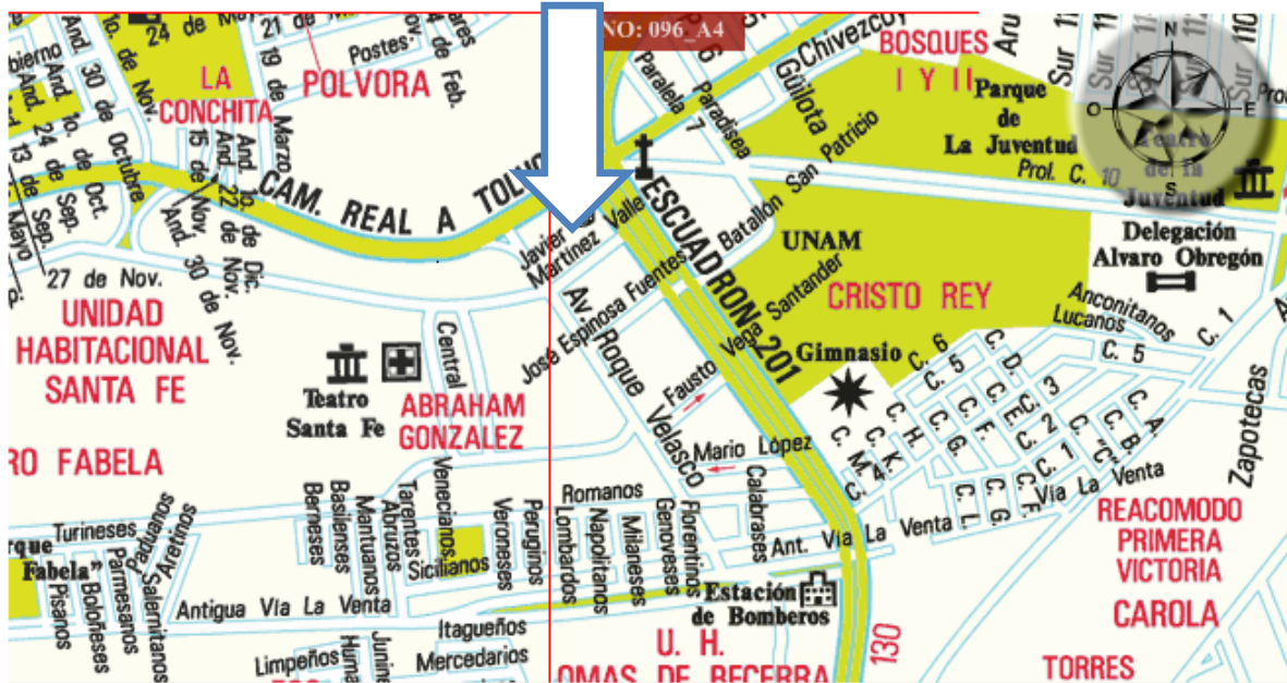
CENDI Cristo Rey