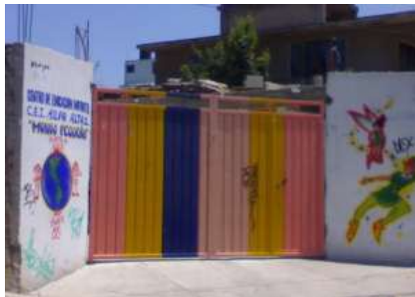
Figura 4. Fotos del Centro de Educación Inicial No 1, Milpa Alta.