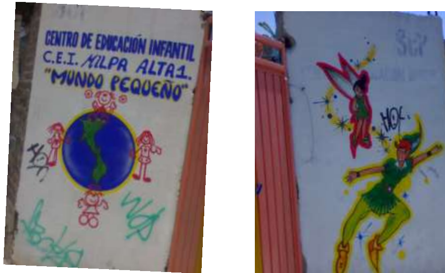
Figura 3. Fotos del Centro de Educación Inicial No 1, Milpa Alta.