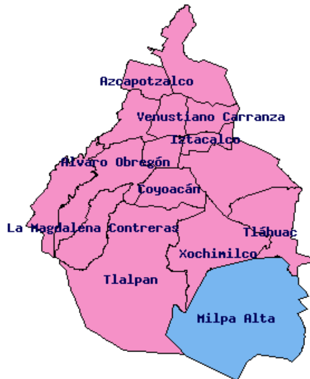
Figura 1. Situación geográfica de la Delegación Milpa Alta, donde se encuentra el poblado de San Pablo Oztotepec del Centro Educativo Inicial Milpa Alta N°. 1

En el pueblo de San Pablo Oztotepec, donde se vive con las tradiciones de usos y costumbres, los padres no tienen interés en la educación de los hijos, debido a que hay muchas madres trabajadoras que laboran en lugares lejanos como son la Delegación Xochimilco, Iztapalapa, Tlalpan y algunos municipios conurbados del Estado de México, tienen que salir a ayudar al esposo para la manutención de los hijos, son los abuelos quienes se encargan de los niños o en el mejor de los casos los hermanos mayores; ésta es una de las razones por las que hay mucha agresión hacia los niños menores. Ellos son muy vulnerables en ese tipo de