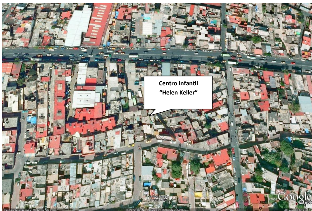
Figura No. 3. Ubicación del Centro Infantil “Helen Keller” 14

El Centro Infantil “Helen Keller”, se encuentra ubicado en Cerrada de Rosales No 3, Col. El Pirul Santa Fe, en la Delegación Álvaro Obregón, México, Distrito Federal.