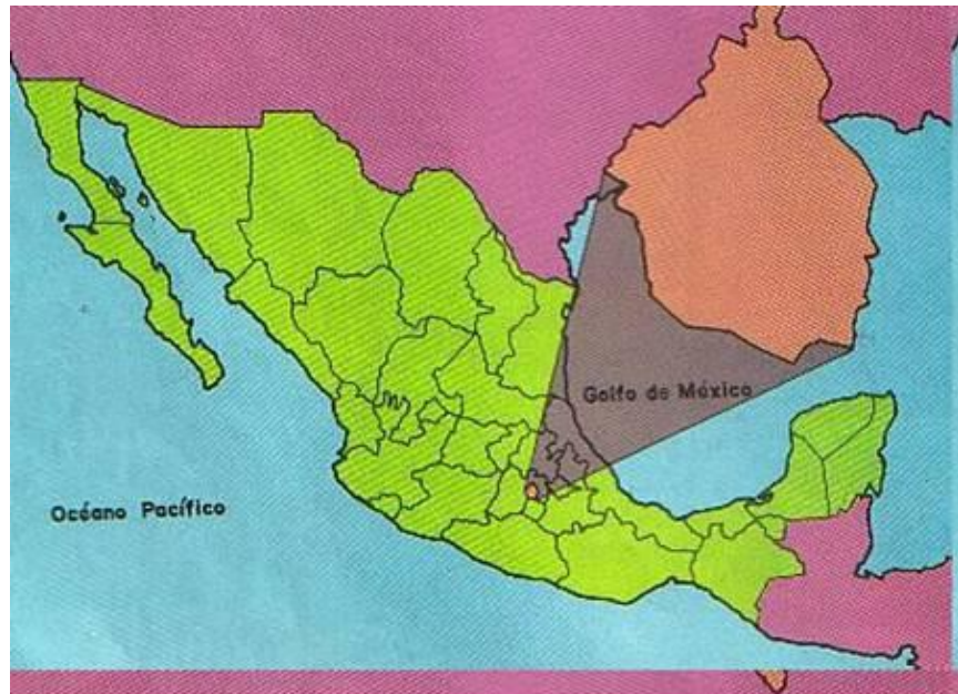
Figura No. 2. Mapa del Distrito Federal y la Delegación Álvaro Obregón 4