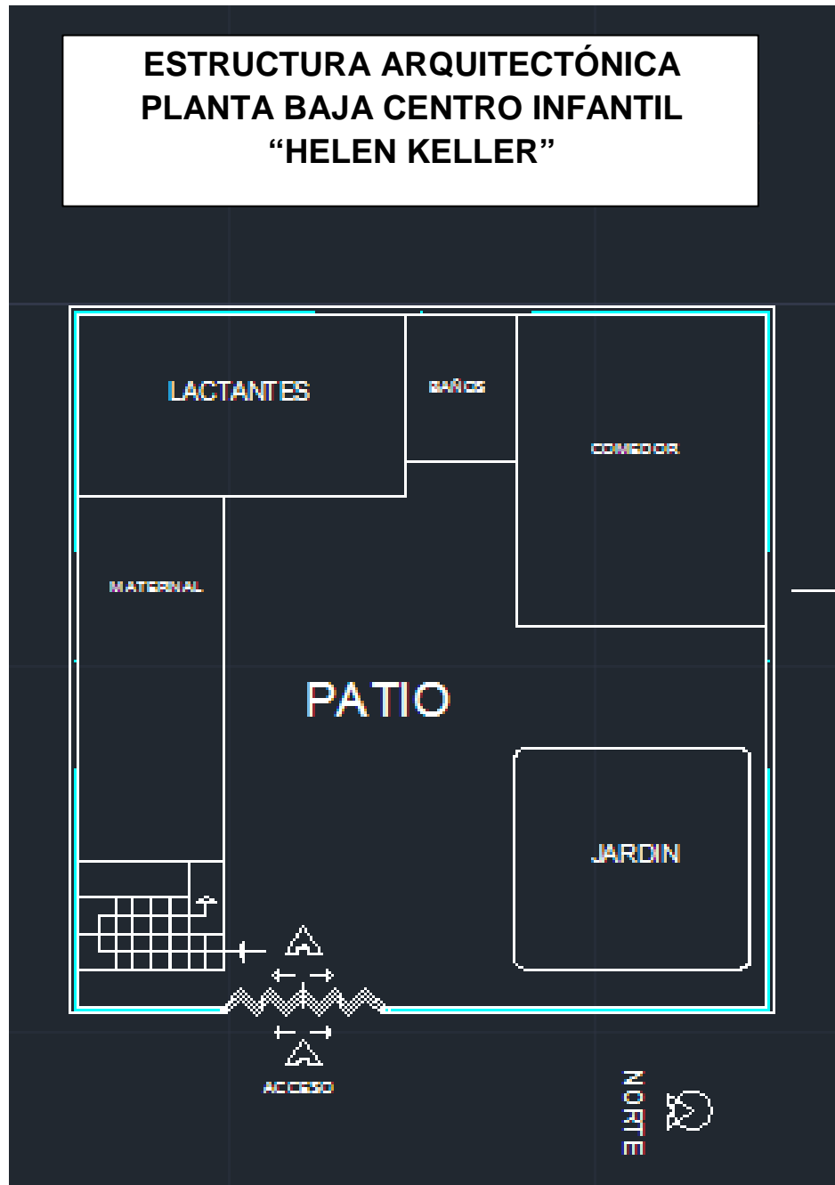
Figura No. 6. Plano del Centro Infantil Helen Keller 15