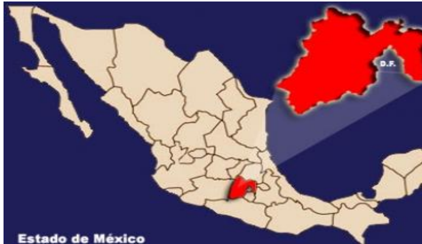
Figura no. 1 Mapa de la República Mexicana ubicando el Estado de México 1