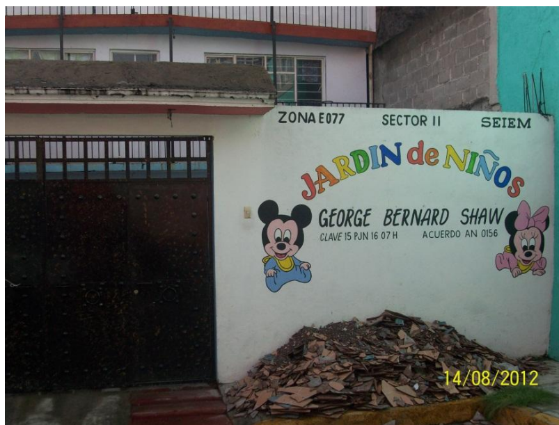
Escuela vista desde afuera 19

La institución objeto de estudio es una casa habilitada de dos pisos; la planta baja cuenta con un patio de usos múltiples, área de televisión y lectura, una pequeña hortaliza, cuatro bebederos, la cocina, la dirección y el salón de preescolar 2, baños