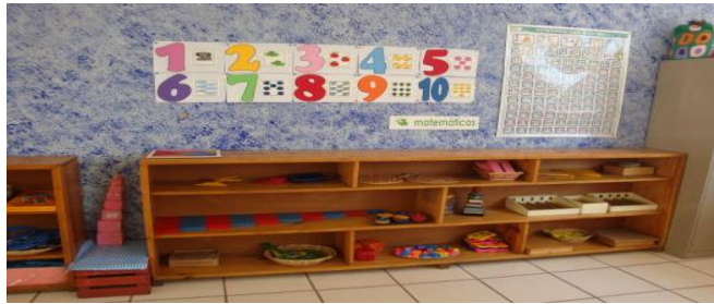
Área de matemáticas del Centro Comunitario “Casa Libertad”. 31