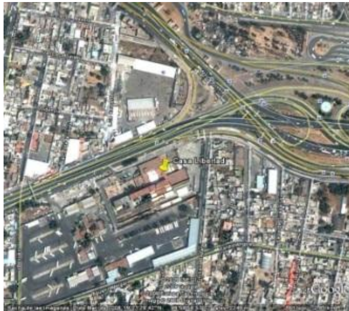
Toma aérea de del Centro Comunitario “Casa Libertad” 16

La estancia Infantil “Casa Libertad” se encuentra ubicada en la zona oriente de la delegación Iztapalapa en México, D. F., en Av. Ermita Iztapalapa 4163 Lomas de Zaragoza C.P. 09620, es una zona de alta densidad demográfica y que en su mayoría tiene una población de clase media y baja. Atiende a niños y niñas de entre 1 y 6 años (lactarios, maternas y Preescolares).