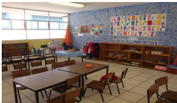
Área de lenguaje en el salón de Preescolar III del Centro Comunitario “Casa Libertad”. 30

lectura y la escritura son medios que ellos aprenden a utilizar para realizar estas actividades; este espacio puede promover también la toma de acuerdos, manifestar sueños, y de ser necesario, quejas o sugerencias las cuales podrán mostrar cómo podemos enriquecer nuestro trabajo.