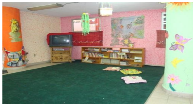
Biblioteca Escolar del Centro Comunitario “Casa Libertad” 29