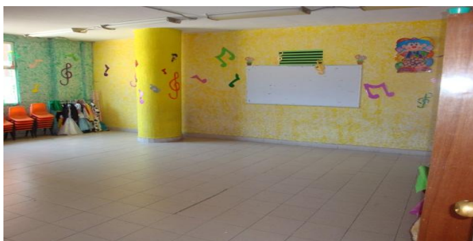
Área de expresión artística del Centro Comunitario “Casa Libertad”. 33

h) El juego simbólico para los niños es muy importante, ya que les permite interpretar diferentes roles sin ser criticados. En este espacio es muy fácil identificar si los niños están pasando por algún problema en su entorno familiar, cómo es el trato de los adultos hacia los niños. Aquí también los niños son libres de identificarse con el rol que más les agrade con prendas, disfraces, ropa y zapatos de papá y mamá, etc.