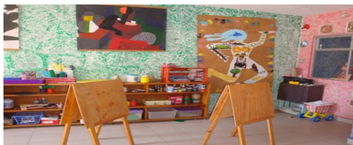
Salón de arte del Centro Comunitario “Casa Libertad”. 32