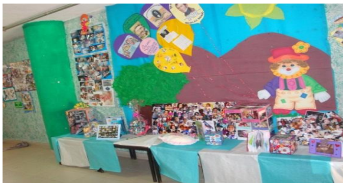
Periódico mural, referente al contexto familiar en el Centro Comunitario “Casa Libertad.” 27