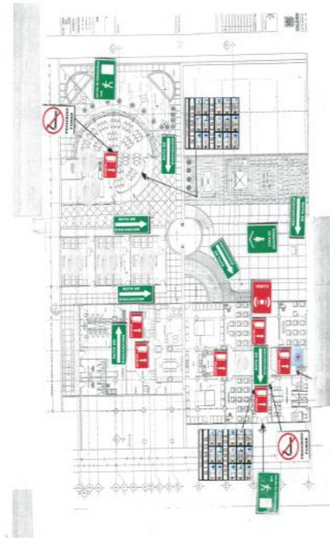
Plano Arquitectónico del Centro comunitario “Casa Libertad”. 17