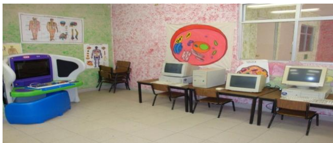
Área de cómputo del Centro Comunitario “Casa Libertad”. 34