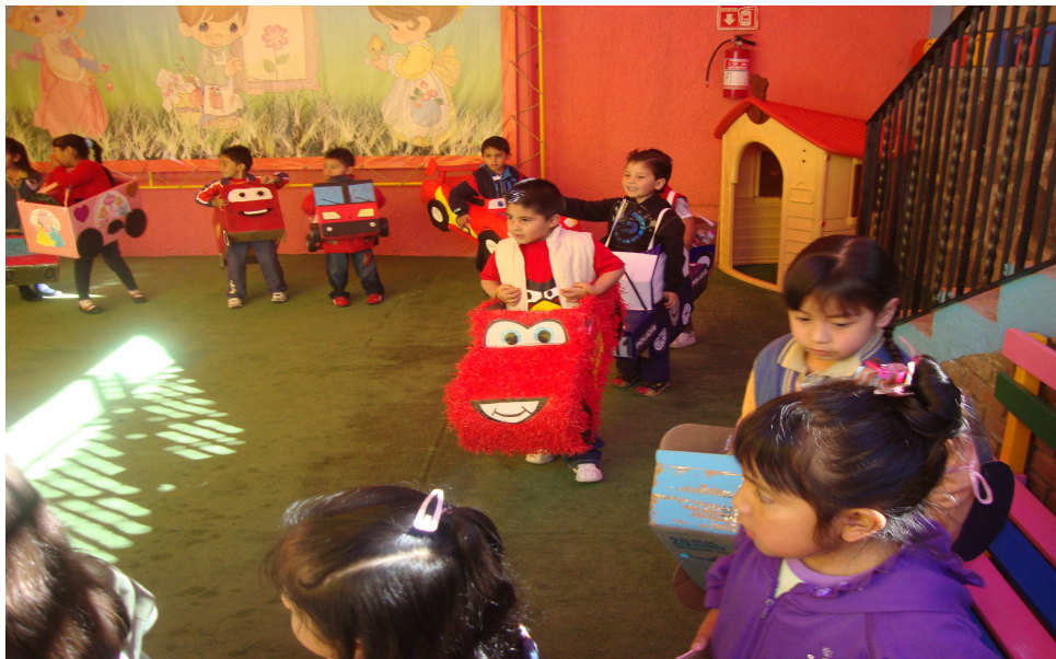
Actividad "Pilotos" (pág. 51)

La expresión corporal ayuda a la educación psicomotriz, misma que se adquiere poco a poco con todas las potencialidades expresivas del cuerpo que va aprendiendo a dominar.