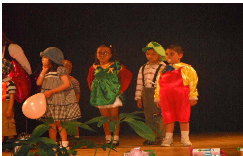
Actividad “Ídolos de televisión” (pág. 68)

La imaginación del niño – actor se ve favorecida, ya que se introduce sin esfuerzo en el papel de su personaje, pasa con facilidad de lo real a lo imaginario y logra ser tan hábil que sabe realizar o buscar los accesorios que le son útiles para su representación.