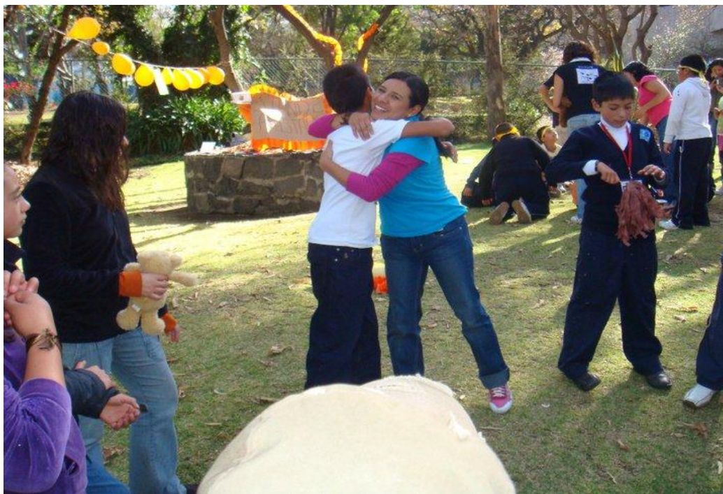
Mi amigo y yo, actividad “dar y recibir abrazos”, UPN-PERAJ, abril de 2011

Tres meses después, finalizaron estos talleres para dar paso al de Inglés, Multimedia o Patrimonio Cultural y Opera, además de las dinámicas que eran programadas por los tutores en los mismos días y horario.