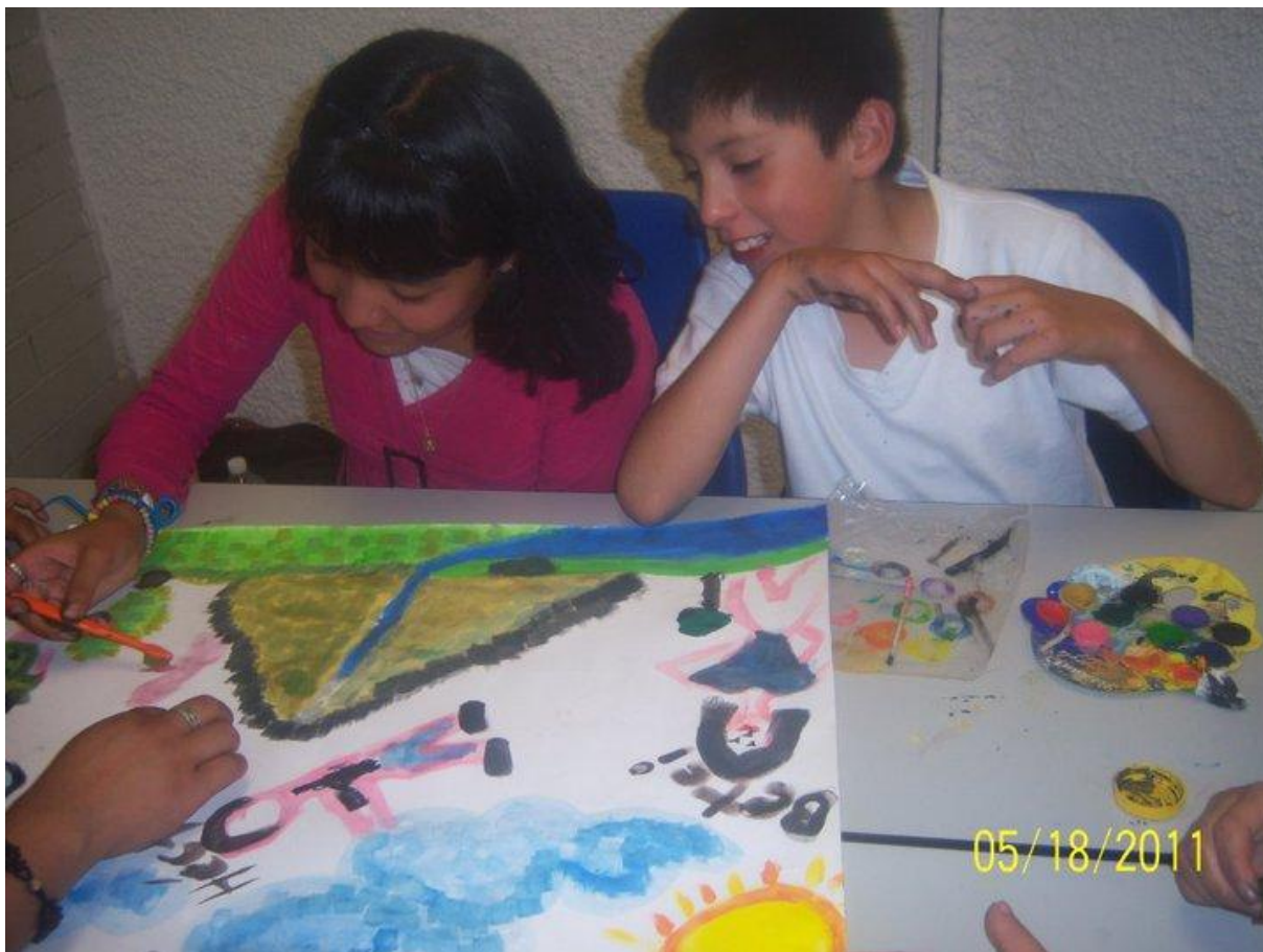
Mi amigo en el taller de pintura, UPN-PERAJ, mayo del 2011

una carrera profesional y en lo más inmediato cumplir con las responsabilidades en el hogar y en la escuela, además de motivarlos para los retos presentados.