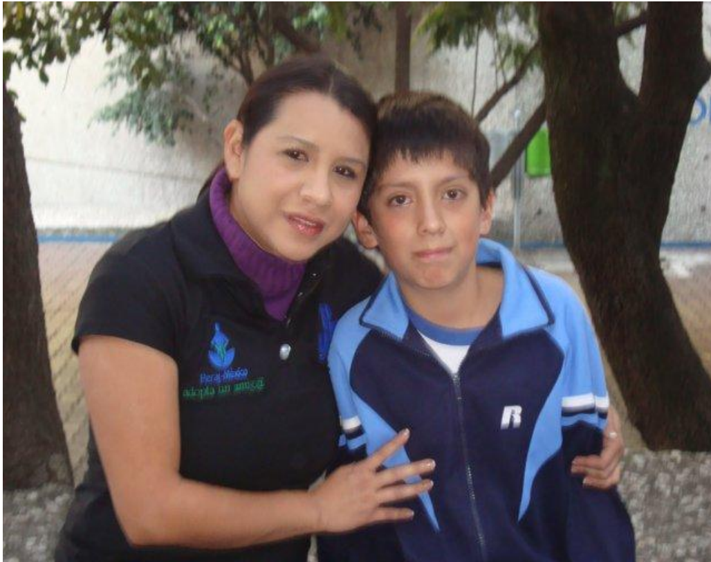
Foto de parejas. Octubre 2010.

La llegada de mi amigo fue dentro de los parámetros de un pequeño que va integrándose a un espacio y lugar nuevo y poco conocido, lo percibí callado, tímido e introvertido con dificultad para socializar e interactuar con los otros, pedir las cosas por favor, dar gracias, mostrándose ansioso al cuestionarle sobre sus actividades cotidianas, en la escuela y en su hogar, asimismo al tener que convivir o únicamente saludar a los demás tutores y amigos(as).