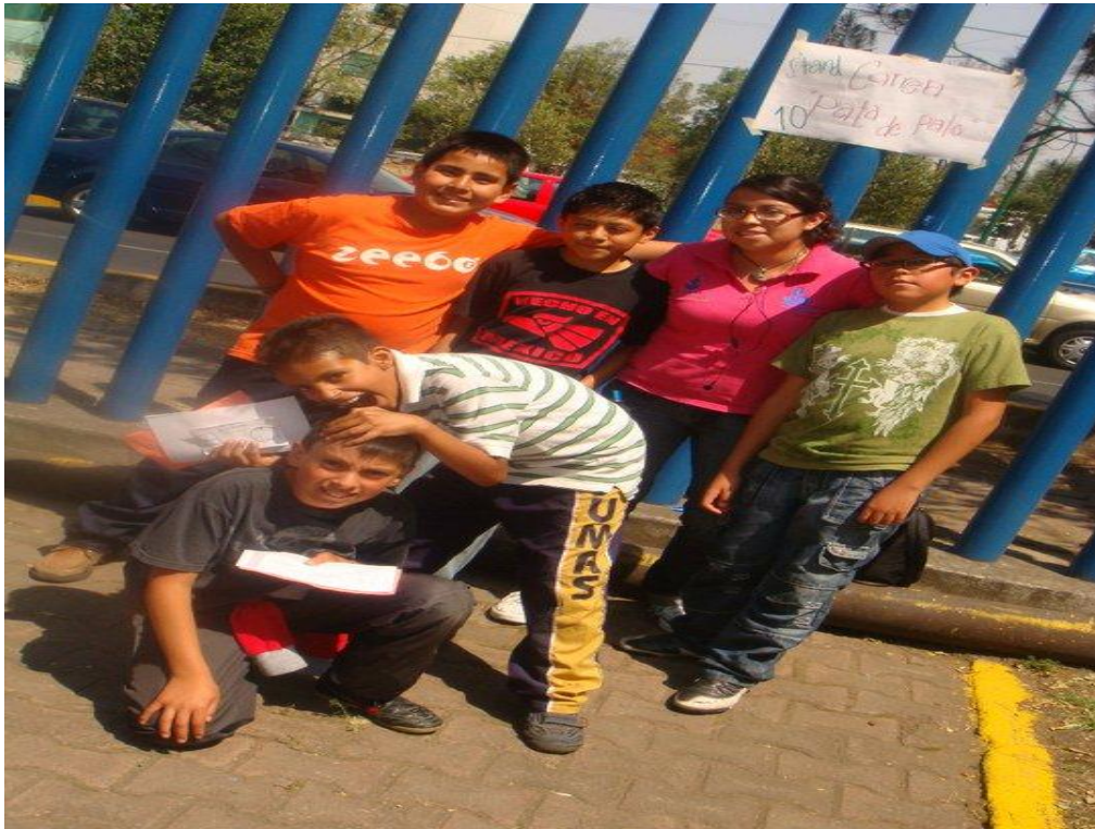
Mi amigo participando en actividades recreativas, UPN-PERAJ, mayo de 2011

Las horas libres fueron planeadas por los tutores tales como juegos de mímica, lotería esto con el objetivo de desarrollar la imaginación y la expresión corporal, dialogar sobre las profesiones de los tutores, todo ello para fomentar en el niño una visión a futuro además se desarrollaron ejercicios para ejercitar la memoria, manualidades (papiroflexia), y cuentos para fomentar el gusto por la lectura y, ejercicios de activación física.