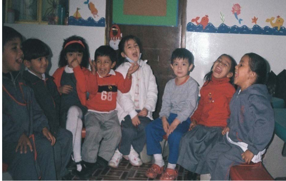
El grupo disfruta plenamente la narración de chistes.