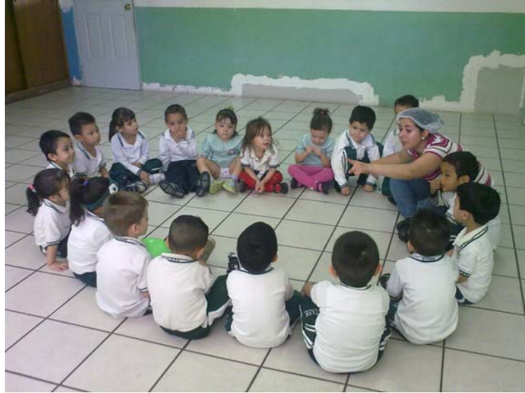
Niños participando en la actividad Nº1 La pelota preguntona