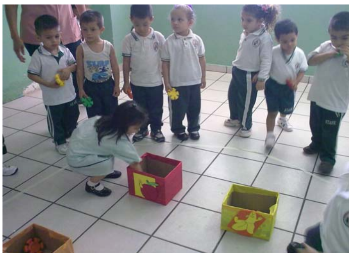
Niños jugando en la actividad N° 5 El círculo de colores