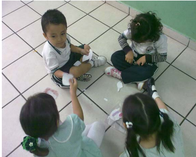
Niños jugando en la actividad N°4 Buscando ropita