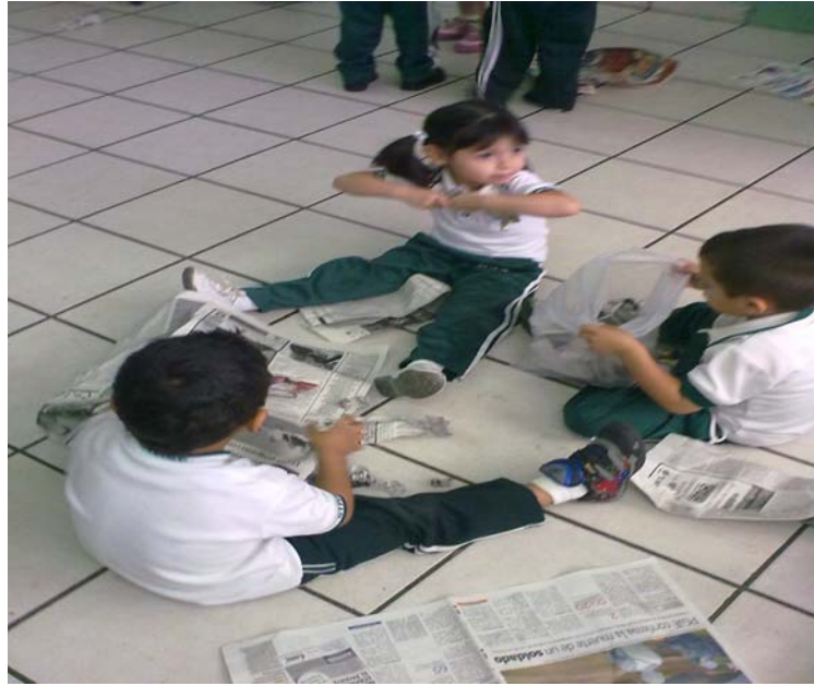
Niños participando en la actividad N° 3 bolitas de periódico