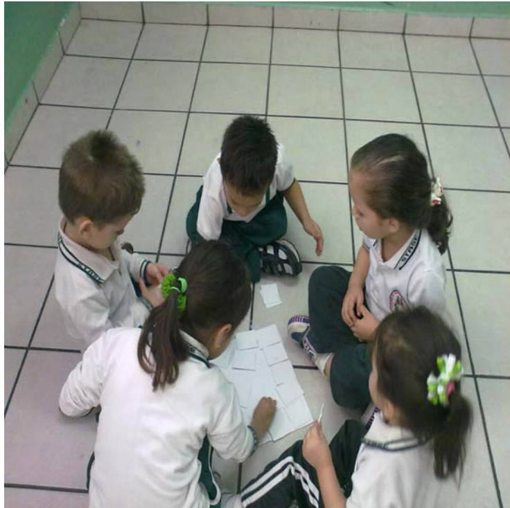
Niños participando en la actividad N° 2 El adoquinado