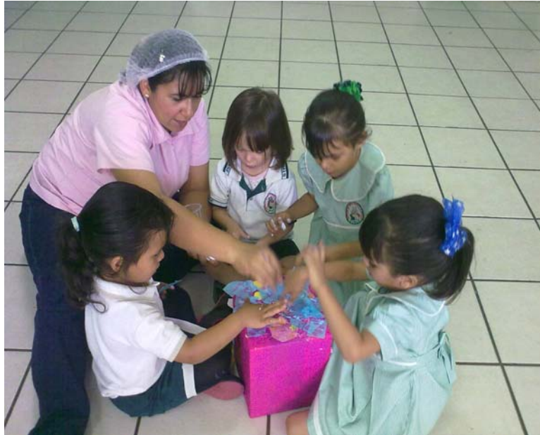
Niños jugando en la actividad N°7 haciendo cubos