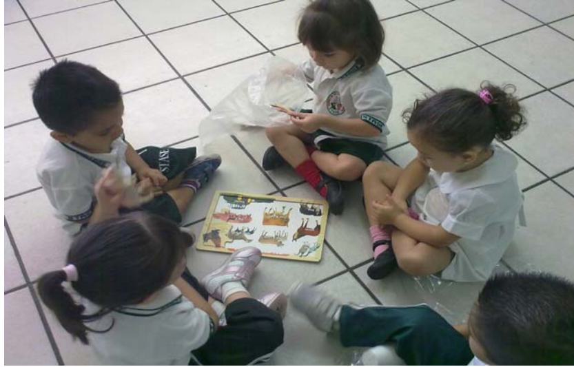
Niños jugando en la actividad N° 6 Las bolsas mágicas