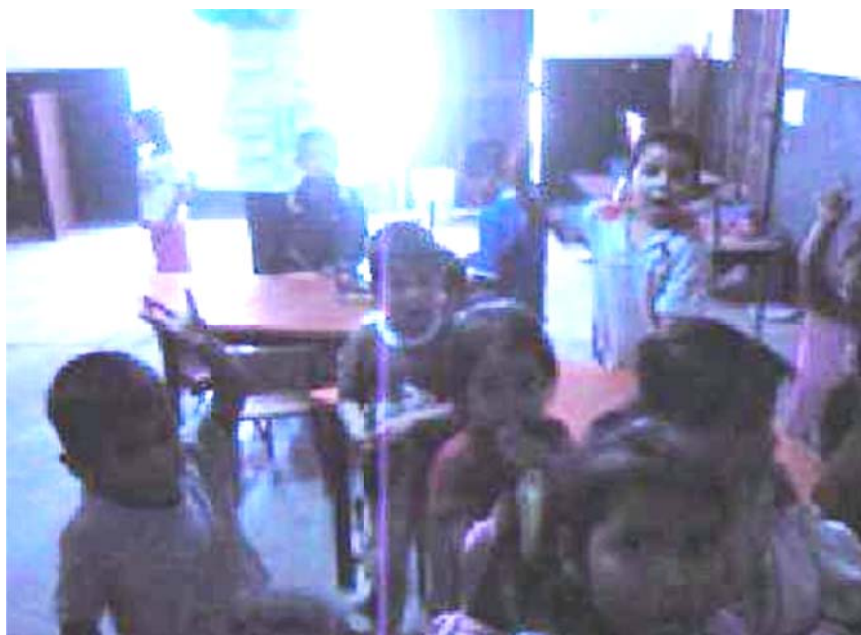
Los niños levantando su mano para poder participar.