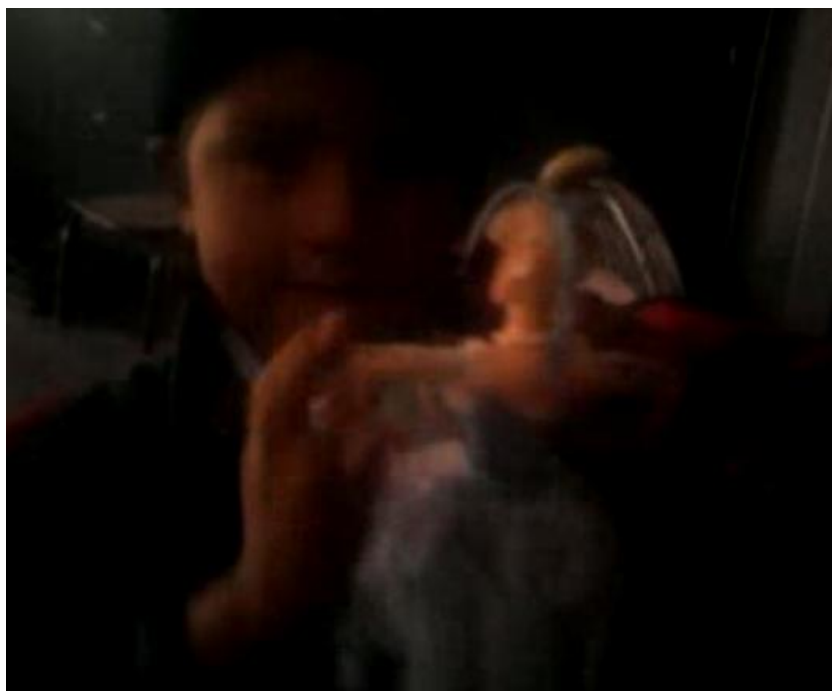
Niño jugando con muñeca.