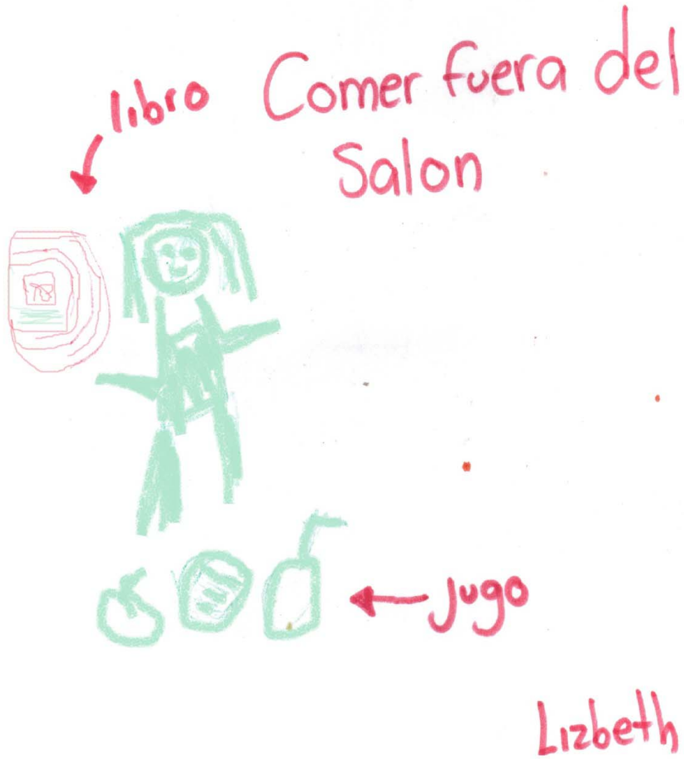
Dibujo donde se expresa la regla que considera más importante