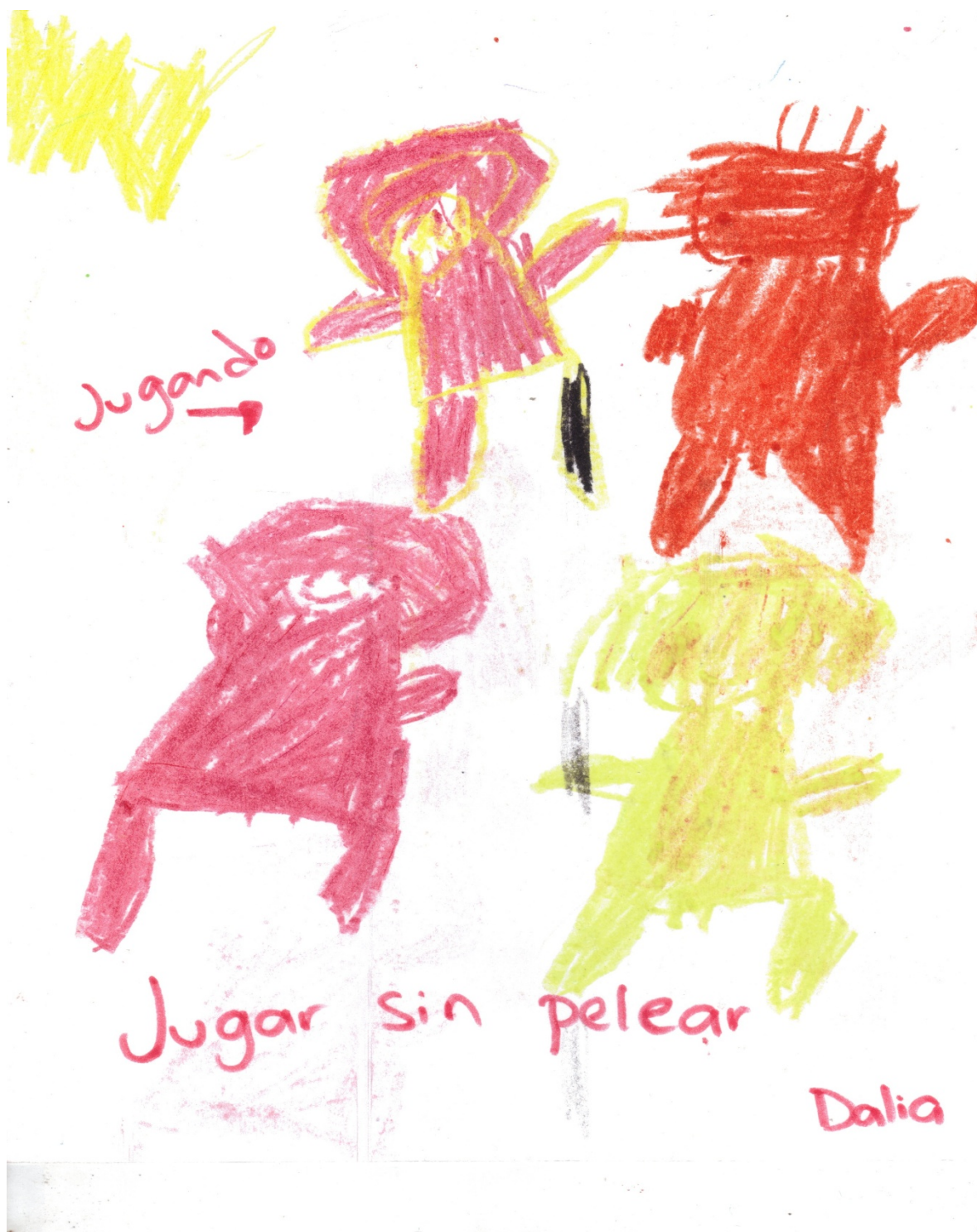
Dibujo donde se expresa la regla que considera más importante