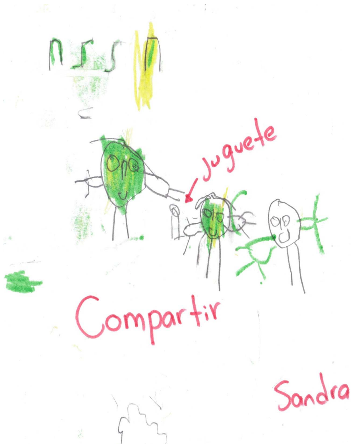
Dibujo donde se expresa la regla que considera más importante