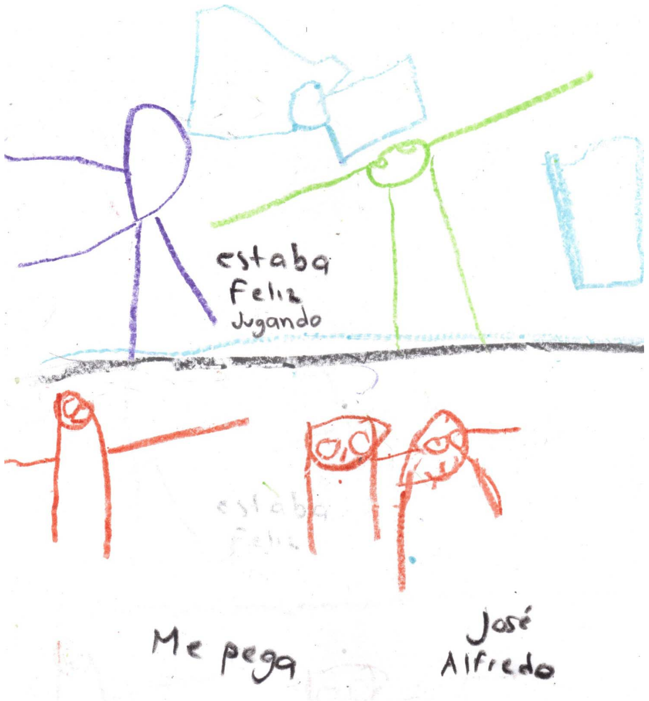
Dibujo sobre algo agradable y desagradable