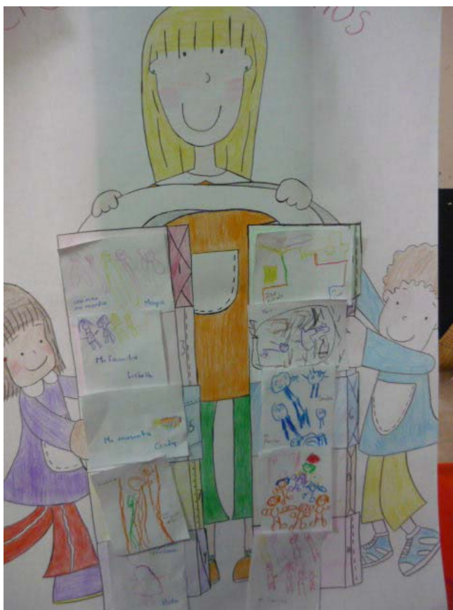
Foto de la cartulina en donde se pegaron algunos de los dibujos de los niños.

En la situación didáctica #3 los derechos de las niñas y los niños.