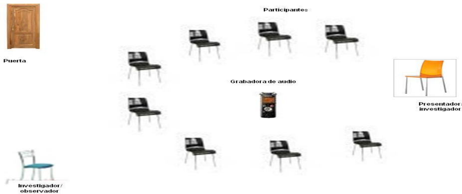
Figura 3. Diagrama del grupo de discusión con base en: Galindo (1998)Ibáñez (1992).