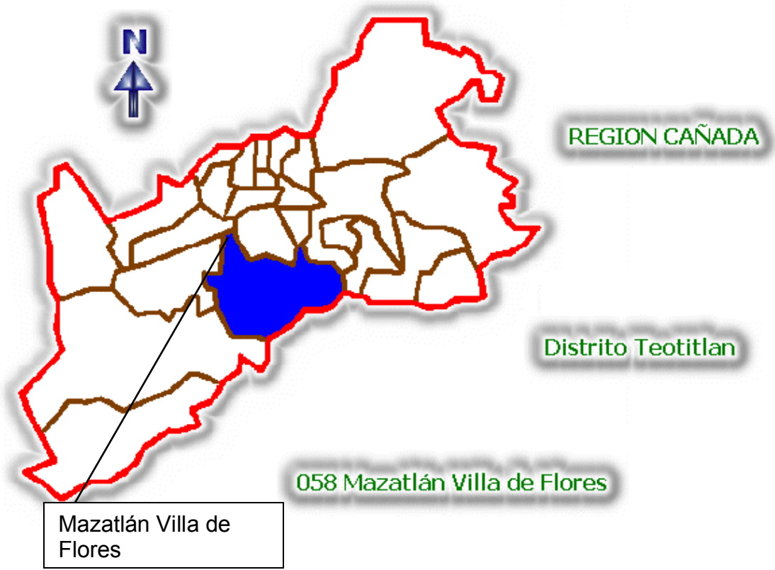
Figura No. 3 en esta figura se muestra la Cañada, con un color rojo alrededor, y dentro del color azul se encuentra Mazatlán Villa de Flores, perteneciente al distrito de Teotitlán.

Fuente: Instituto Nacional para el Federalismo y el Desarrollo Municipal (2009). Enciclopedia de los municipios de México. Estado de Oaxaca. Mazatlán Villa de Flores . INFDM, Gobierno del Estado de Oaxaca, México. Pp. 1-7. [En línea],. http://www.inafed.gob.mx/work/templates/enciclo/oaxaca/municipios/20058a.htm , [Consultado 3 de junio del 2010].