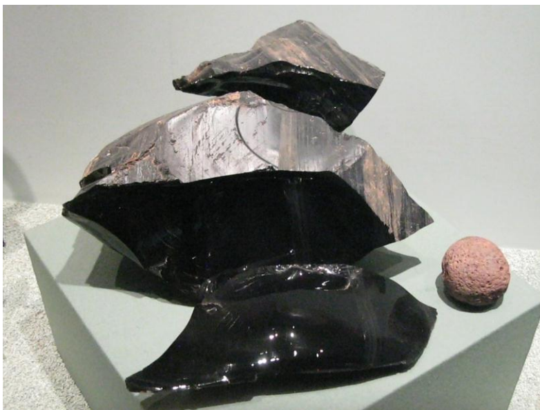
Fig.28. Piedra de obsidiana negra y tezontle rojo. Museo de Sitio, Teotihuacan. Agosto de 2010

“La obsidiana se origina por el enfriamiento y endurecimiento de lava rica en silicio. En algunos sectores de las Tierras Altas volcánicas los filones de obsidiana que afloran están expuestos a la erosión, por ello existen vastos emplazamientos en los que se pueden recoger bloques y trozos de obsidiana incluso del suelo.