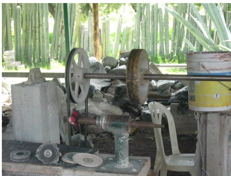
Fig.32. Taller de artesanías de obsidiana. Agosto de 2010

Las líneas más grandes se pulen con discos pequeños, de menos de una pulgada, después se pasa a un pulidor montado en un mandril con un disco de cartón y lija de papel de un aproximado de 1500 a 1800 revoluciones por minuto. Las líneas más pequeñas se trabajan con un aparato (motortul) de un aproximado de 4000 a 6000 revoluciones por minuto, usando discos de goma dura flexible, usando una lija de lona, quedando la pieza con un color negro opaco. Para darle el terminado final se pasa a un filtro de lana comprimida, en las líneas más finas se trabaja con agua y polvo de la piedra, para después pasarla a las mantas utilizando polvo y agua obteniendo el brillo original de la piedra. 52