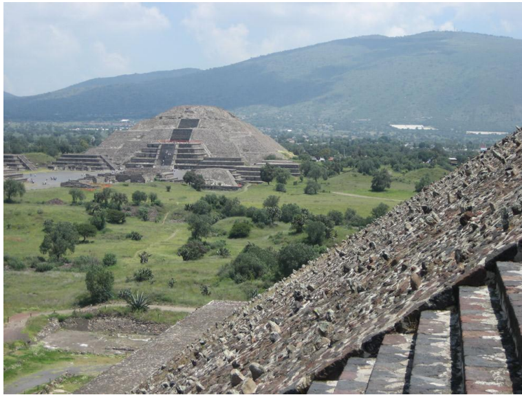
Fig.7. Pirámide de la luna, al fondo parte d el cerro Gordo Autora, 24 de Mayo 2010.

estribaciones de la Sierra Nevada y con el cerro Chiconautla". 15 El cerro Gordo es el más grande y se puede observar justo detrás de la pirámide de la Luna.