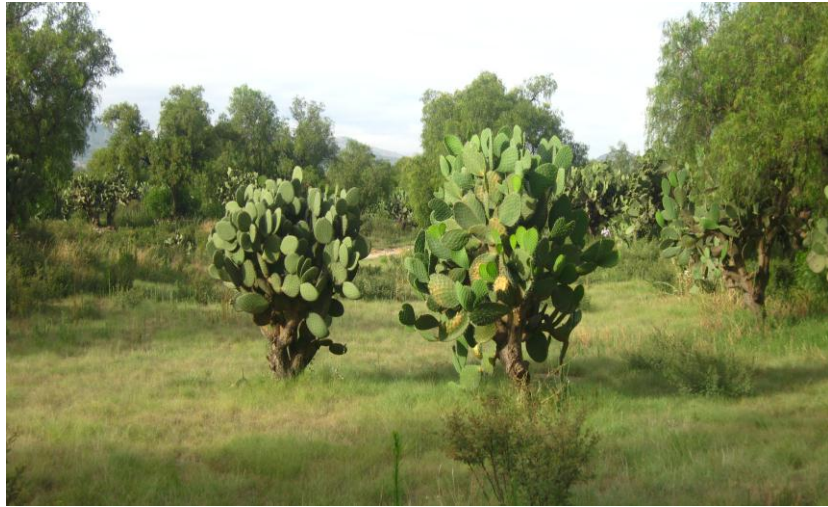
Fig.5. Árboles de pirul al fondo y nopales de tuna roja. Terreno perteneciente al poblado de Santa María Coatlán Autora. 5 de Junio de 2010

Es fácil encontrar árboles de pirul en toda esta zona, nopales de tuna blanca, tuna roja, nopales de cerro, algunos cactus como el abrojo o las biznagas, flores silvestres como las maravillas, las quiebra platos, los mirasoles de diferentes colores, las maravillas, el pega ropa, el duraznillo, los mantos de distintos colores, el árbol de colorines o chocolines, entre muchos árboles frutales que se adaptan a este tipo de clima, tales como el chabacano, la granada roja, durazno, ciruelas, aguacates, zapote blanco, capulines. Encontrando en sí una vegetación típica de climas semiáridos.