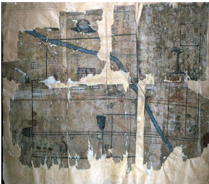
Fig.3. Mapa de San Francisco Mazapan (Teotihuacan) Tinta en amatl, ca. 1700-1767.

Este documento se trata solamente de una referencia que hacen los pobladores y propietarios, dueños de las tierras de la comunidad indígena de San Francisco Mazapán, para delimitar los linderos de sus propiedades y conformar títulos de propiedad. “[...] El plano está dibujado en el reverso de una hoja vieja de pergamino. Mide sesenta y dos centímetros de largo por treinta y ocho de ancho.” 9