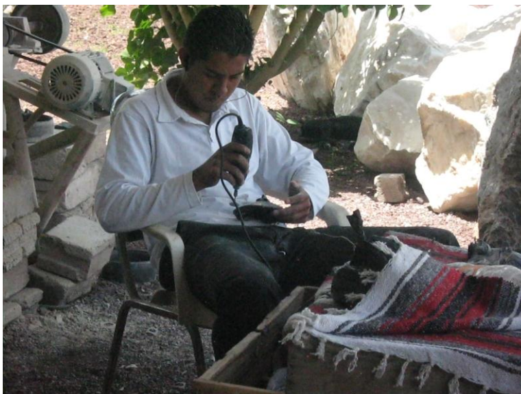
Fig.32. Artesano trabajando un replica de museo. Agosto de 2010

Las líneas más grandes se pulen con discos pequeños, de menos de una pulgada, después se pasa a un pulidor montado en un mandril con un disco de cartón y lija de papel de un aproximado de 1500 a 1800 revoluciones por minuto. Las líneas más pequeñas se trabajan con un aparato (motortul) de un aproximado de 4000 a 6000 revoluciones por minuto, usando discos de goma dura flexible, usando una lija de lona, quedando la pieza con un color negro opaco. Para darle el terminado final se pasa a un filtro de lana comprimida, en las líneas más finas se trabaja con agua y polvo de la piedra, para después pasarla a las mantas utilizando polvo y agua obteniendo el brillo original de la piedra. 52