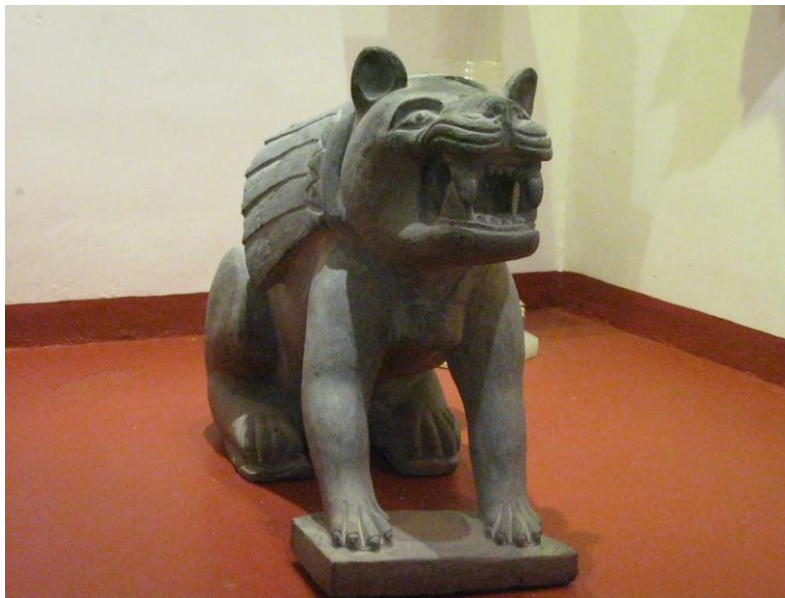
Fig.31. Jaguar en obsidiana sin pulir. Tienda de Artesanías Itz-Yollotzin. Agosto de 2010

corta marcando la piedra con un disco de diamante, para después usar una cuña y con el marro darle un fuerte golpe. Después, cuando el trabajo es de máquina, es decir, las figuras con cortes rectos, se despostilla la piedra, teniendo en mente el diseño, se pasa por un esmeril de piedra de carburo de grano grueso (4 a 9 pulgadas) en seco, en este momento la obsidiana cambia de color, es gris. Posteriormente se pasa a otro esmeril de grano más fino (4 a 9 pulgadas) utilizando agua, después se pasa por un expander que tiene una lija de lona, este trabajo se hace en seco dándole el primer pulido y quedando la piedra de color negro opaco.