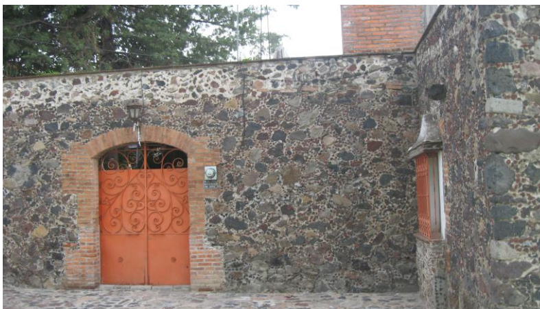
Fig.12. Fachada de la casa de la difunta Soledad Ramos "Cholita" Autora, Junio de 2010.