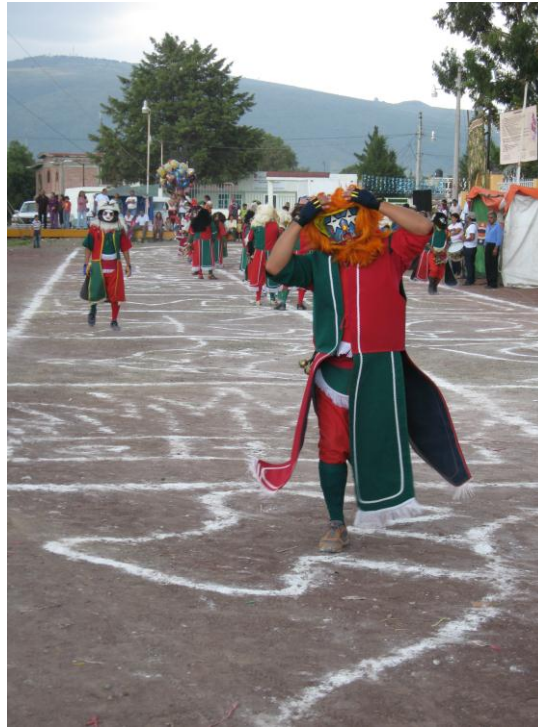
Fig.21. Danza de Alchileos.

A diferencia de los diálogos que se escuchan en español en la de moros y cristianos, los diálogos de los alchileos son en mexicano, una mezcla de náhuatl y castellano. Sus trajes son de colores rojo y verde, usan mascararas elaboradas con pieles de animales y una careta de barro o papel mache, su baile lo realizan en el piso. En el dibujan las figuras del sol y de la luna con sus respectivas pirámides, la música que los acompaña es la de la chirimía. Los integrantes de esta danza hacen muchas travesuras y por sus mascararas la gente no los identifica, pueden asustar o corretear a chicos y grandes, a pesar de esto, nadie se molesta pues es parte de este baile.