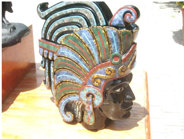
Fig.34. Escultura en obsidiana con incrustaciones de diversas piezas. Autora. Agosto de 2010.

La piedra se aprovecha al máximo, se elaboran la mayoría de las veces los diseños de las figuras con base en la forma de la piedra, de ello depende en gran medida la imaginación del artesano, “si se ve de un lado tiene figura de tortuga, pero si la volteas parece un pez” 56 . Cuando este sucede es más fácil el trabajo, pues sólo se concretan los artesanos a detallar esa figura, ya se cuenta con una parte del preformado. En cambio cuando es una figura con diseño especial e incluso con un peso específico, el artesano adapta cada piedra procurando aprovecharla al máximo, para lo cual utiliza máquinas que hacen cortes perfectos como una especie de rebanadora proporcionando el tamaño adecuado que se necesita.