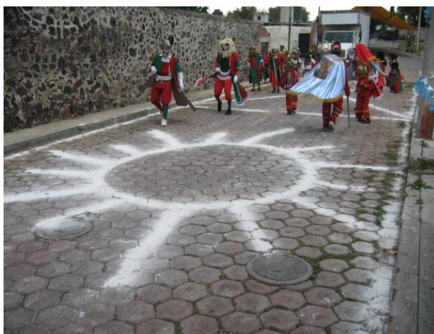
Fig.20. Danza de Alchileos. Autora. Fiesta patronal, 15 de Agosto de 2009.

La danza de los Alchileos es parecida a la de los Moros y Cristianos, de hecho su base principal al igual que la otra danza es la lucha entre los que profesan a Cristo y los que tienen otro u otros dioses, en esta danza se observa más claramente como se mezcló las costumbres prehispánicas con las ideas cristianas, pues la lucha gira en torno al sol y la luna.