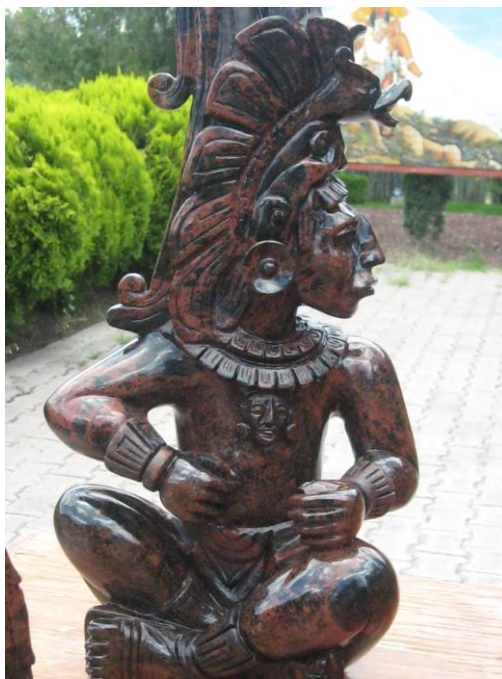
Fig.33. Escultura en obsidiana marrón. Autora. Agosto de 2010

elaborar figuras específicas como las esferas o huevos de obsidiana, figuras de animales, entre otras.