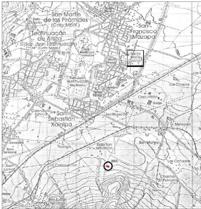
Figura 3. Sitio 520, localizada sobre el mapa 1:50,000 INEGI TEXCOCO E14B21.