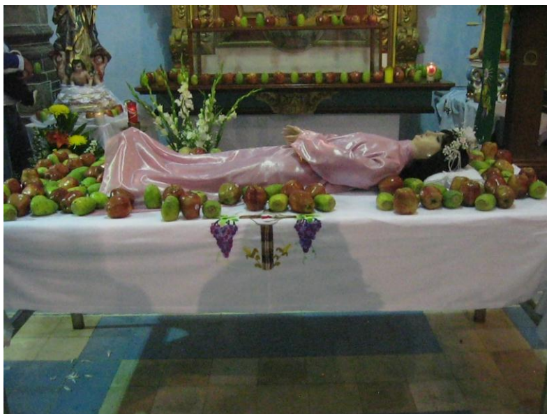
Fig. 16. Virgen del Tránsito. Autora. 13 de Agosto de 2010.