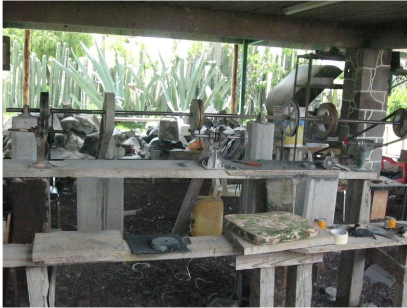
Fig.22. Taller para la elaboración de artesanías con obsidiana. Artesanías Itz-Yollotzin. Agosto de 2010

Además el trabajo del artesano no solo se refiere a la elaboración de artesanías, este va más allá. Se convierte en administrador, publicista, contador y un sin número de profesiones, las cuales contribuyen en gran medida a la producción y venta de sus productos.