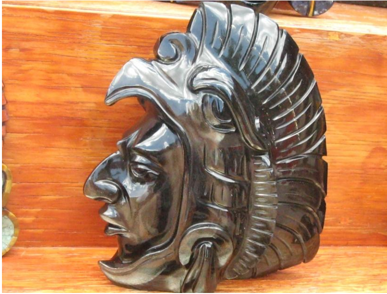
Fig.24. Caballero Águila. Trabajo en obsidiana dorada. Tienda de Artesanías Itz-Yollotzin. Agosto de 2010

Otra significado de la artesanía es el recuerdo de la visita del lugar en donde se produce, la historia que contiene de ese sitio, por haberse elaborado con las técnicas de los antiguos moradores.