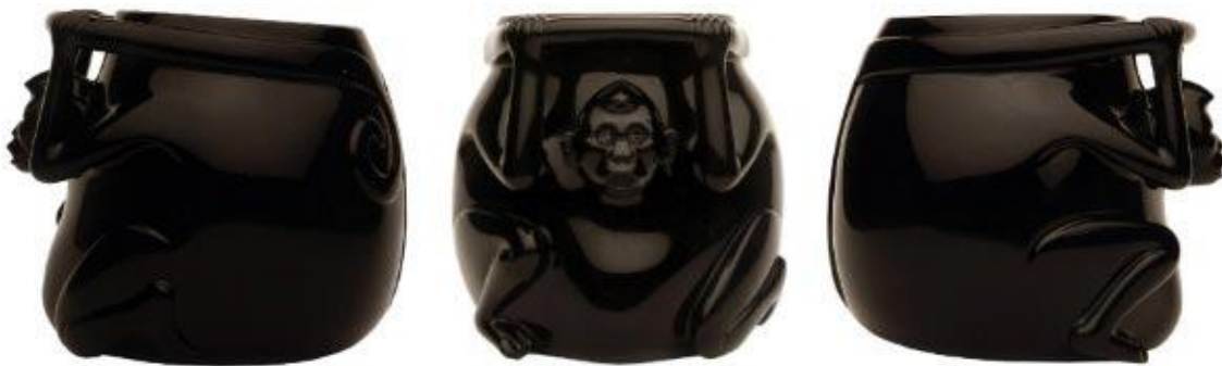
Fig.26. Vasija del Mono.

Vidas completas se necesitan para la elaboración de piezas como las mascararas funerarias, el tallado y preformación de las figuras debió de haber sido muy difícil, pues aún es la actualidad con las técnicas y herramientas modernas, son los trabajos más difíciles. Otro ejemplo de la complejidad de estos trabajos es la vasija del mono, que se puede observar en el Museo de Antropología de la Ciudad de México, en la sala Mexica, ¿cuántos años pasarían para terminar la cavidad que impresiona y el brillo que la define?