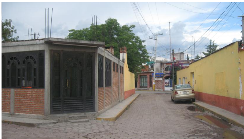
Fig.10. Avenida San Francisco Autora, Junio de 2010.

Es un pueblo con ambiente más urbano pues debido al contacto que se tiene con diversas regiones del país e incluso del extranjero los habitantes han cambiado sus formas de hablar, de vestir y hasta de pensar y actuar. Todos se conocen entre si, saben a que familia perteneces, y si no conocen a la persona que habita en el pueblo eso quiere decir que es nueva en el lugar, que renta una casa o es familiar de algún originario de Santa María.