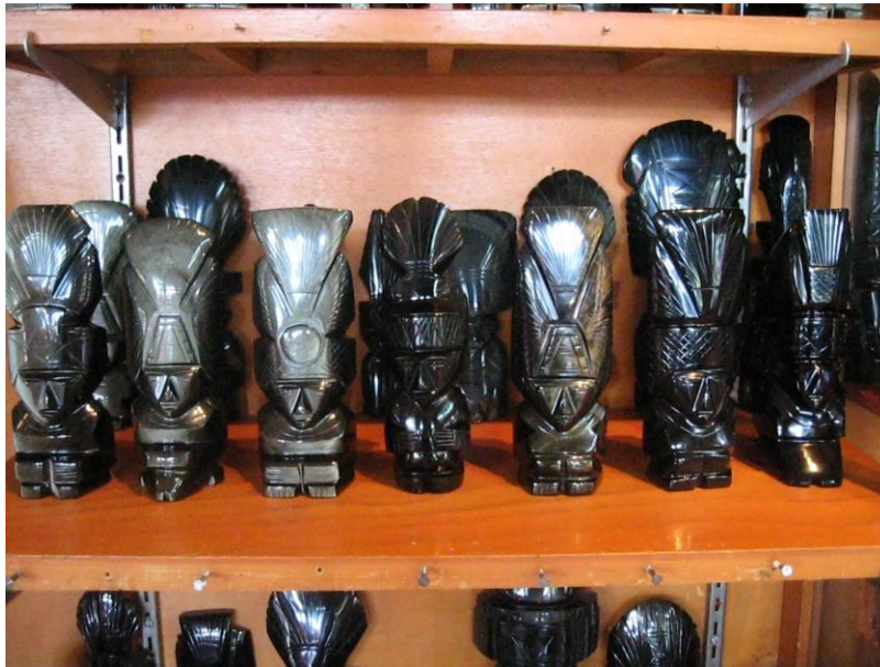
Fig.30. Muñecos, piezas de maquina elaboradas en obsidiana dorada. Tienda de Artesanías Itz-Yollotzin. Autora. Agosto de 2010

antiguos dioses teotihuacanos, están hechas básicamente por líneas rectas, aprovechando la forma de la piedra.