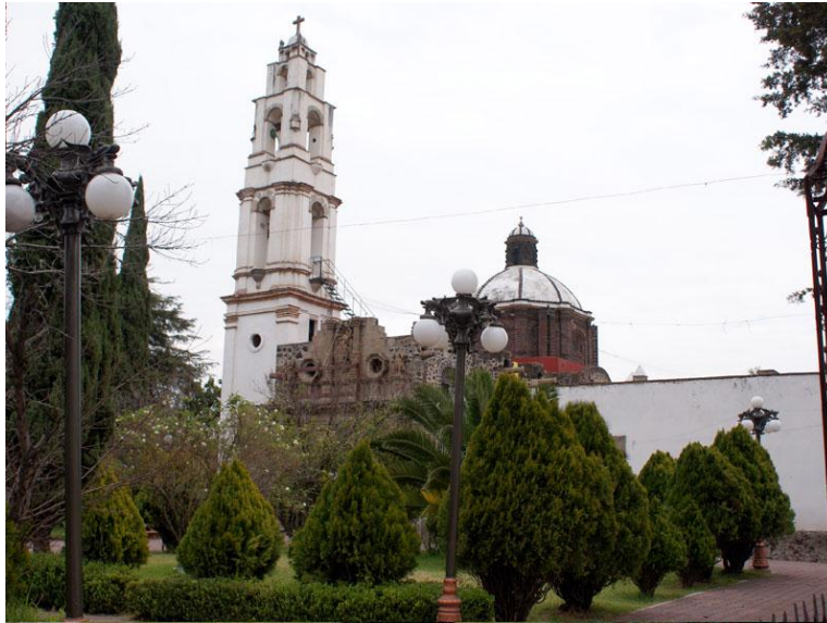
Fig.14. Iglesia de Santa María Coatlán Autora, Junio de 2010.

cristianos y muy pocos evangélicos. Hay un solo templo religioso y en este se profesa la religión católica.