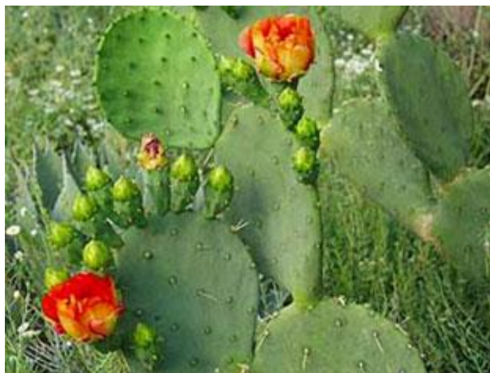
Fig.13. Nopal con tunas Autora, Mayo de 2010.

Otro recurso importante, aunque ya no aprovechado al máximo en esta época es el maguey, de donde se obtienen productos para la alimentación como el pulque (bebida fermentada), el agua miel, los mixtotes, los quiotes (flores), las pencas para la barbacoa, los gusanos rojos (michicuiles), las fibras o también como combustible orgánico (leña). El nopal, se utiliza en diversidad de platillos, su fruta, la tuna también se prepara en mermeladas o como simple fruta de temporada, al igual que el maguey, cuando hay pencas secas, estas se utilizan como leña. Además de usarse a últimos tiempos en la medicina alternativa elaborando cremas, shampoo, licores y hasta tortillas que benefician en gran medida la salud principalmente de personas con diabetes.