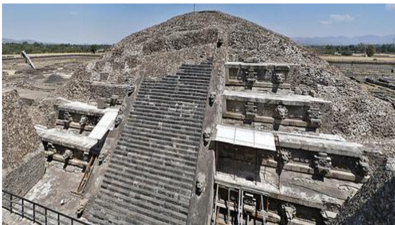
Fig.2. Templo de Quetzalcóatl Autora, 20 de Enero de 2010.

Este documento se trata solamente de una referencia que hacen los pobladores y propietarios, dueños de las tierras de la comunidad indígena de San Francisco Mazapán, para delimitar los linderos de sus propiedades y conformar títulos de propiedad. “[...] El plano está dibujado en el reverso de una hoja vieja de pergamino. Mide sesenta y dos centímetros de largo por treinta y ocho de ancho.” 9