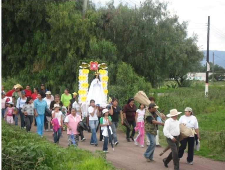
Fig.15. Novenario de las fiestas patronales. 14 de Agosto, de 2009.

El día 13 de agosto se hace una celebración diferente pues en este día se recuerda la muerte de la Virgen María, para lo cual se pone en el centro de la iglesia la otra imagen de la Virgen de la Asunción (la que esta dormida).