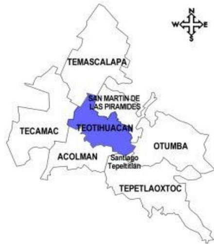
Mapa 1.

La cabecera municipal es llamada Teotihuacan de Arista, se conforma por los siguientes pueblos: Purificación, Puxtla, San Agustín Actipac, San Francisco Mazapa, San Isidro del Progreso, San Lorenzo Tlalmimilolpan, San Sebastián Xolalpa, Santa María Coatlán, Santa María Cozotlán, San Juan Evangelista, Santa María Maquixco, Santiago Atlatongo y Santiago Zacualuca. Cuenta con las siguientes colonias: Acatitla, Ampliación Ejidal Maquixco, Colatitla, El Cayahual, Hacienda Cadena, Nueva San Pedro, Nueva Santa María, Palomar Atlatongo, Palomar Maquixco, Santa Catarina, La Cañada, Huepalco, Azteca, Nueva Evangelista, Nueva Teotihuacán, Villas de Teotihuacán, El Tejocote, El Potrero, La Ventilla, El Mirador, Ampliación Ejidal Tlajinga, De los Deportes y Del Valle y también cuenta con una ranchería, llamada Metepec. Se encuentra integrado al Distrito Décimo Segundo Judicial con sede en la Ciudad de Texcoco de Mora, en el aspecto político pertenece al trigésimo noveno Distrito Electoral, con sede en la cabecera municipal de Otumba; y en materia federal al quinto Distrito Federal Electoral, con sede en la cabecera municipal de Teotihuacan. 12