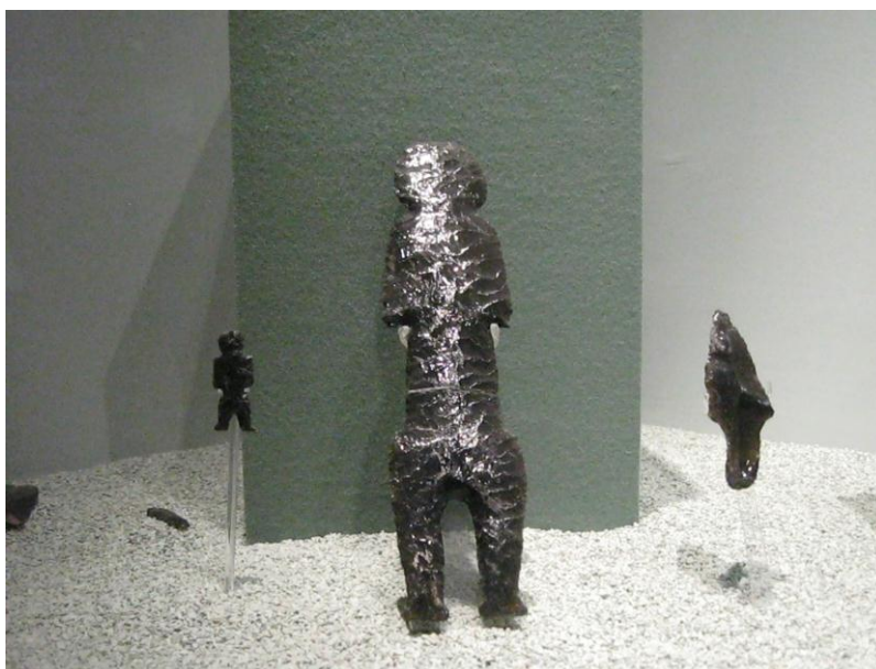
Fig.29. Figura Antropomorfa hecha en obsidiana, cultura teotihuacana. Museo de Sitio, Teotihuacan. Autora. Agosto de 2010

reportado cerca de 400 en el interior de la urbe, empezaba el trabajo de transformación en diferentes objetos. Esta tarea la realizaban expertos, pues su elaboración requería de un amplio conocimiento de la materia prima y de las técnicas empleadas, como la percusión, el desgaste y otras. Por su especialización, no sería de extrañar que el oficio se transmitiera de padres a hijos. Entre los objetos que más abundan están las puntas de dardos o de lanzas; navajas prismáticas extraídas del núcleo de obsidiana, algunas finamente acabadas; máscaras, orejeras y otros adornos, así como figuras de formas muy peculiares llamadas “excéntricas”, ya que muestran formas no definidas pero sí de gran belleza. Entre las piezas hay pequeñas hoces que se ha pensado sirvieron para desgranar, además de otros utensilios como raspadores, pulidores, perforadores, etcétera, y, desde luego, figurillas humanas.” 51