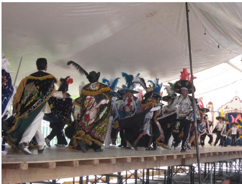
Fig.18. Danza de Moros y Cristianos. Autora. Fiesta patronal, 15 de Agosto, de 2009.

que correspondían a los segundos o por otros que se hicieron ex profeso.” 22 La primera (Moros y Cristianos), esta compuesta por dos bandos, precisamente como lo dice su nombre, uno de cristianos que tienen como encomienda transmitir la palabra de dios, es decir Cristo y los moros que luchan por las tierras en nombre de Mahoma. Su baile es acompañado con una banda de viento, sus trajes son muy coloridos, con representaciones de sus dioses.