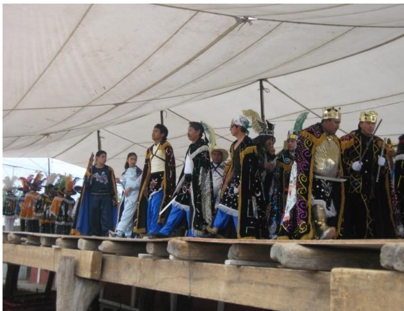
Fig.19. Danza de Moros y Cristianos. Autora. Fiesta patronal, 15 de Agosto de 2009.

Este baile es realizado arriba de un entablado que desde días antes se coloca. El cual puede tener de base horcones de madera o una estructura de metal según sean las condiciones del lugar, pues los horcones van enterrados y la estructura sólo es puesta sobre el pavimento. Dicen los que son conocedores de esta danza que, es mejor en entablado de horcones pues la madera se flexiona más fácilmente a la hora del baile y es menos cansado.