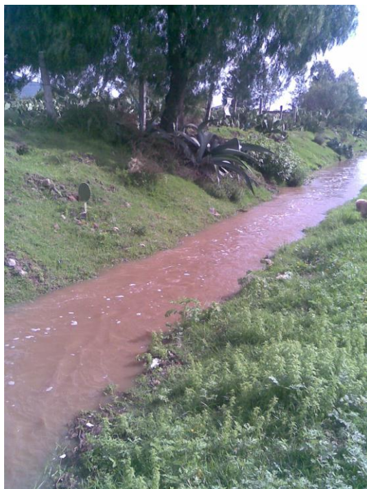
Fig.8. Río llamado camino real Autora. 30 de Junio, 2009

Fue grato recordar viejos tiempos, cuando de niños en las vacaciones de verano íbamos a jugar a la orilla del camino real como se le conoce, con los demás niños y con los perros. Aventábamos piedras, hacíamos barquitos de papel para que navegaran o nos aventábamos al río para refrescarnos. En esta ocasión solo nadaron los perros, pues en el fondo había basura.