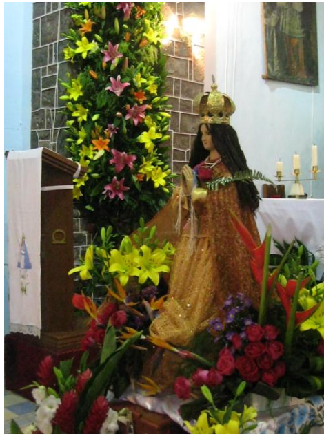
Fig. 17. Virgen de la Asunción o Ascensión. Autora. 13 de Agosto de 2010.

puede ser desde una antigua chirimía, una banda de viento y hasta mariachis, esa noche se queman muchos cohetes.