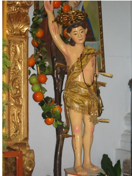
Fig.11. San Sebastián Mártir. Iglesia de Santa María Coatlán. Autora, Agosto de 2009.

ferrocarriles y escuelas laicas. Por lo que la gente escondía sus imágenes y objetos religiosos, los habitantes del pueblo de San Sebastian Xolalpa escondieron la imagen de su Santo Patrono en terrenos ejidales colindantes o pertenecientes al pueblo de Santa María Coatlán, pero se dice que una vez terminada esta batalla un campesino de Santa María encontró la imagen dentro de una arsina (zacate de maíz apilado) y lo llevó a la iglesia de su pueblo, pasando varios años sin que los habitantes de San Sebastián lo solicitaran. Esto ha llevado a que a lo pobladores de San Sebastián les llamen a los habitantes de Santa María los roba santos 21 , por el mal entendido que se dio.