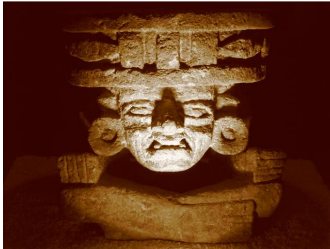
Fig.25. Huehuetéotl o Dios viejo. Museo de sitio, Teotihuacan Autora. Agosto de 2010

requerida. Algunas eran de fácil obtención en lugares cercanos a Teotihuacan y otras provenían de distintas regiones.” 48