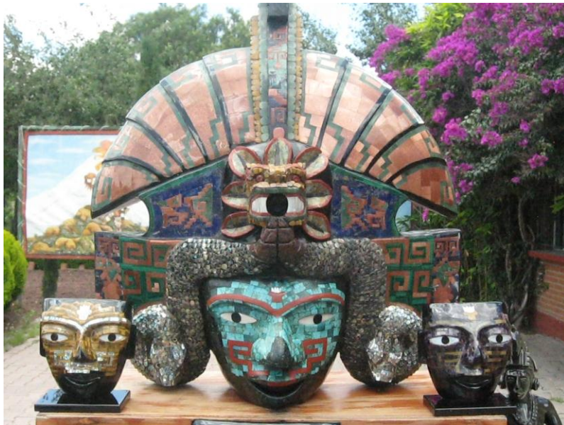
Fig.23. Mascara Teotihuacanas . Trabajo en obsidiana, con incrustaciones de venturina, malaquita, ojo de tigre, madre perla, lapislázuli, concha de abulón, amatista y turquesa. Tienda de Artesanías Itz-Yollotzin. Autora. Agosto de 2010

El origen de las artesanías viene de los talleres familiares, en donde los recursos naturales que les ofrece su entorno, toman nuevas formas para convertirse en verdaderas obras de arte. En las artesanías se plasma la creatividad, sensibilidad, destreza e imaginación del artesano, se conservan rasgos típicos del tipo de trabajo, material y hasta de la región en la cual se elaboran dichas obras. Es una expresión representativa de su cultura y factor de identidad de la comunidad.