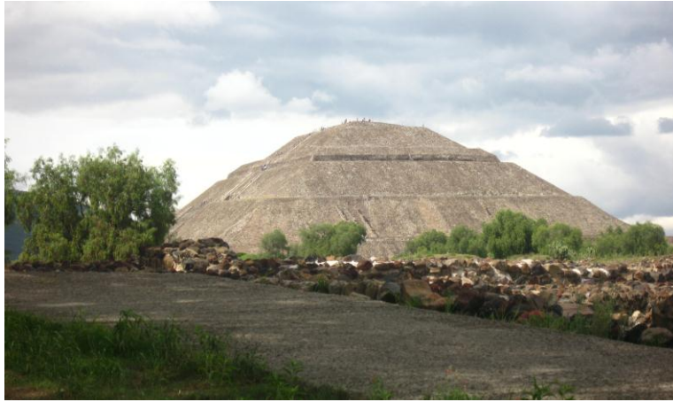
Fig.1. Pirámide del Sol, Teotihuacan.