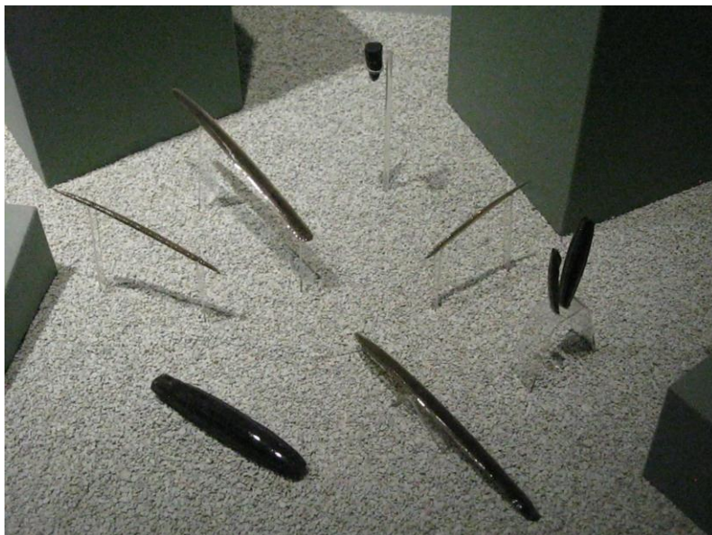
Fig.27. Navajillas prismáticas de obsidiana, cultura teotihuacana. Museo de Sitio, Teotihuacan. Agosto de 2010

trabajaba con este material. De obsidiana se hacían navajas prismáticas, raspadores, puntas de proyectil y de lanzas, adornos, instrumentos para raspar y muchos otros más, entre los que se cuentan los llamados “excéntricos”; es decir, una serie de figuras de diseño complicado –de ahí su nombre- o que representaban al ser humano.