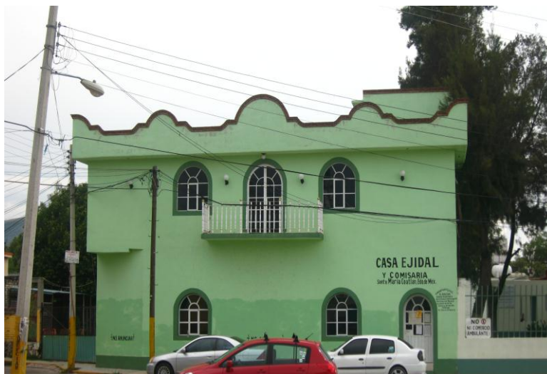
Fig.9. Casa Ejidal y Comisaría Autora, Junio de 2010.

En lo referente a la administración del pueblo se cuenta con una casa ejidal, una casa del pueblo, y ahora con el antiguo edificio de la primaria, que se utiliza para diversas actividades en beneficio de la comunidad. El panteón de la localidad se encuentra en los terrenos ejidales y es también administrado por las autoridades de la comunidad. Existen dos pozos de agua potable que abastecen a toda la población.