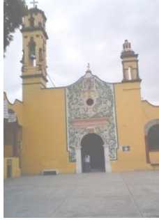
Iglesia de San Pablo Xalpa

El foro cultural más importante de Tlalnepantla es el teatro Centenario ubicado en Av. Roberto Fulton esq. con Av. Sor Juana Inés de la Cruz col. Sn Lorenzo , Tlalnepantla. 1