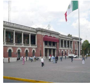
Palacio Municipal de Tlalnepantla