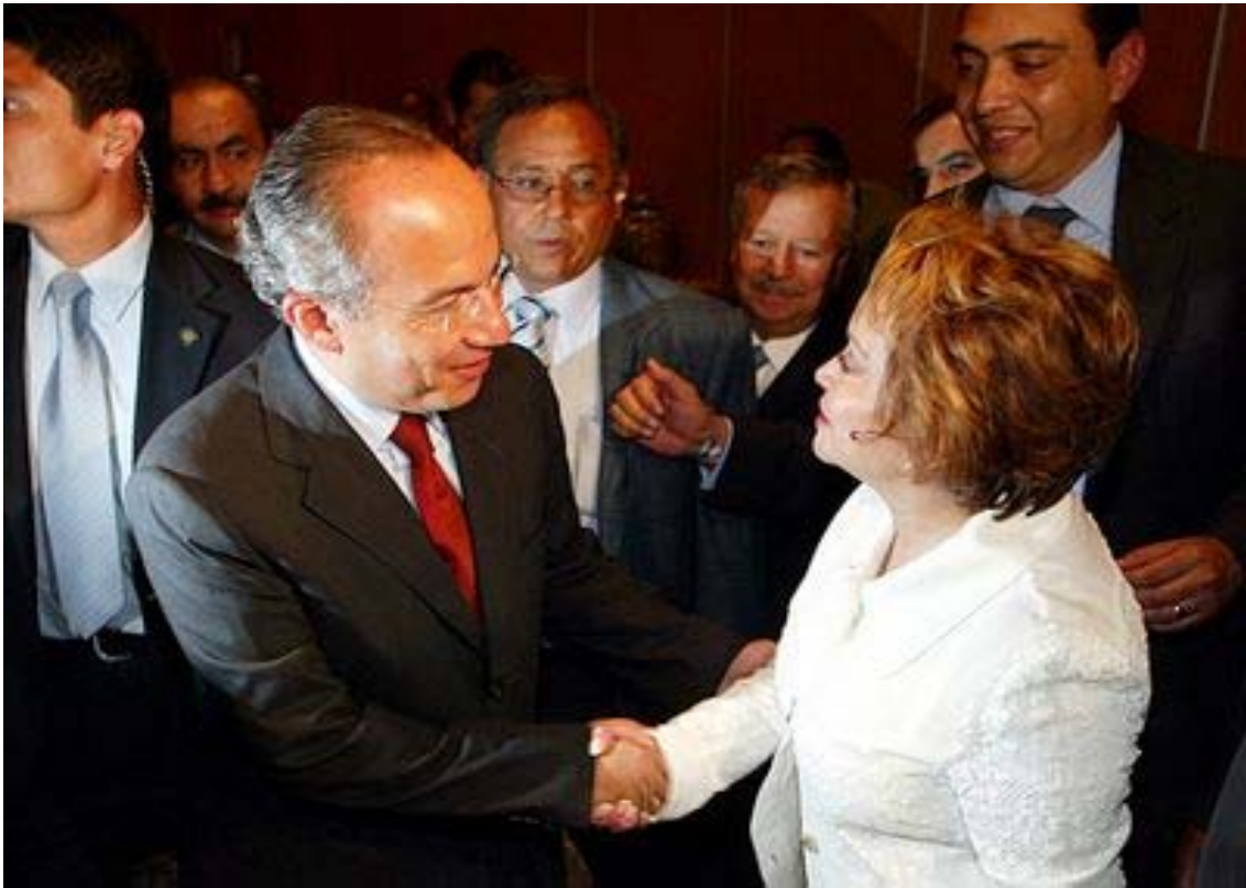
Elba Esther Gordillo y Felipe Calderón, durante una reunión que sostuvo el candidato del PAN a la presidencia de la república con el magisterio nacional, 25 de julio de 2006.