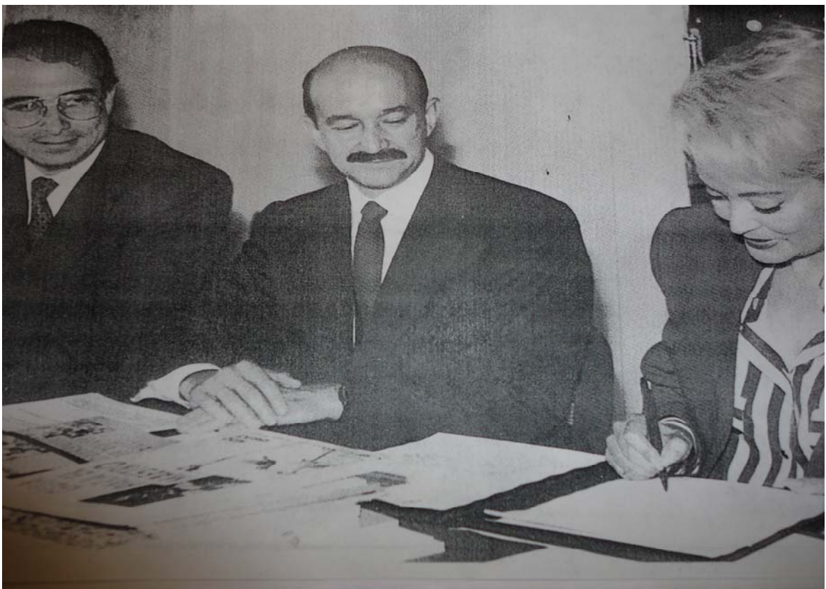
Elba Esther Gordillo en compañía del presidente Carlos Salinas y del secretario de educación pública, Ernesto Zedillo, 1992.