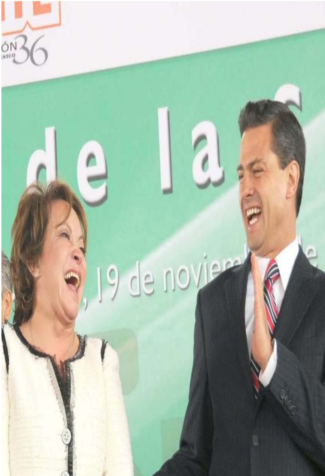
Elba Esther Gordillo y el gobernador del Estado de México, Enrique Peña Nieto, durante la inauguración de las oficinas del SNTE, en Ecatepec, 19 de noviembre de 2010.