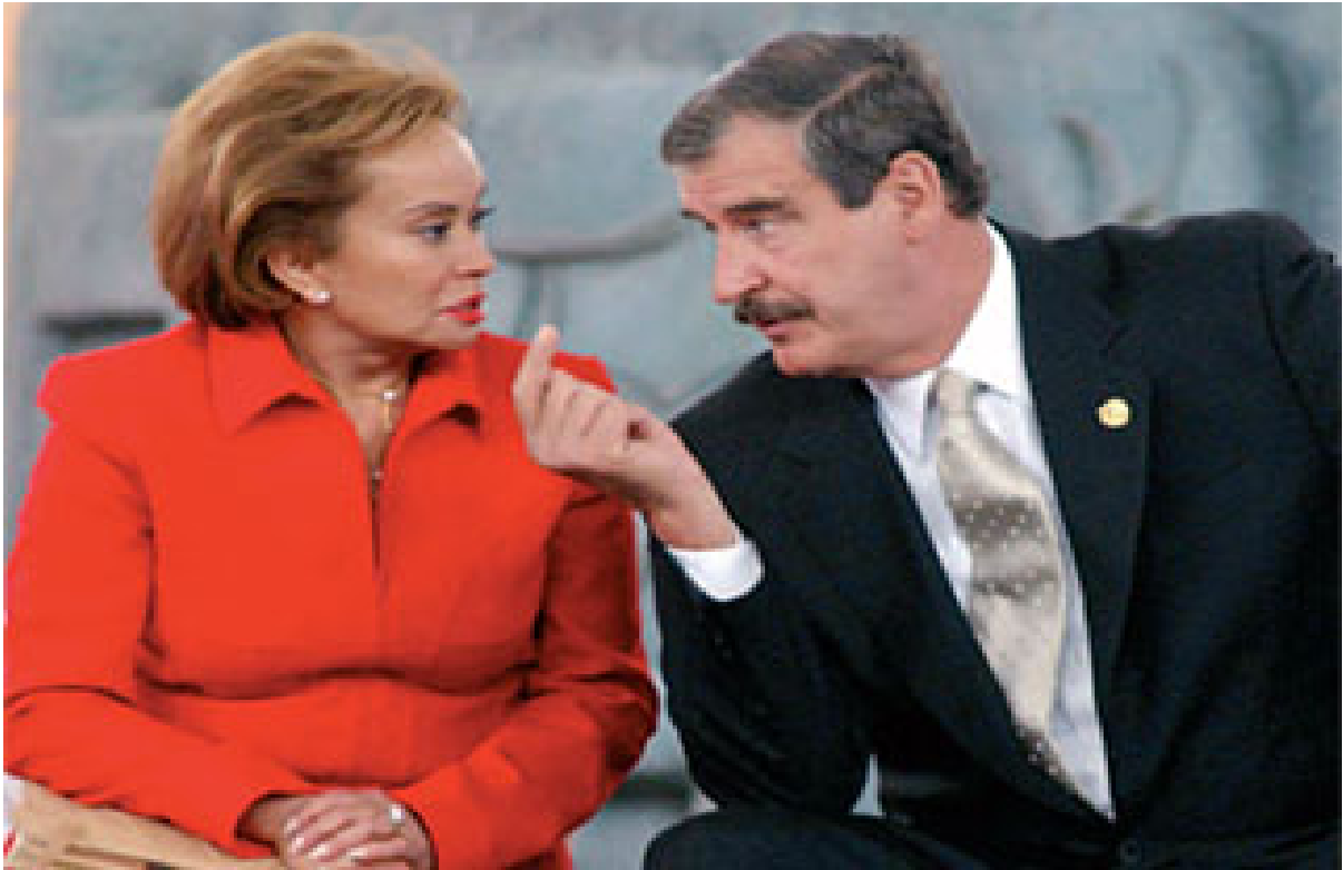
Elba Esther Gordillo con el presidente Vicente Fox, durante la ceremonia de inauguración del “Compromiso Social por la Calidad de la Educación”, que se realizó en el Museo de Antropología, 8 de agosto de 2002.