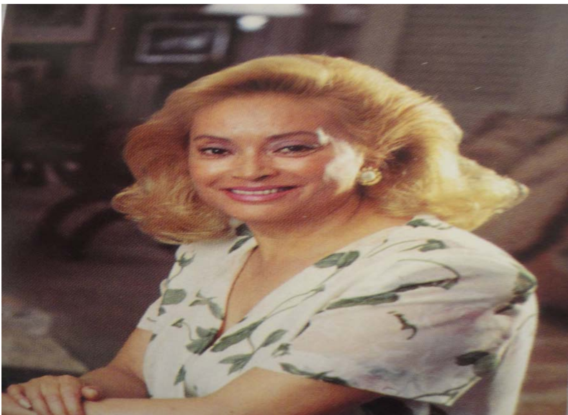
Elba Esther Gordillo en su reinado de Polanco, 1990.