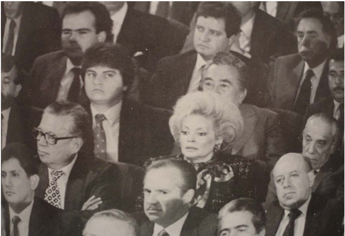
Primer informe presidencial de Carlos Salinas de Gortari. "Era la única mujer", 1989.