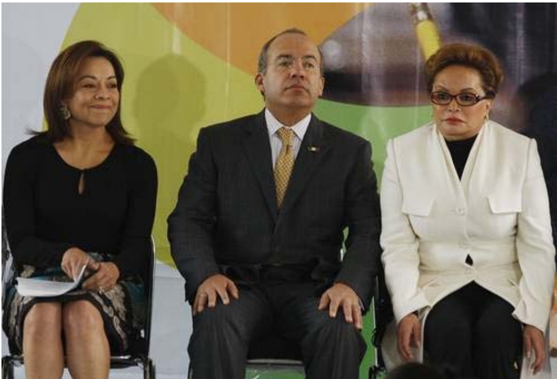
Josefina Vázquez Mota, Felipe Calderón y Elba Esther Gordillo en Los Pinos, 2008/12/09.