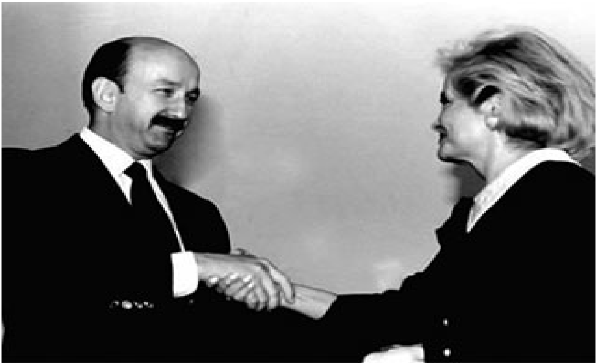
Elba Esther Gordillo con el presidente Carlos Salinas durante un desayuno del día del maestro, 1989.