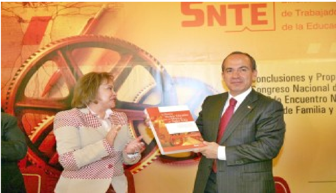
Elba Esther Gordillo, en la entrega de las Conclusiones y Propuestas del IV Congreso Nacional de Educación y el Segundo Encuentro de Padres de Familia y Maestros, a Felipe Calderón, Ciudad de México, 22 de junio de 2007.