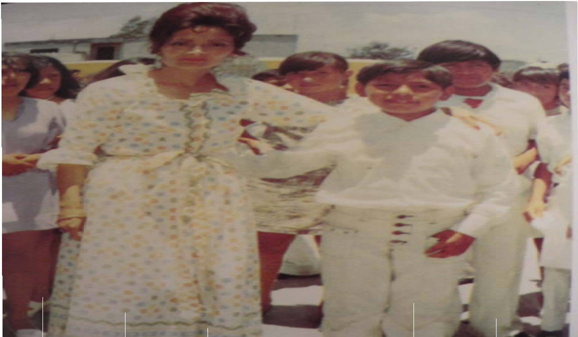
Elba Esther Gordillo cuando era maestra en Ciudad Nezahualcóyotl, 1992.