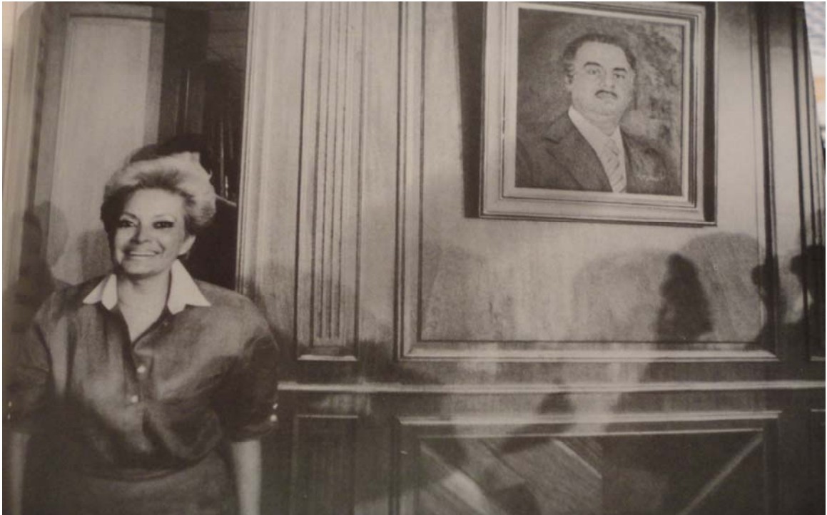
Elba Esther Gordillo con un cuadro de Jonguitud, en el primer día del resto de su vida, de abril de 1989.