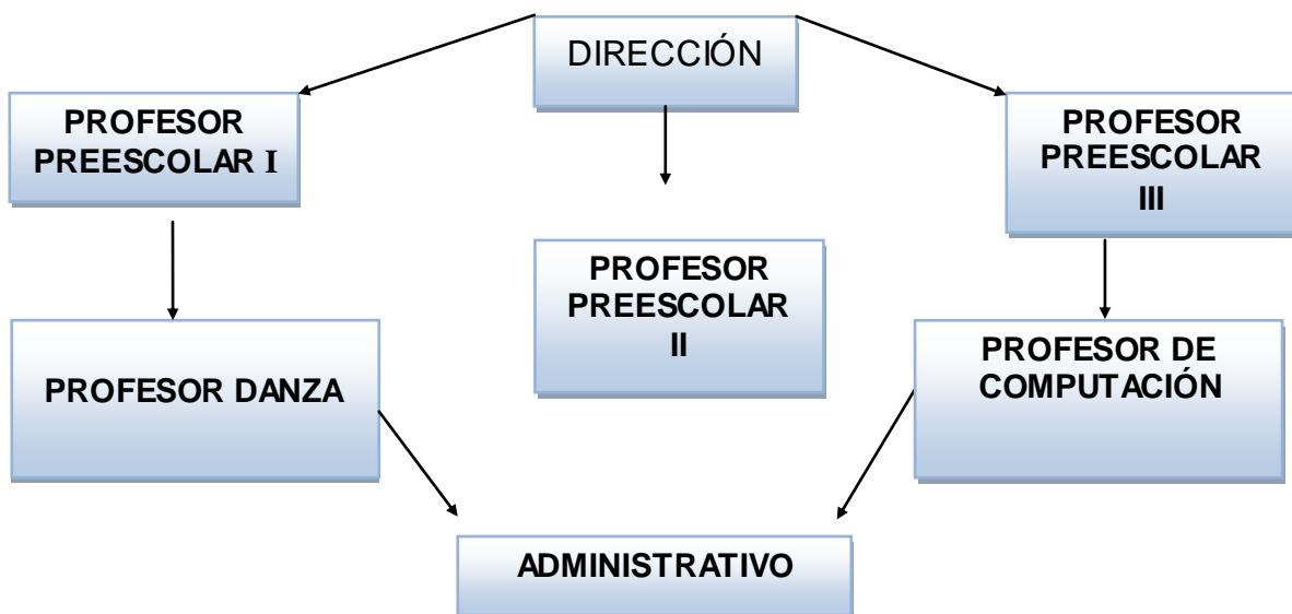
Figura 6: Organigrama de la Escuela Centro de Desarrollo Infantil “Huitzilín” 20

El Centro de Desarrollo Infantil “Huitzilín” está formado por: 1 Director, 3 Profesores de Educación para el área de preescolar, 1 Profesor de Actividades Tecnológicas (Profesor de computación), 1 Profesor de Actividades Artísticas (Profesor de danza) y 1 Personal Administrativo, los que se representan en el siguiente organigrama: