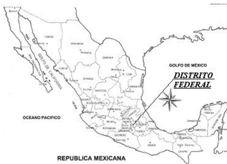
Figura 1: Ubicación Geográfica de la Escuela Centro de Desarrollo Infantil “Huitzililn” 2

A continuación se muestra el mapa de la República Mexicana donde se identifica la ubicación geográfica de la Escuela Centro de Desarrollo Infantil “Huitzililn”.