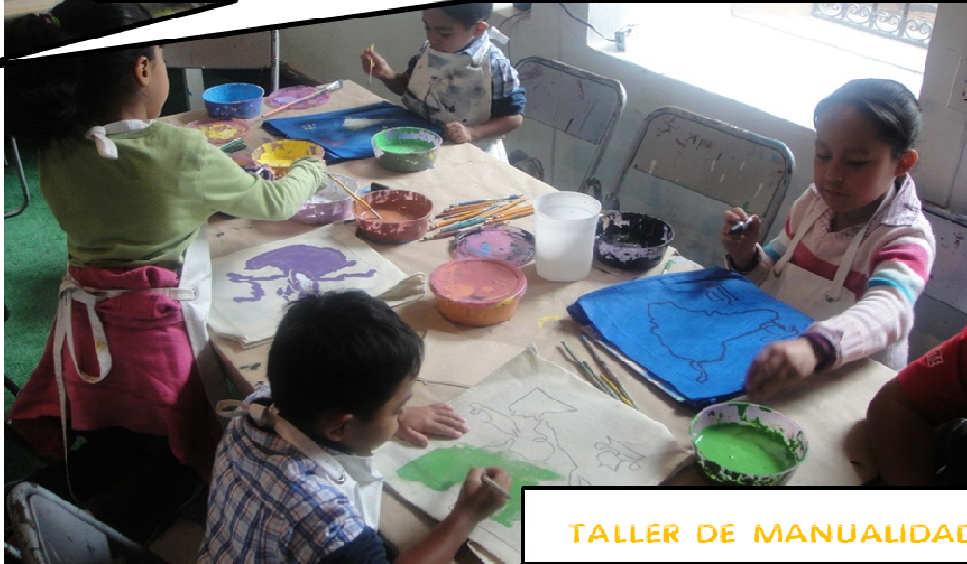
TALLER DE MANUALIDADES

Aquí desarrollan su creatividad, sus habilidades motoras finas (dibujar, utilizar pinceles, etc.), su independencia, su sociabilidad, su lenguaje y por lo tanto están aumentando sus conocimientos.