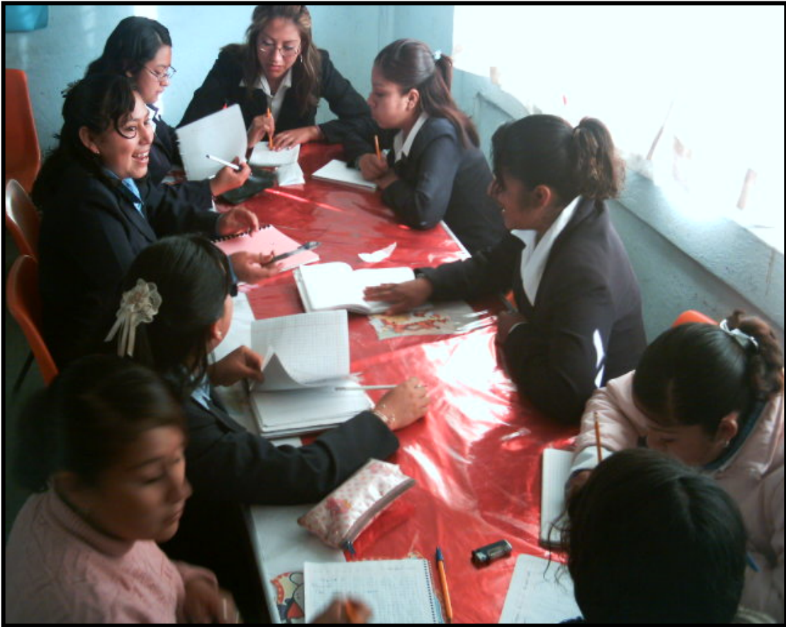
De la Actividad No. 05

Los alumnos se organizaron, discutieron y aportaron ideas para la presentación de trabajos en esta asignatura.