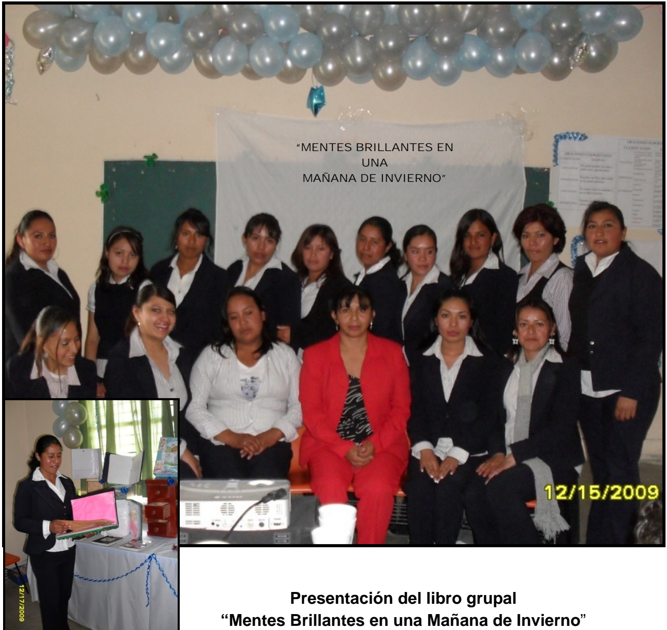
Presentación del libro grupal "Mentes Brillantes en una Mañana de Invierno"