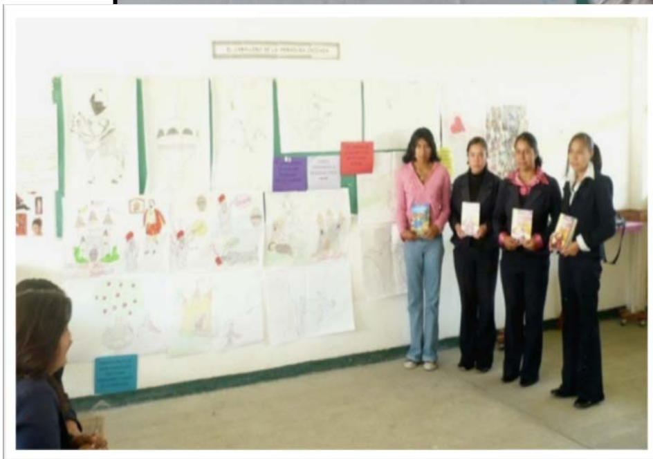
Exposición del libro y su contenido.