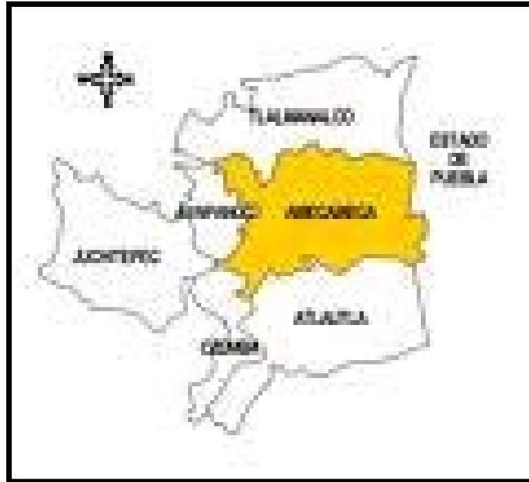
Fig.2 Municipios que colindan con Amecameca.

Los límites del municipio son: al norte, el municipio de Tlalmanalco; al este el estado de Puebla; al sur, los municipios de Atlautla y Ozumba; y al oeste, los municipios de Ayapango y Juchitepec 2 , véase figura 2.