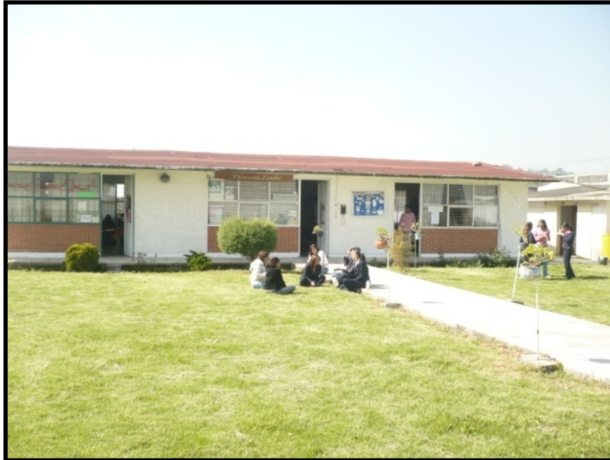
Fig. 3 Muestra aulas de Dirección y Supervisión Escolar

Tras estos salones se encuentran 6 aulas independientes una de otra, en donde se encuentran los siguientes grupos y mobiliario: dos de Secretaria Ejecutiva de primer y segundo grados, con pupitres en regular estado, mesas para colocar las máquinas de escribir, un pizarrón, un archivero, láminas relacionadas a los temas de estudio y un mueble para guardar materiales de las profesoras.