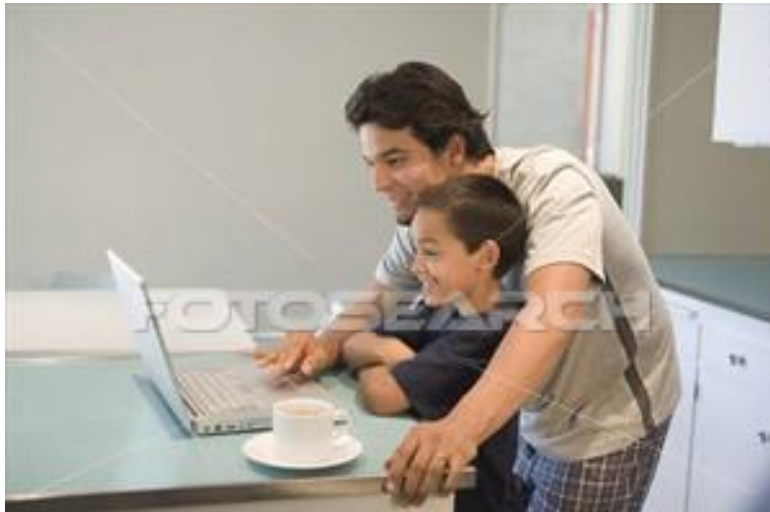
Vigilancia del uso de los medios de comunicación.

No. 4. La responsabilidad del uso de los medios de comunicación recae directamente en los padres de familia y en la buena educación por parte de los maestros, por ello es muy importante la vigilancia y el buen uso que se le dé.