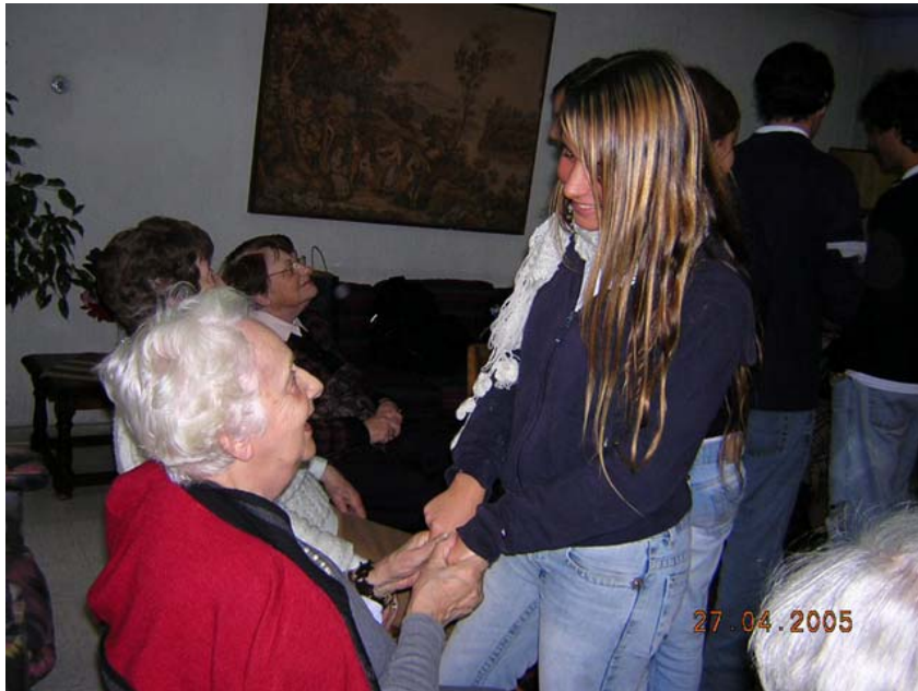
Valor del respeto.

No. 5. El comportamiento, la conducta, las actitudes y los valores morales que son reflejados por niños, jóvenes, adultos y la sociedad en general en cada una de sus acciones y cuando se realizan con respeto, honestidad, igualdad y amor a su prójimo, concibe una mejor convivencia social, digna de admirar y respetar.