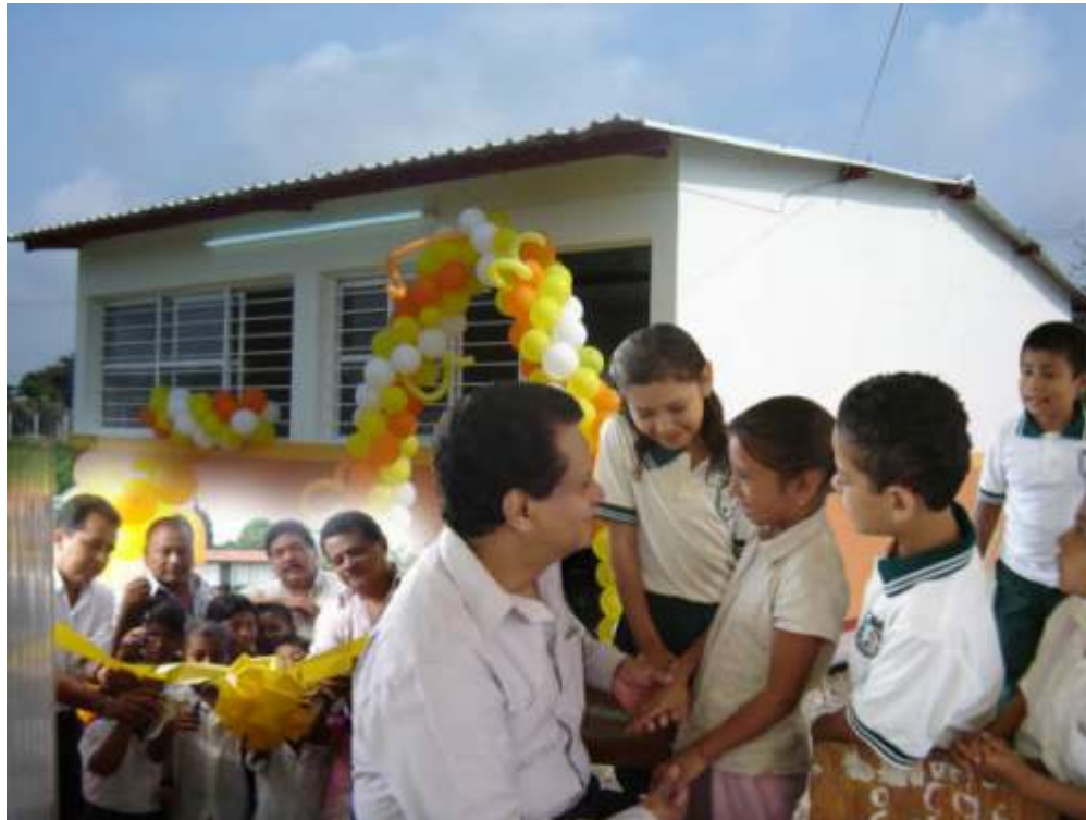
Escuela con Valores.

No. 2. La nueva concepción de la educación es la de educar con valores, por lo que en la actualidad es necesario tener como misión crear escuelas con valores.