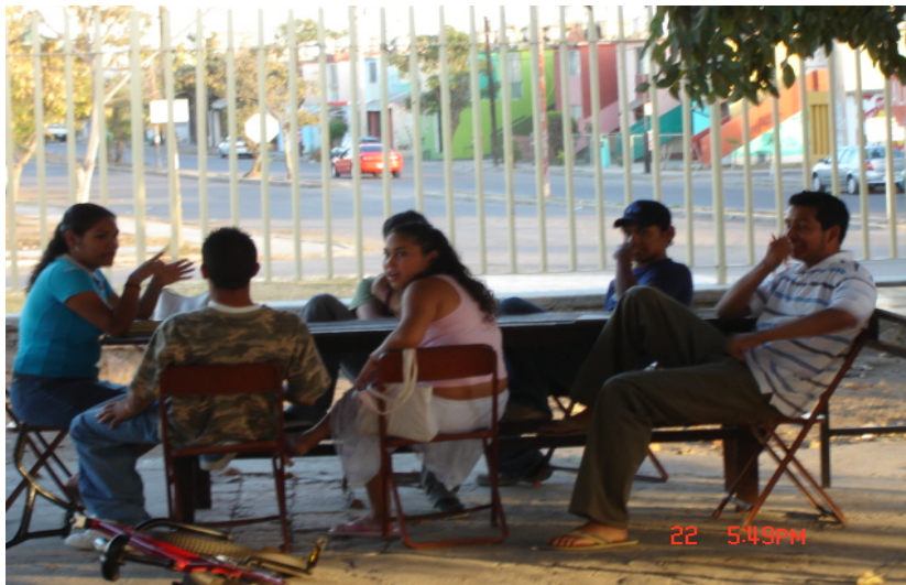
Los jóvenes durante la asesoría

3.- Observaciones: Algunos utilizaban croquis u otros dibujaban el transporte que utilizan para llegar al punto de encuentro, en su gran mayoría acudían juntos, pero estos tiempos no eran aprovechados para platicar ya que por parte de los jóvenes comentaban que se venían escuchando música o jugando en el celular.