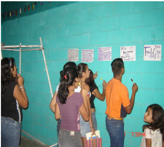
En la actividad de “Mapa parlante”