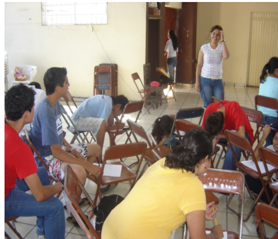
Realizando la dinámica “El clip”