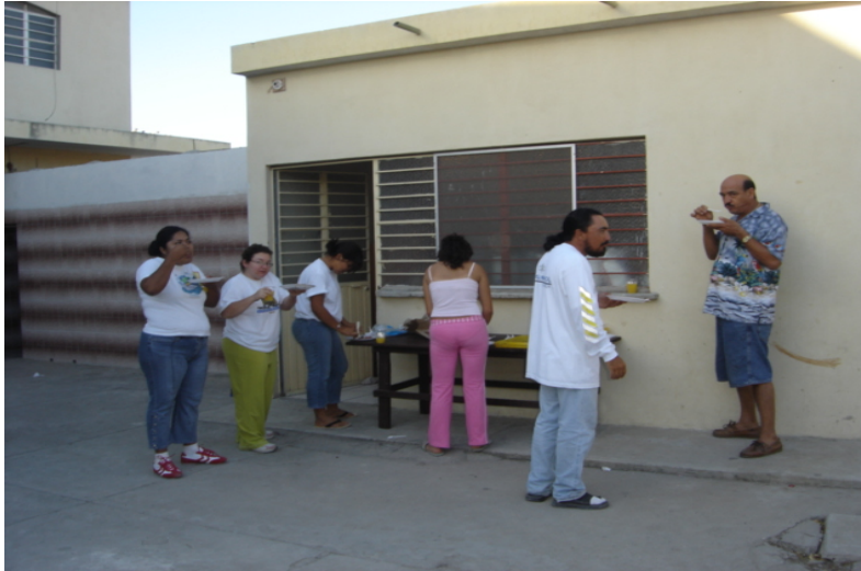
El equipo que preparo los alimentos de para la convivencia final