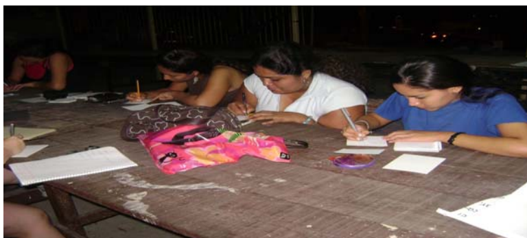
Alumnos realizando la actividad de “Escenario ideal”

Los que consideramos seria ideal para la realización de este proyecto, es un buen trabajo en equipo, crear un espacio donde los padres e hijos puedan comunicarse, así como organizar y priorizar sus actividades e intereses, que todos los padres de los jóvenes que son educandos de este punto de encuentro puedan asistir a la realización de este proyecto y las actividades que en este se realizarán.