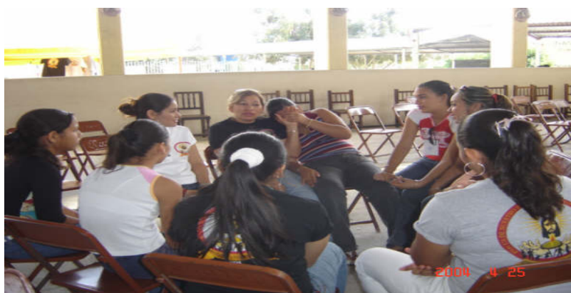
Algunos asesores, alumnos y padres de familia en la actividad roles de grupos

Observaciones: Los asesores consideran que estas habilidades son de suma importancia para la realización del proyecto ya que en todas las actividades que realizaremos es necesario que existan personas entusiastas, responsables, organizadas, comprometidas. Ellos mencionan que pondrán en práctica todos sus conocimientos y destrezas.