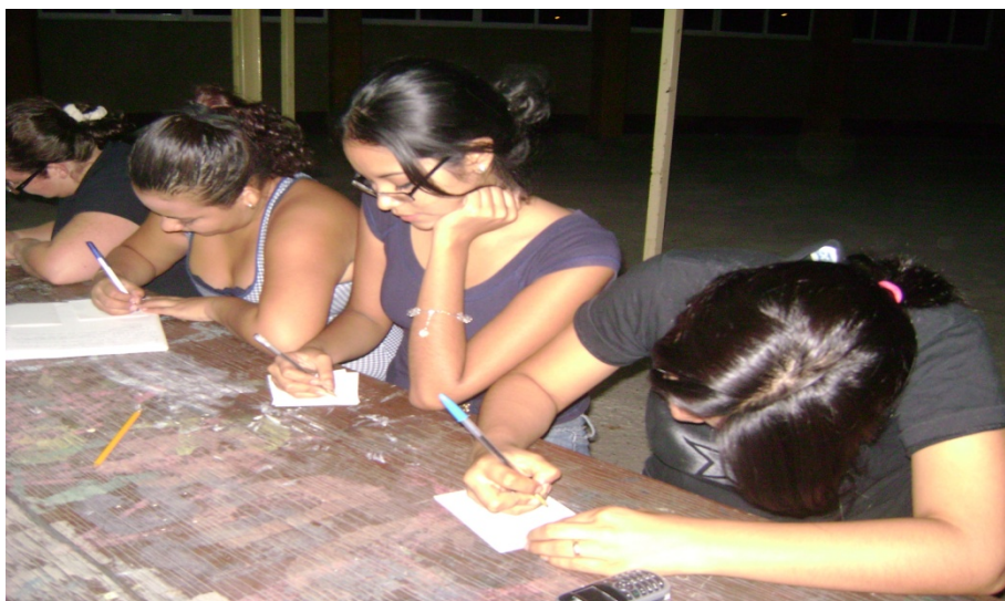
Las alumnas realizando la actividad del “Clip”

Observaciones: Cuando aplique la actividad fue un poco confuso para algunos de los muchachos o tal vez les costaba un poco de trabajo analizar sus vidas familiares.