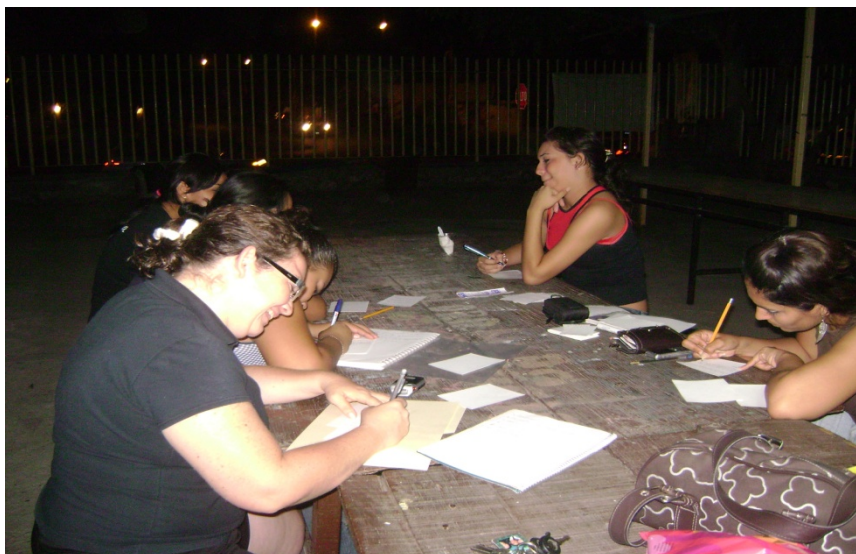
Durante la actividad “roles de grupo”

Observaciones: Durante la identificación de los factores que provocan una mala relación entre padres e hijos fue muy sencillo para ellos mencionarlos, ya que dicen estarlos viviendo actualmente muchos de ellos.