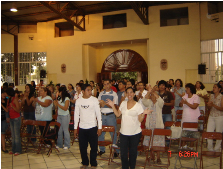
Esta foto muestra una de los primeros encuentros con los jóvenes y sus padres.