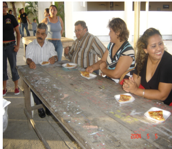
Los padres de familia en la convivencia del último día