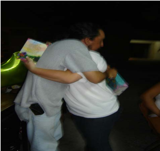
Padres e hijos ofreciéndose un detalle preparados por ellos mismos.