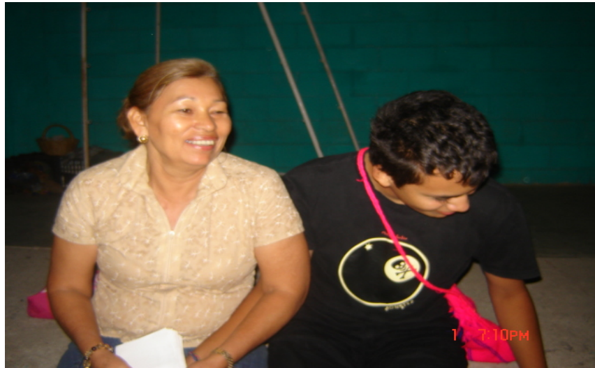
Fotografía tomada después de realizar la dinámica de “Que pasa si”