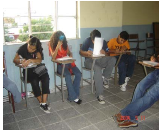
En estas fotos están en un día normal de las clases que les ofrece ISEA