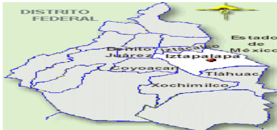
Mapa de ubicación

La Delegación Iztapalapa se encuentra al oriente del Distrito Federal, capital de los Estados Unidos Mexicanos. Tiene una extensión de 105.8 km 2 , 7.5 % de la superficie del D.F.