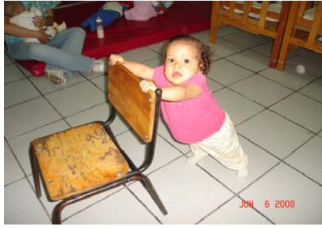
Actividad No.2: “Aprendiendo a desplazarme”