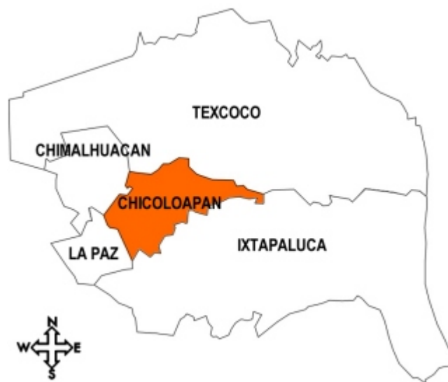
Ubicación geográfica de Chicoloapan