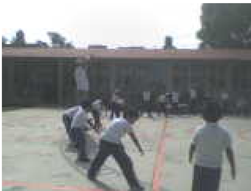
Adoptan diversas posturas