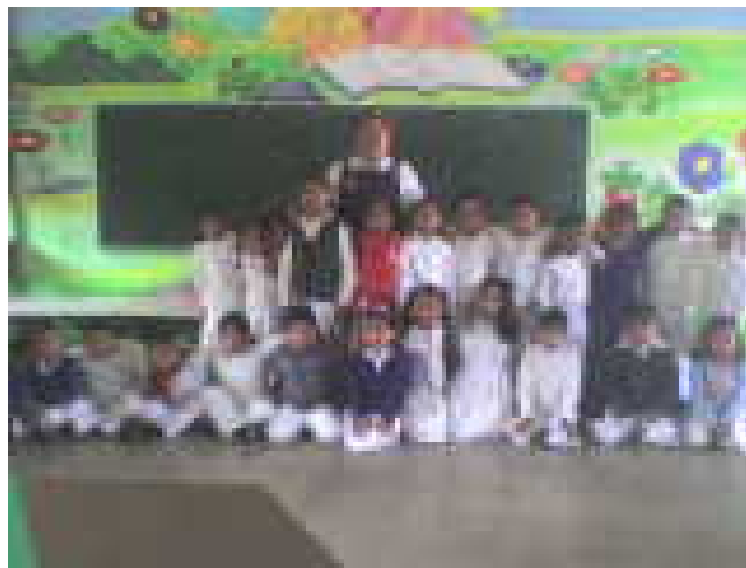
Grupo de 3° A Jardín de Niños “Salvador Cordero”