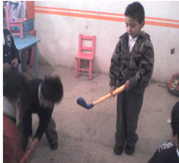
Niños y niñas participando en el juego.

Durante dos sesiones se realizaron varios “juegos cooperativos” de los cuales, los más significativos para los niños y niñas fueron los siguientes: