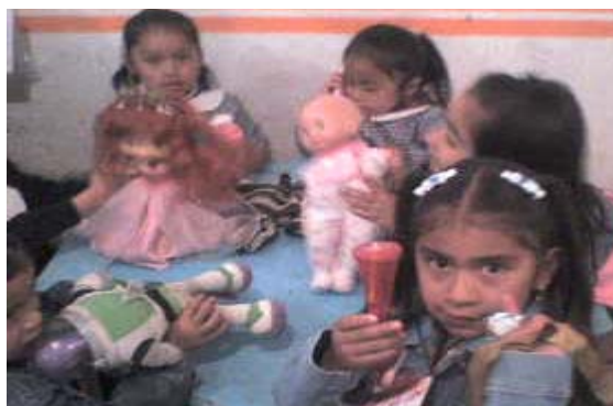
Grupo de niñas jugando con sus juguetes.