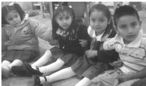
Equipos de niños y niñas intentando levantarse

3.- “Lluvia de pelotas” . Antes de iniciar el juego reunidos en el aula se repartieron hojas de papel para hacer las pelotas posteriormente se guardaron en una bolsa de plástico y salimos al patio. Se dividió al grupo en dos equipos mixtos marcando dos campos de juego, se repartieron el mismo número de pelotas en cada campo y a una señal, los integrantes de cada equipo lanzaron las pelotas que se encontraban en su campo de batalla al campo contrario buscando que su campo quedara libre de pelotas. Se hizo en dos tiempos y el equipo que al terminar el juego tenía menos pelotas en su campo ganó el juego. Esta actividad les gustó mucho sobre todo a la hora de lanzar las pelotas, los integrantes de cada equipo demostraron organización y colaboración aceptando las reglas del juego.