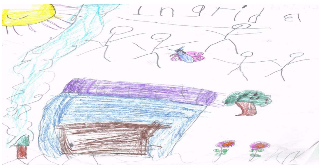
Cartel realizado por un grupo de niñas y niños

Se reflexionó por medio de preguntas sobre la convivencia que tienen dentro del aula y fuera de ella algunas respuestas fueron que debemos respetarnos, no golpear o lastimar a sus compañeros (as), jugar juntos y compartir juguetes. Posteriormente con diversos materiales se organizaron equipos para realizar carteles sobre la convivencia.