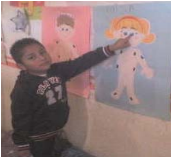
Alumno señalando los ojos en la silueta de la niña.

Al ir colocando las prendas se escucharon comentarios como los siguientes: las niñas también usan pantalón, niños y niñas pueden usar shorts y los niños no se pueden poner vestidos. Las actividades propuestas se lograron llevar a cabo de manera satisfactoria, niños y niñas participaron de manera dinámica, mostrando gran inquietud por participar al vestir a los personajes de las láminas reconociendo e identificando cada una de las partes de su cuerpo por su nombre así como lograron establecer semejanzas y diferencias entre el cuerpo femenino y masculino.