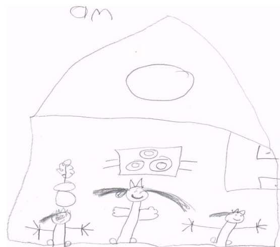
Dibujo realizado por una niña que le gusta jugar con muñecas

La siguiente indicación fue tomar sus juguetes y formar dos equipos uno de niños y otro de niñas. Se realizó otra lista en donde se registraron los juguetes traídos por niños: carritos, dinosaurios, luchadores, superhéroes y por las niñas: un personaje de bozz lightyear, una princesa, un bebé, teléfono, una varita mágica y un reloj. Al terminar la lista iniciaron el juego