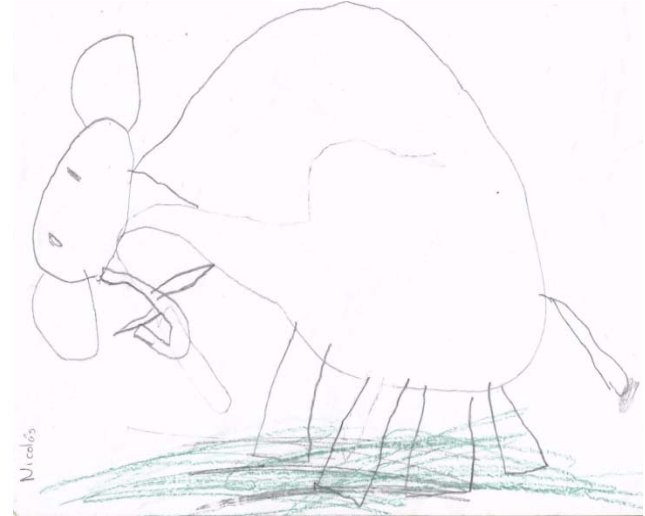
Dibujos realizados por dos participantes representando a la elefanta Margarita.

En la actividad “la historia de Camila y Matías”, sentados en el piso formamos un círculo para escuchar la historia. Durante la narración, niños y niñas hicieron comentarios relacionados con la historia, al decir que Matías quería participar en el taller de baile y que su maestra no lo dejó porque el taller era sólo para niñas, los niños sonrieron y al escuchar que Camila quería jugar fútbol los niños comentaron que las niñas no juegan fútbol. Después continuamos con la narración y cambié un poco la historia dándole otro final en el que Matías participó en el concurso de baile con las niñas y Camila en el equipo de fútbol anotando muchos goles.