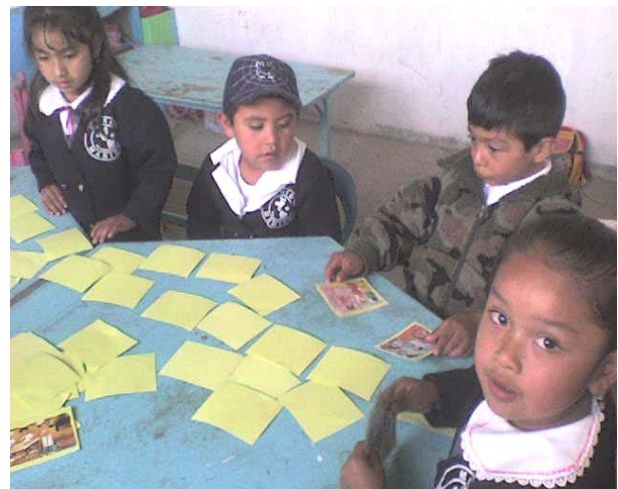
Niños y niñas participando en el juego.

El manejar un taxi tampoco estuvieron de acuerdo y es que no conocen a mujeres manejando taxis. Se observó que tienen más conocimiento de algunas profesiones que realizan sólo hombres y algunas que las realizan ambos por igual como el ser mesero o mesera, cocinero, un comentario de un pequeño al mostrarles al mesero y preguntar si también hay meseras dijo que no porque las mujeres cocinan, los demás dijeron que si hay meseras que conocen y que los hombres que son cheff cocinan. Les dije que no sólo los que son cheff pueden cocinar. Creen que no todas las profesiones las puede realizar una mujer como ser policía y chofer a pesar de que conocen a la mamá de una niña que es bombera.