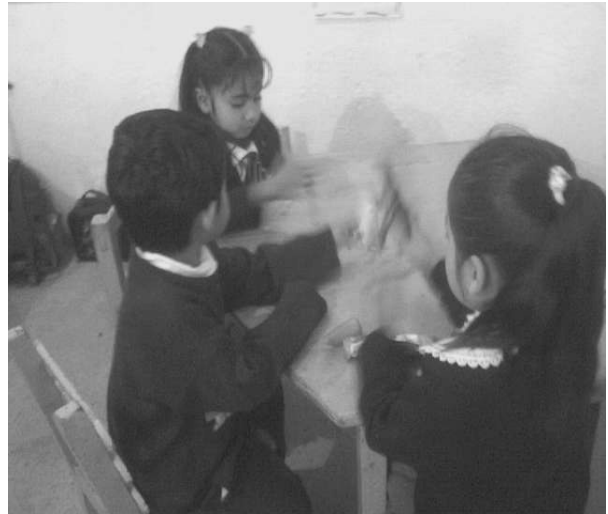
Niños y niñas participando en el juego libre

Se formaron tres equipos en las mesas de trabajo y cada participante con sus juguetes en la mano a una indicación iniciaron el juego compartiendo sus juguetes con sus compañeros (as) de equipo. Hubo dificultad al iniciar el juego ya que no se contaba con suficientes juguetes sólo