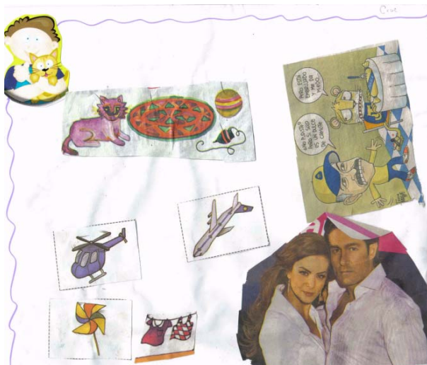
Cartel que muestra los gustos y preferencias de un niño.

Al iniciar la sesión que corresponde a la actividad “silueta de estereotipos” se reunió al grupo en el patio formando un círculo se integraron por parejas (niño-niña) y les repartí a cada participante una hoja de papel bond y un marcador, indicando que cada uno (a) deberá dibujar la silueta de su compañero (a) en el papel al estar acostados sobre el mismo. Después escribimos el nombre de cada participante en su silueta y cada quién procedió a pegar los recortes en su propia silueta. Al terminar de pegar los recortes, se colocaron las láminas en la pared y en parejas compartieron sus siluetas con el resto del grupo.