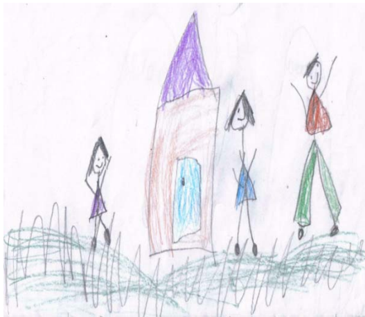
Dibujo realizado por una niña trabajando en un supermercado.

Imaginar ¿cómo son?, ¿en qué trabajan? y ¿quiénes trabajan con ellos y ellas? Después de un tiempo aproximado de 10 minutos se indicó que poco a poco abrieran los ojos y con el material disponible realizaran un dibujo de lo que imaginaron. Algunos participantes se dibujaron en un zoológico, manejando autos, como policías, bomberos, jugando fútbol, como soldados, un pequeño en especial mencionó que le gustaría ser policía, bombero o enfermero. Cabe mencionar que el pequeño es hijo único su mamá es soltera y a demás es enfermera. Los dibujos de las niñas fueron más detallados se dibujaron en una zapatería, en un supermercado, en una escuela y vendiendo ropa, se hizo referencia a las profesiones y ocupaciones que conocen y a la que se dedican las personas conocidas por ellas.