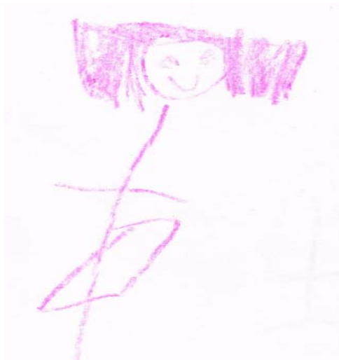
Dibujo realizado por una niña.

Para cuidar su cuerpo se bañan, van al médico cuando se enferman y se cuidan del peligro en la escuela, la calle y el hogar para prevenir accidentes. En cuanto a las diferencias entre compañeras y compañeros algunos son más altos que otros, los niños corren más rápido y juegan a las luchas y se parecen a su papá. En los dibujos que realizaron de sí mismos (as) sólo dos niños y dos niñas se dibujaron solos, describiéndose físicamente, los demás se dibujaron con su familia y jugando en casa. Por lo que considero que debió ser más clara la consigna pues debían dibujarse solos y describirse físicamente.