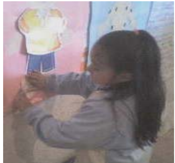
Alumna colocando una prenda a la silueta del niño.

Una dificultad que se presentó durante la actividad de completar las frases fue en la siguiente: A la niña Luisa le molestaría el sol en sus ojos si no fuera por sus PESTAÑAS . La frase no fue lo suficientemente clara para las niñas y los niños por lo que sus opciones fueron anteojos, gorra, sombrilla. Mostraron gran interés por vestir a la niña y al niño queriendo pasar de inmediato a ponerles la prenda que les había tocado. Se observó mayor participación por parte de los niños en las actividades aunque las niñas lo hicieron de manera más moderada.