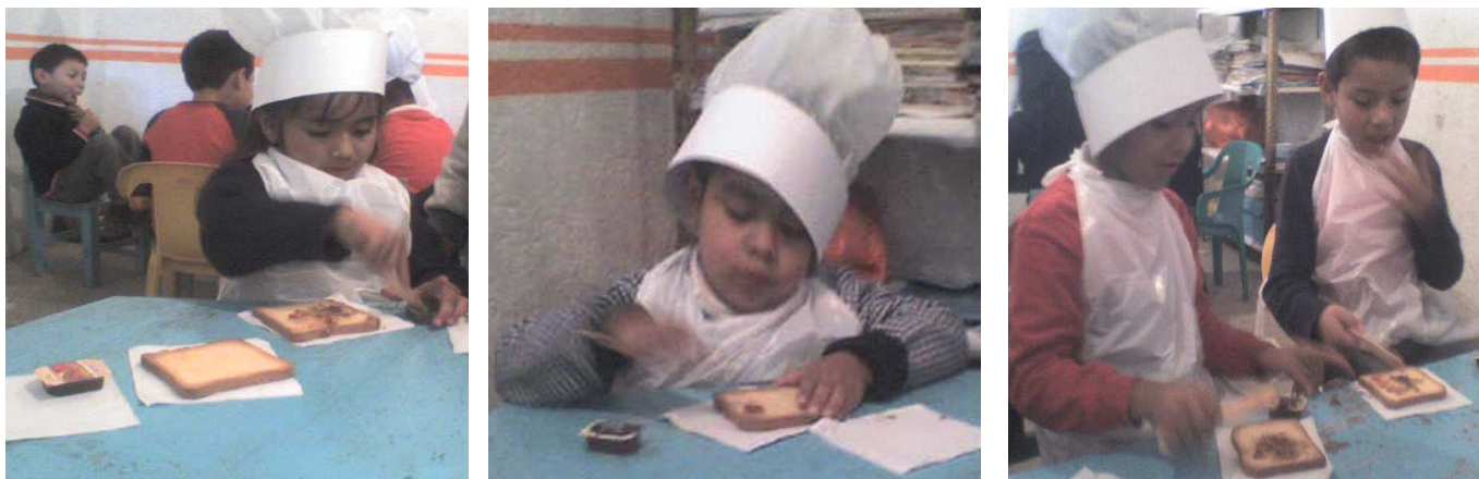
Niños y niñas participando en la actividad.

En el “juego: caricaturas”, se organizó al grupo sentados en círculo iniciando con aplausos y un ejemplo la dinámica: Caricaturas, presenta nombres de actividades de mamá... trabajar, cocinar, lavar, planchar...fueron algunas actividades mencionadas por los y las participantes y en las actividades de papá trabajar, arreglar el jardín, cuidar las mascotas... entre otras. Posteriormente para la “transformación del cuento cenicienta”, se les presentó en láminas las imágenes del cuento y se les fue narrando, las niñas que conocen perfectamente la historia fueron narrándola siguiendo la trama, los demás integrantes del grupo observaban y escuchaban atentos la historia, después de terminar la narración comentamos sobre lo injusto que era para cenicienta hacer todo en casa y que nadie le ayudaba.