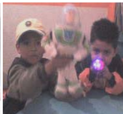
Grupo de niños jugando con los juguetes de las niñas.