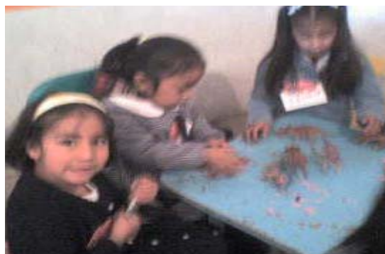
Grupo de niñas jugando con los juguetes de los niños

Para los niños fue difícil permitir que las niñas tomaran sus juguetes, las niñas se mostraron más accesibles y de inmediato se organizaron y empezaron a jugar con los juguetes de los niños. En cambio ellos al cambiarse de lugar y encontrarse frente a los juguetes de las niñas