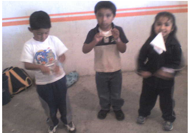
Niños y niñas participando en la ronda y simulando realizar algunas actividades.

Con este juego se pretende que niños y niñas comprendan que todos y todas podemos realizar las mismas actividades en casa, la escuela y jugar los mismos juegos. La respuesta a las acciones fue favorable, rescatando la importancia de cooperar en familia.