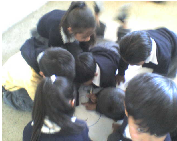
Equipos de niños y niñas trabajando.

Al iniciar la sesión que corresponde a la actividad “silueta de estereotipos” se reunió al grupo en el patio formando un círculo se integraron por parejas (niño-niña) y les repartí a cada participante una hoja de papel bond y un marcador, indicando que cada uno (a) deberá dibujar la silueta de su compañero (a) en el papel al estar acostados sobre el mismo. Después escribimos el nombre de cada participante en su silueta y cada quién procedió a pegar los recortes en su propia silueta. Al terminar de pegar los recortes, se colocaron las láminas en la pared y en parejas compartieron sus siluetas con el resto del grupo.