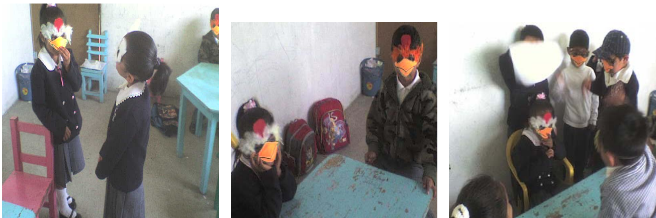
Niños y niñas recreando la historia.

juegan y no ayudan, algunos otros mencionaron que ayudan a no regar juguetes en su cuarto. Al terminar la narración se hizo énfasis en lo importante que es ayudar en casa en las labores del hogar. Posteriormente, se les propuso la idea de representar el cuento preguntándoles qué personaje elegirían, se llegó a un acuerdo y se eligieron los personajes. Se consideró elaborar antifaces y disfraces sencillos para cada personaje y ensayar el cuento.