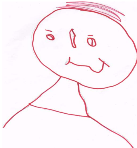
Dibujo realizado por un niño.