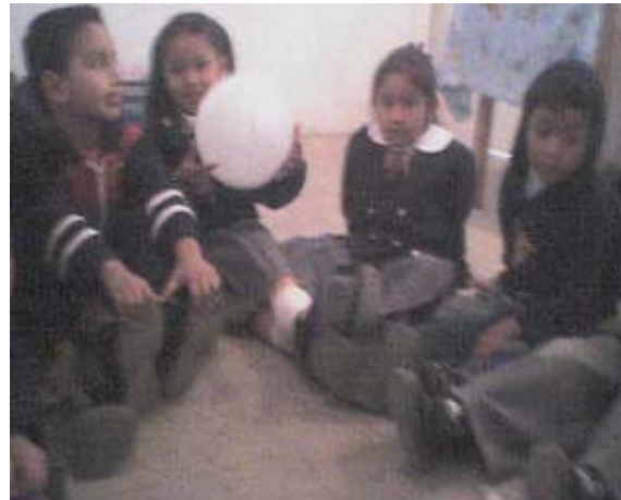
Niños y niñas participando en la dinámica.

Al iniciar el juego lo hicimos con un ejemplo: “esta es la papa caliente y yo soy una niña traviesa”, “esta es la papa caliente y yo soy un niño cariñoso”. Al pasar el globo cada uno (a) mencionaba algo como soy alegre, feliz, risueño, travieso, enojona, berrinchuda, inteligente, grande. En el juego la participación de niños y niñas fue favorable cada que se quedaban con el globo mencionaban una característica especial y niños y niñas querían quedarse con el globo, aunque hubo un poco de dificultad para los participantes a la hora de decir una característica propia ya que les fue difícil elegir la palabra por lo que sus respuestas fueron un poco inducidas por sus compañeros (as).