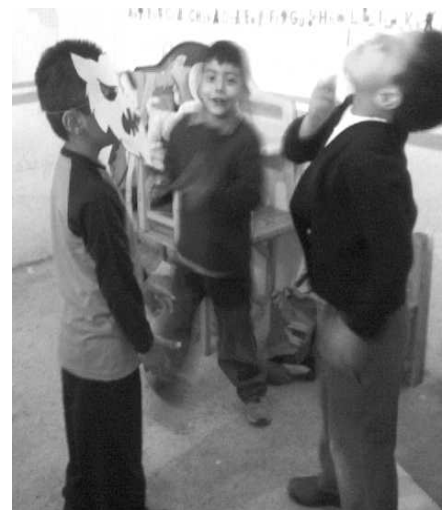
Niños y niñas participando en el juego.