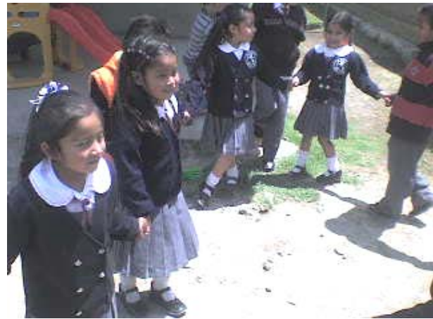
Niños y niñas disfrutando del juego.

Los niños y niñas participaron entusiasmados en todos los juegos, demostrando que si pueden colaborar en equipos mixtos para alcanzar un objetivo o meta sólo que aún no respetan totalmente las reglas pues les cuesta un poco hacerlo.