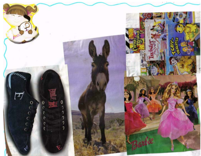
Cartel que muestra los gustos y preferencias de una niña.

Posteriormente se formó un círculo e hicimos comentarios respondiendo a las siguientes preguntas; ¿cómo se visten las niñas y los niños?, ¿qué ropa les gusta más? ¿Con qué juegan