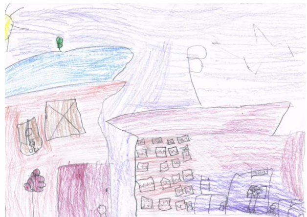
Dibujo de una niña trabajando en una zapatería.

La participación de niños y niñas fue satisfactoria aunque al pedirles que cerraran los ojos e imaginaran ser grandes a los niños les fue difícil concentrarse pues al darles las indicaciones y decir lo que debían imaginar hablaban en voz alta diciendo todo lo que pensaban en ese momento pero al pasar el tiempo se fueron concentrando. Por medio de su dibujo lograron expresar lo que les gustaría ser de grandes y lo compartieron con los demás al describir cada uno (a) su dibujo.