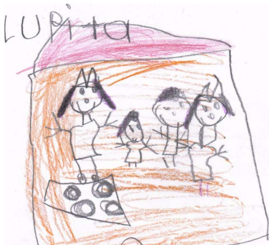
Dibujo que representa el gusto de estar en familia.

Posteriormente se colocó una lámina en donde se iban registrando las respuestas a las siguientes preguntas: ¿Qué hacen las niñas (os)? Algunas de sus respuestas fueron que las niñas juegan al té, con sus muñecas a los caballos y pasean. Los niños juegan con la resortera, con dinosaurios, a los bomberos, con sus juguetes y coches al terminar la lista hicieron un dibujo sobre la actividad que más les gusta realizar y lo compartieron con el grupo.