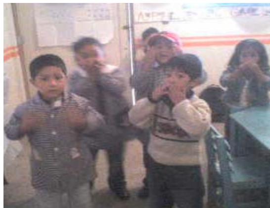
Niños y niñas participando en la dinámica cantando la canción.

Se llegó a la conclusión de que hay diversas acciones que niños y niñas pueden realizar por igual. Al cantar la canción de Mi primo Betino la participación de las niñas y los niños fue favorable pues se mencionaban diversas acciones como mover las manos, bailar, reír, cantar, saltar y que niños y niñas realizaban por igual. Durante el desarrollo de la canción cada uno(a) proponía una acción para realizar recalando que niños y niñas pueden realizarla. Se observó que niños y niñas tienen bien definidas las actividades que realizan de acuerdo a su sexo