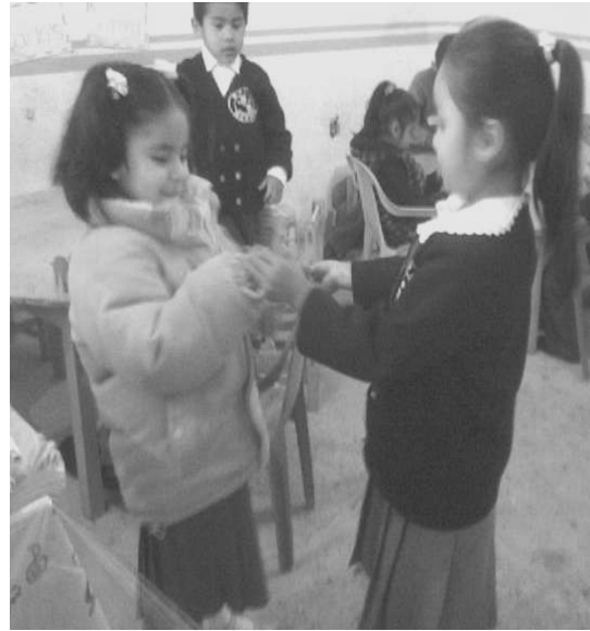
Niños y niñas durante el intercambio de detalles.

Las siguientes actividades corresponden a los juegos y juguetes de niños y niñas. Para la actividad del “juego libre”, se pidió llevar juguetes al salón entre los que se encontraban dinosaurios, cochecitos, pelotas, teléfonos y peluches. Conversamos sobre los juguetes y juegos que prefieren cada uno (a) como el fútbol, andar en bicicleta, jugar con las pelotas, a las muñecas entre otros.