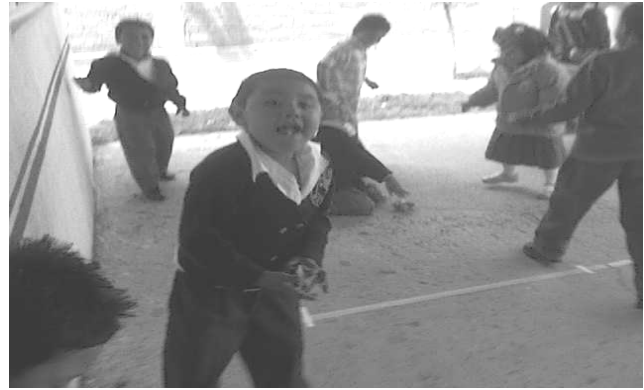
Niños y niñas participando en el juego.

4.- “La jaula” . Se organizó al grupo en dos equipos uno formando una ronda representando la jaula mientras el otro equipo distribuido por todo el espacio para ser pájaros. La ronda girando al compás de un ritmo o música determinada, y los pájaros paseando entre la ronda. Cuando la música se detenía los niños de la ronda se sentaban cerrando la jaula. Los niños y niñas que quedaban dentro de la jaula eran encantados y tenían que dormirse por un momento.