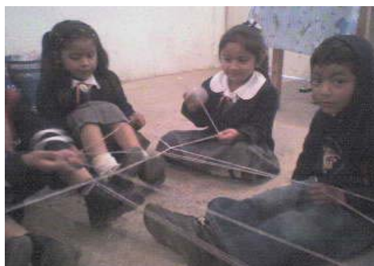
Niños y niñas participando en la dinámica.

Se observó que las niñas muestran un poco de desconfianza al participar en grupo por lo que es necesario favorecer un ambiente más agradable y seguro para que adquieran más confianza al participar en el grupo.