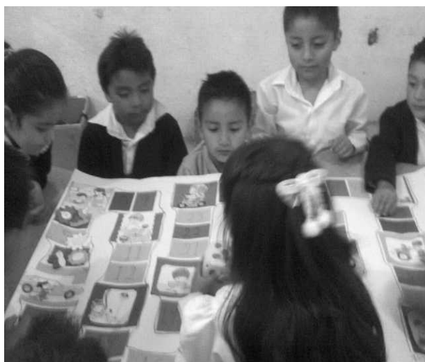
Niños y niñas participando en el juego.

Se observó que aún les sorprende ver acciones realizadas por niños como lavar ropa, trastos, barrer y a las niñas lavar el coche o ayudando a papá en alguna otra cosa que no sea visto como algo femenino.