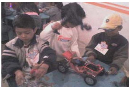
Grupo de niños jugando con sus propios juguetes.

libre con su equipo durante un tiempo aproximado de 15 minutos. Al pasar el tiempo cambiaron de lugar, el equipo de las niñas en el lugar de los niños y viceversa, al escuchar la indicación los niños tomaron sus juguetes para cambiar de lugar por lo que se les dio nuevamente la indicación de cambiarse de lugar pero sin llevarse los juguetes.