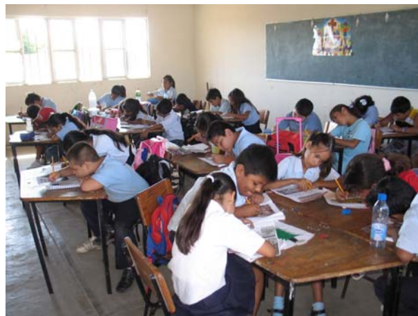
Foto no. 4 Realizando el Periódico del aula El Informante escolar

Entre los problemas enfrentados, el más grande fue la renuencia trabajar, muchos vieron el periódico y les pareció aburrido pues pensaron que eran textos de adultos. Ya que empezamos a leer muchos no querían hacerlo, considerando también que de los treinta niños solo tres no trajeron el material y los demás tuvieron que compartirlos con ellos.