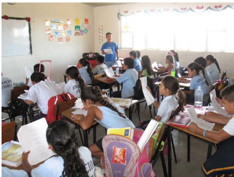
Foto no. 8 Cantando Pásame la botella

Ellos se entusiasmaron, y más fue el asombro cuando llegué con la grabadora y puse las canciones. Repetimos como cinco veces la canción Pásame la botella porque dijeron que no habían entendido su mensaje. El corrido de Mazatlán les gustó por que contaba como era Mazatlán y que un señor que no era de aquí le decía cosas bonitas a la ciudad.