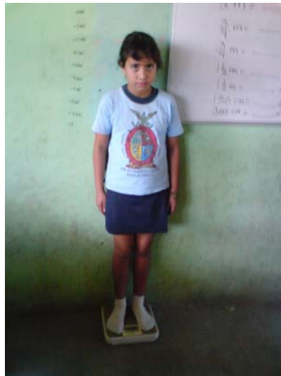
Foto no.1 Analizando peso de los alumnos

Durante la semana llevé una báscula para pesar a los niños del grupo. Previo a esto ya había dibujado una regla en la pared de 1.75 m de altura para medirlos.