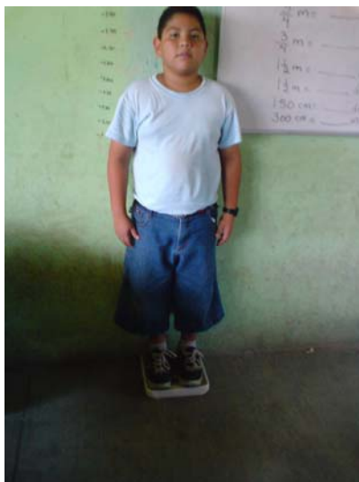
Foto no. 2 Problemas de obesidad

Sabiendo que las causas de que esto se origine es que el fraccionamiento está constituido económicamente por una población que va del nivel pobre hasta el medio. La generalizada pobreza hace que los menores carezcan de comidas completas, lo que les ocasiona bajo peso, infecciones y lento crecimiento corporal, evidencia constante en el grupo.