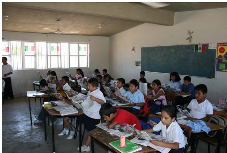
Foto no. 3 Examinando al periódico

Analizamos de manera más detenida cada uno de los periódicos, de tal manera que escogieramos una sección que fuera de nuestro agrado.