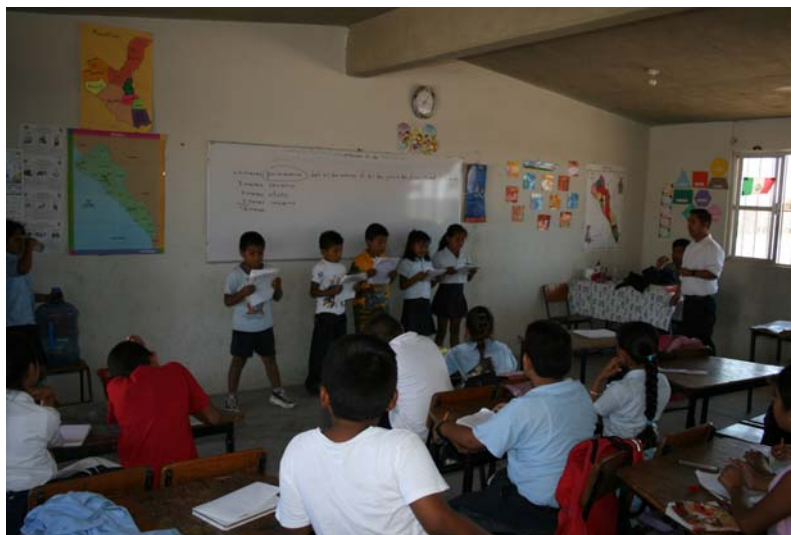
Foto no. 9 Contando chistes

Organicé al grupo en equipos de 5 niños. Cada integrante escribiría un chiste, posteriormente los miembros de su mesa clasificarían a cada uno, del más chistoso hasta el que no hacía reír. Posteriormente, se elegiría a un miembro de la mesa para que leyera el chiste ganador.