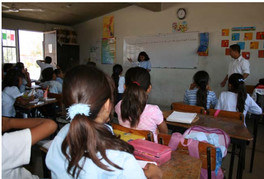
Foto no. 5 Leyendo cuentos al grupo

De lo anterior podemos decir que los niños se mostraron muy participativos, pues las ideas que tuvieron fueron tomadas en cuenta, dando como producto cuentos fantásticos en los que fungían juntos tanto princesas, superhéroes (y heroínas) y animales que ellos mismos inventaron. Se explotó la creatividad de cada menor.