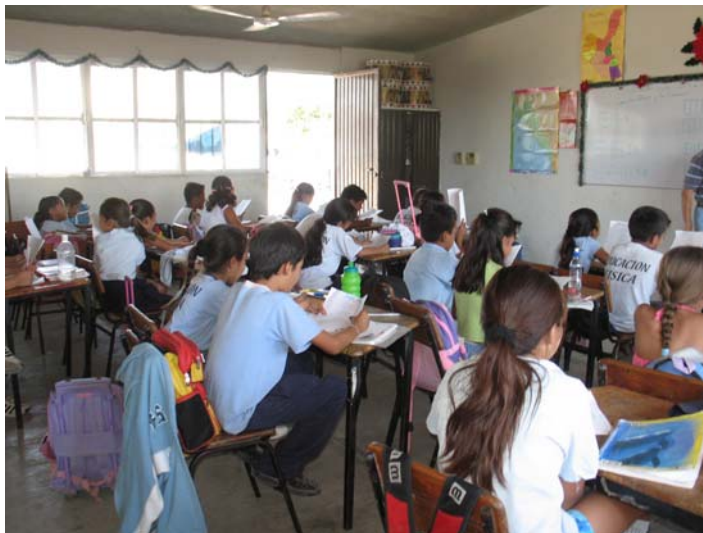
Foto no. 7 Escribiendo cartas

Las cajas que elaboré, me sirvieron para hacer buzones de aula. Coloqué uno afuera de cada salón y les dije a los alumnos que escribieran cartas a algún compañero de cualquier otro grado, para conocerlos y explicar que querían hacer amigos. Aceptaron con gusto, y durante la semana de esta actividad enviamos cartas a todos los grupos, y logramos que se hicieran amigos de niños pequeños como los de primer grado y los mayores de quinto y sexto.