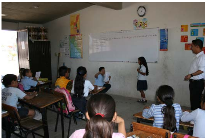
Foto no. 10 Dramatizando un poema

Leímos el poema La playa , en el que se describe de con lenguaje figurado el mar, las cosas que hay en él y cómo las disfrutaban los seres humanos.