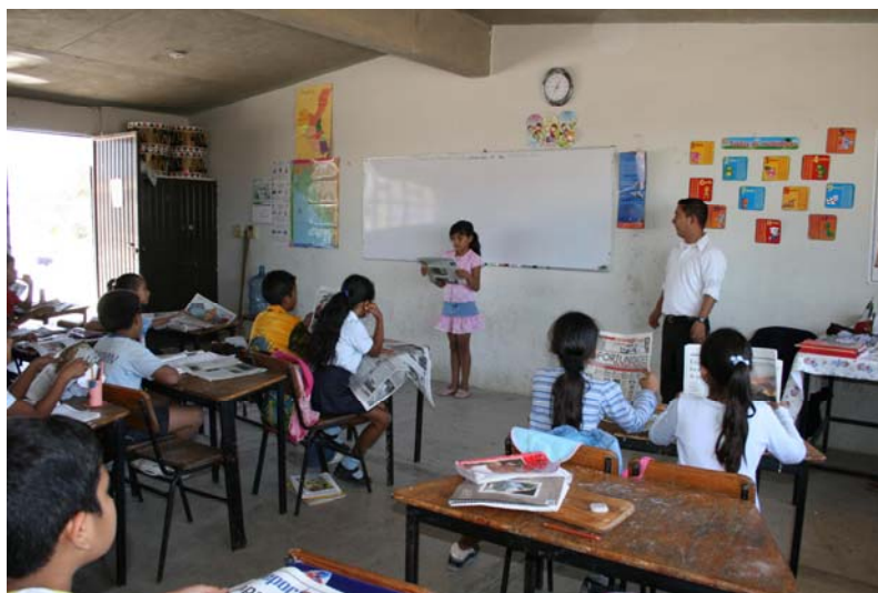
Foto no. 11 Compartiendo lecturas a los grupos

Para realizar este trabajo, se formaron 9 equipos, uno de ellos con 4 integrantes. Tres equipos eligieron revistas, tres escogieron un cuento, dos más periódicos de los cuales uno eligió un parte cultural y el otro un evento social y uno realizó una carta.