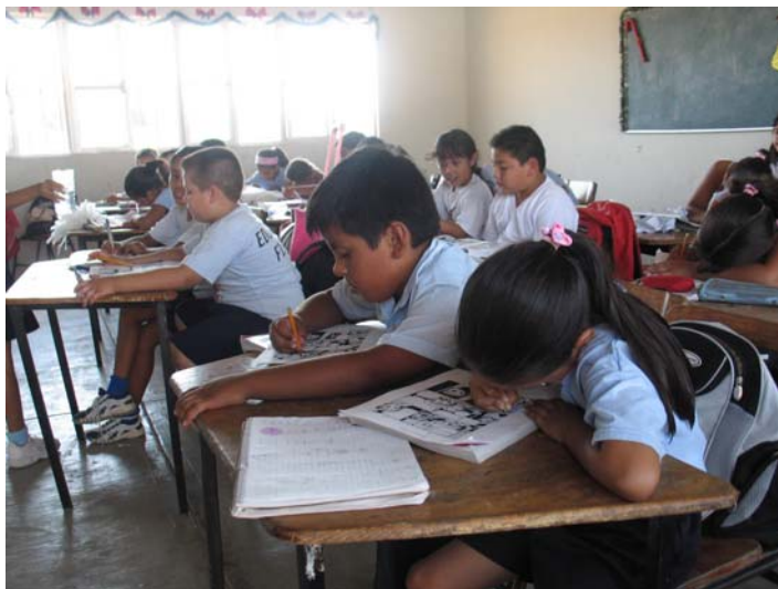
Foto no. 6 Realizando una historieta

Pregunté si alguno de ellos leía de manera constante este tipo de textos. Dos niños me dijeron que sí. Leían los de Spiderman y X-mens . A muchos niños les llamó la atención, pues la mayoría manejan a personajes de caricaturas que ellos conocen. Además, tienen como tema la aventura y problemas que se les enfrentan que deben superar.