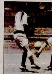
Hoy surgen los campeones de