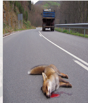
Muerte inútil

10. En plenaria expresen sus puntos de vista sustentando su posición.