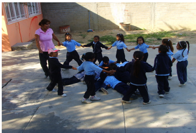
Niños jugando a “La Cucaracha”

círculo acostadas, entonces los niños empiezan a cantar en el patio de mi casa hay una cucaracha, échale flysch, échale más ya se murió, en el patio de mi casa hay una cucaracha échale flysch, échale más, ya revivió entonces las niñas corren para que no las atrapen los niños y después se cambian los papeles los niños son las cucarachas), entonces salimos al patio de la escuela y de inmediato se agregaron los demás niños que estaban dispersos, los niños estaban muy emocionados jugando.