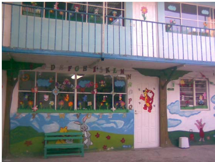
EXTERIOR DE LOS SALONES