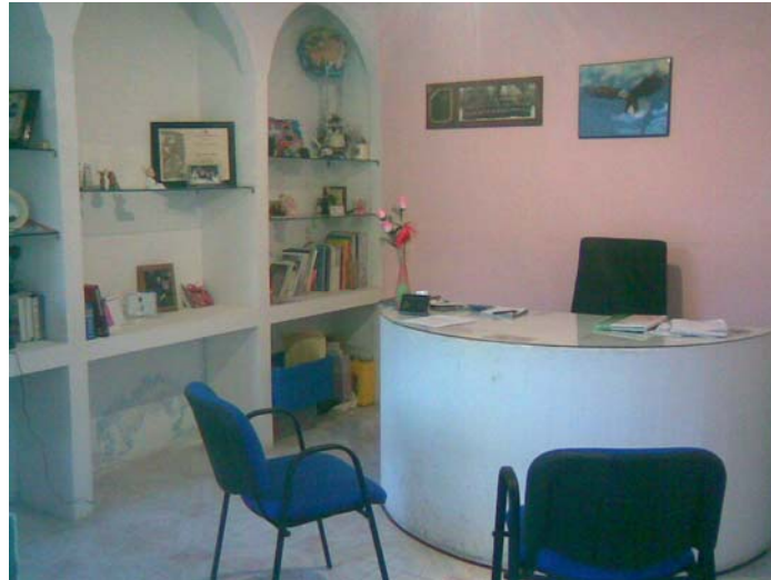
DIRECCION DEL COLEGIO