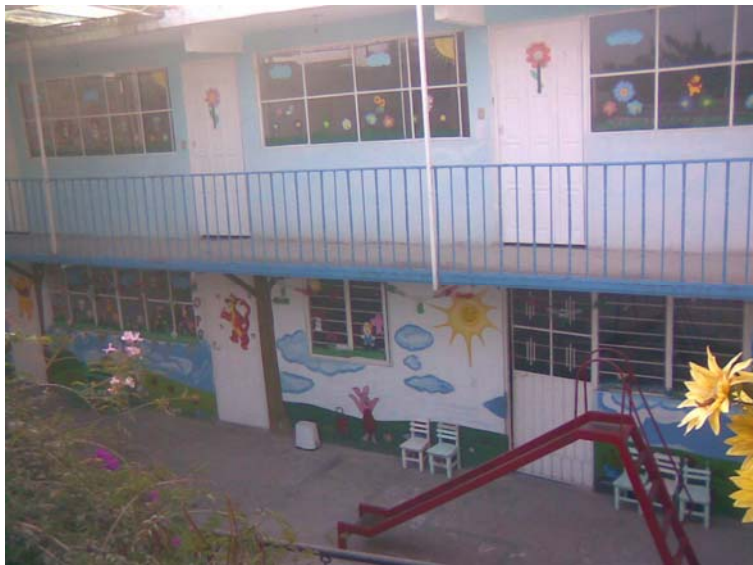
COLEGIO JANESVILLE CENTER (PATIO)