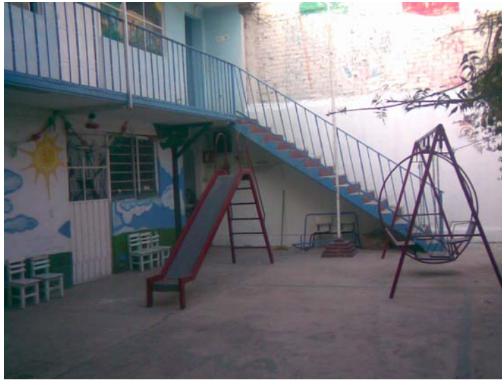
AREA DE JUEGOS