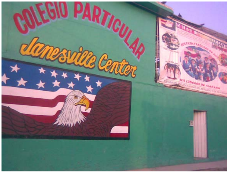
FACHADA DEL COLEGIO