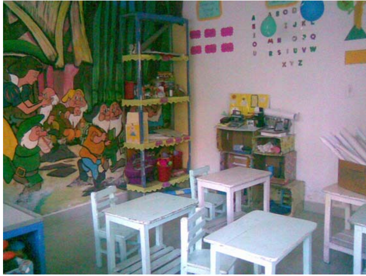
INTERIOR DE LOS SALONES