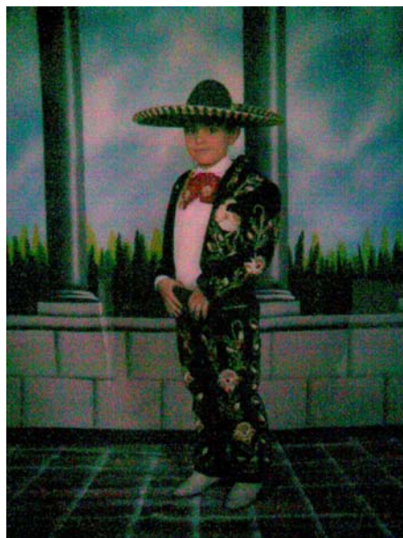
TRAJE TIPICO DEL CARNAVAL.