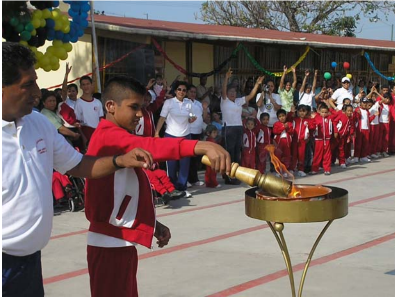
Inauguración de las actividades.