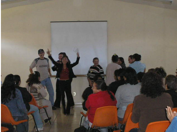
Actividades de juego entre padres de