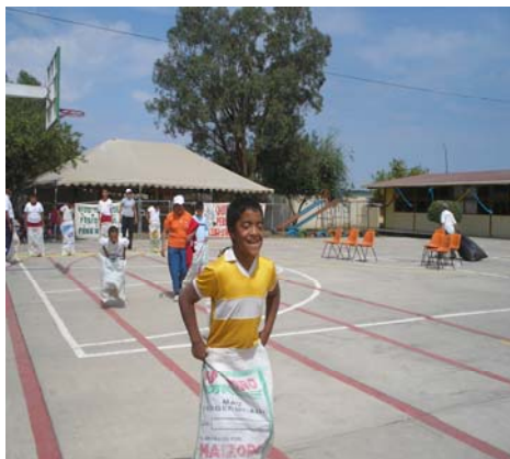
Niños y niñas de diferentes discapacidades participando.