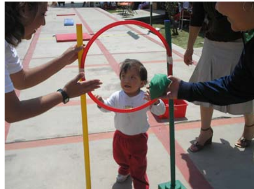
Niñas del área intervención temprana. 2-4 años.