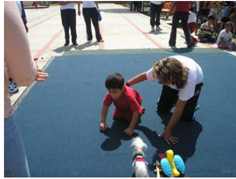
Niños y niñas de preescolar con discapacidad motora.