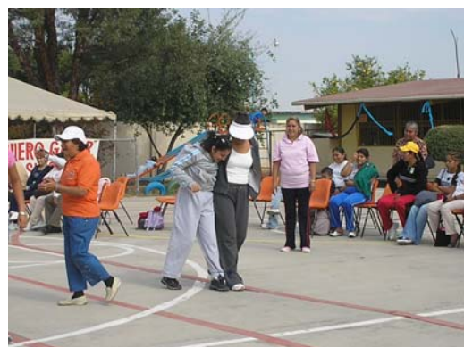
Padres de familia participando con sus hijos.