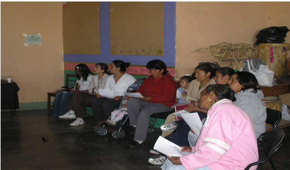
Madres de familia escuchando la conferencia en la casa de la cultura de Zamora Mich.