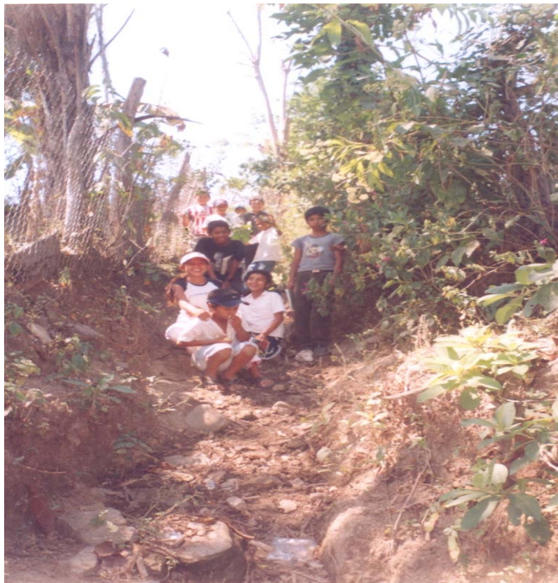
Caminábamos rumbo al cerrito de los padres, para platicar sobre la bonita historia, después redactarla y anexarla a su antología.