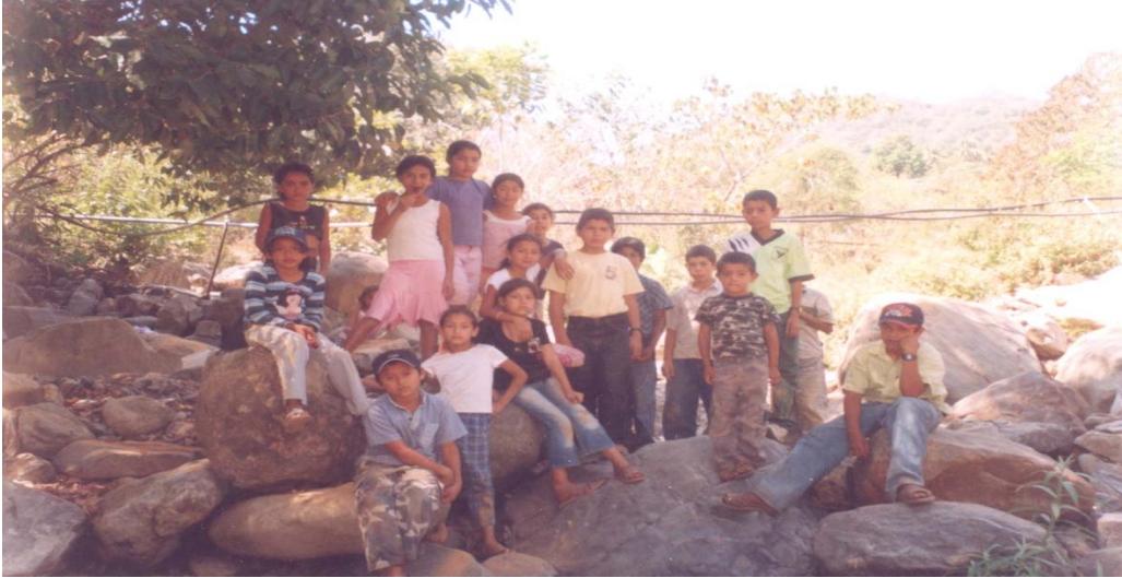
Esta foto esta tomada en el arrollo seco cuando caminábamos con los niños para poder redactar sobre lo visto e investigado.