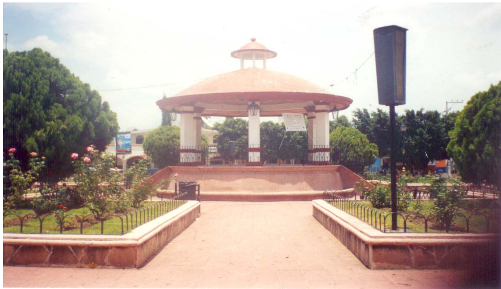
PLAZA DE QUITUPÁN