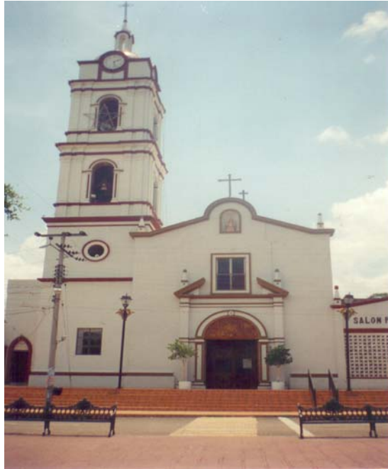
PARROQUIA DE QUITUPAN