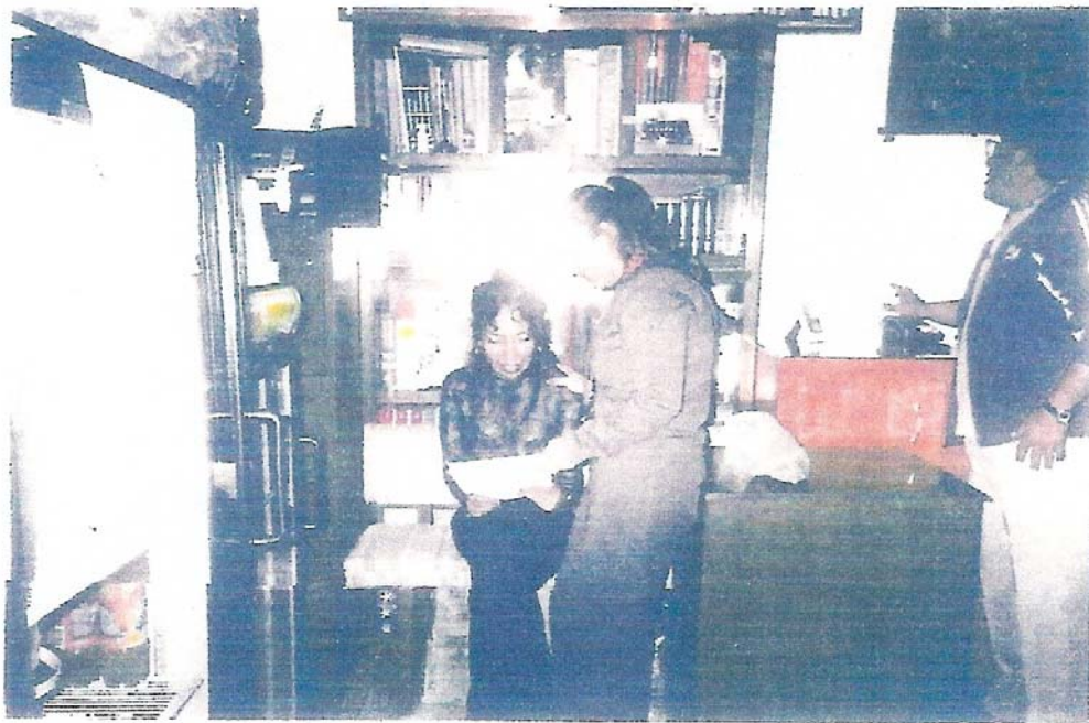
ENCUESTA A PADRES DE FAMILIA