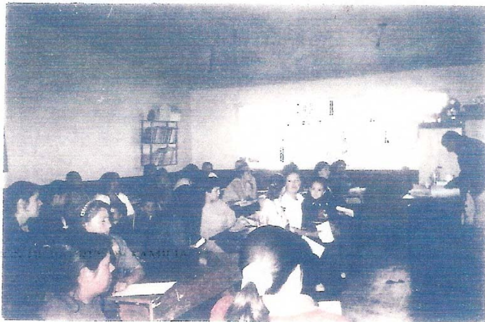
REUNION DE PADRES DE FAMILIA ANTES DE LA APLICACION DE LA ALTERNATIVA