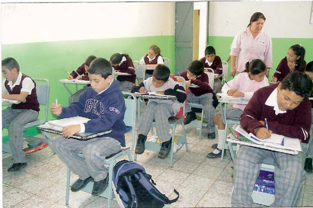
ALUMNOS DE CUARTO TRABAJANDO EN LA APLICACIÓN DE LA ALTERNATIVA